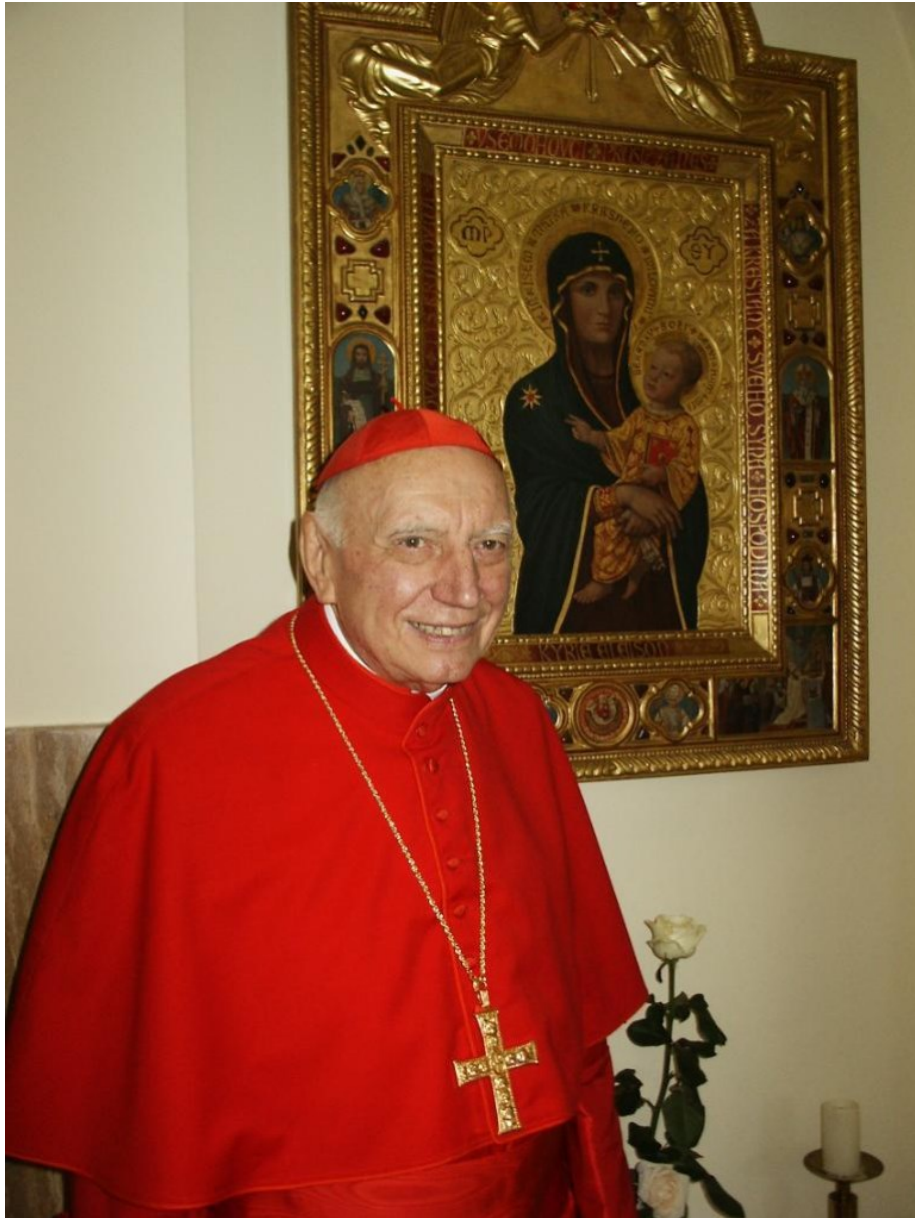
Príloha č. 1.

Špidlík po kreovaní za kardinála na návšteve „ Nepomucena “, kde pôsobil ako spirituál. V pozadí sa nachádza ikona Matky kresťanskej jednoty, nazývaný aj „ velehradské palladium “. Podľa tradície túto ikonu priniesli sv. Cyrila a Metod z Carihradu na Moravu.