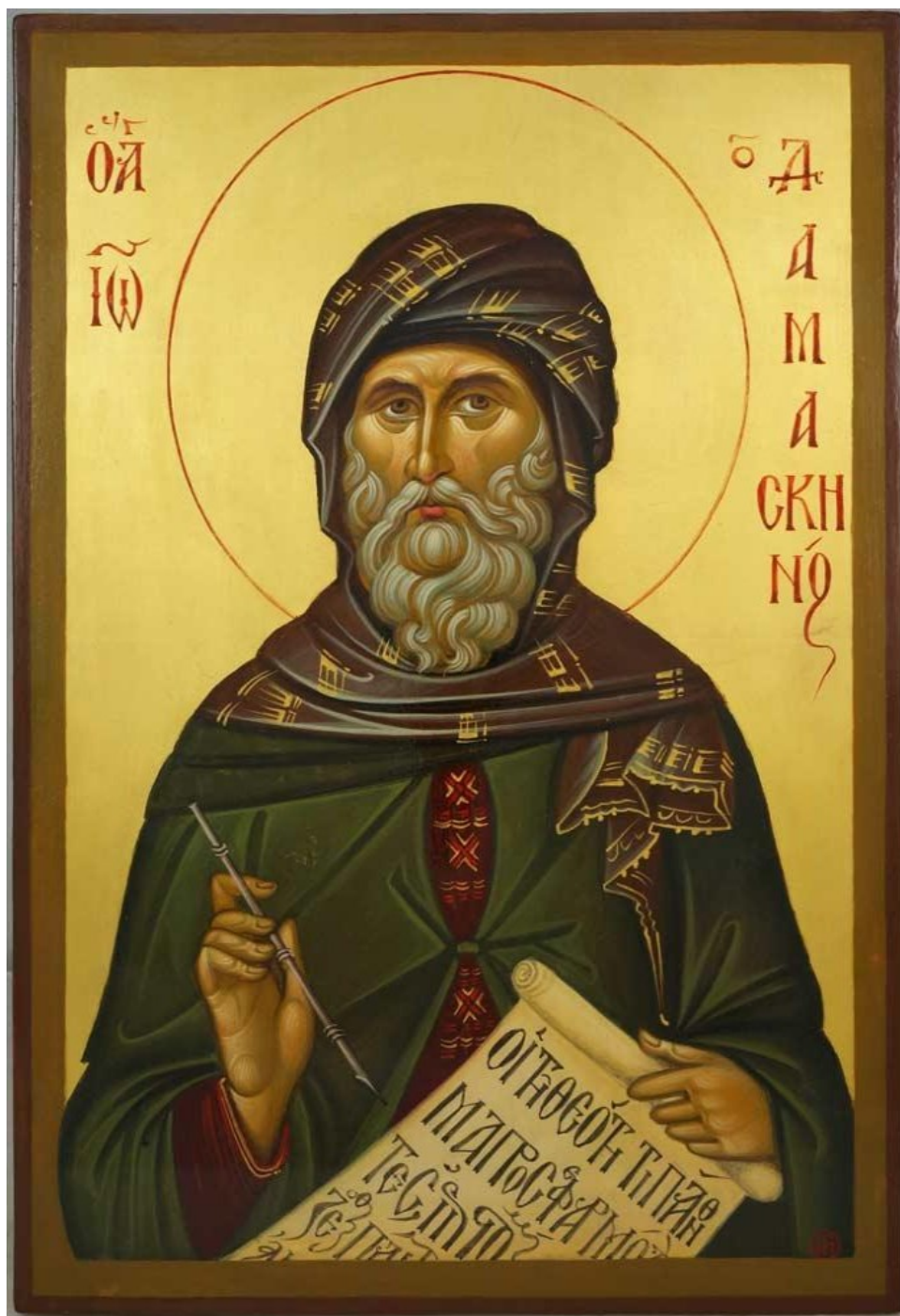
Príloha č. 2.

Ikona sv. Jána Damaského, ktorý patril medzi dôležitých obrancov ikon.