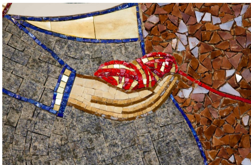
Príloha č. 13.

Detail pravej ruky Panny Márie zo Zvestovania Pána.