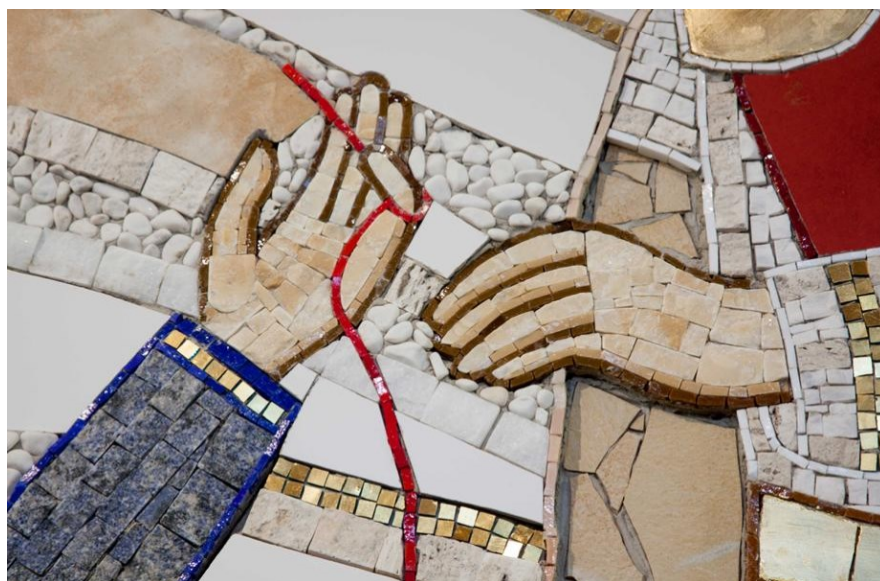
Príloha č. 12.

Detail ľavej ruky Panny Márie zo Zvestovania Pána.