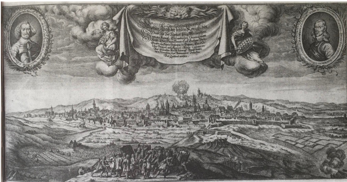
[6] Obr. 6 Matthäus Merian st. (malířská dílna) podle Karla Škréty: Obléhání Prahy Švédy v listopadu roku 1648 – Ukončení bojů.