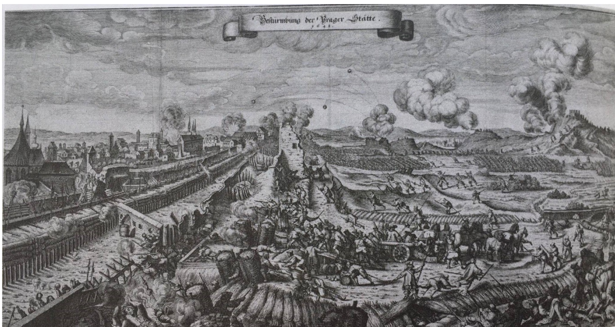
[7] Obr. 7 Matthäus Merian str. (malířská dílna) podle Karla Škréty: Útok Švédů na Nové Město pražské v říjnu 1648, mědiryt