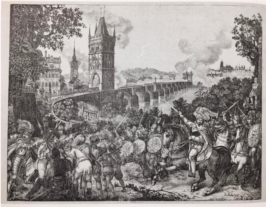
[5] Obr. 5 Dílo neznámého umělce založené na romantické představě z poloviny 19. století.