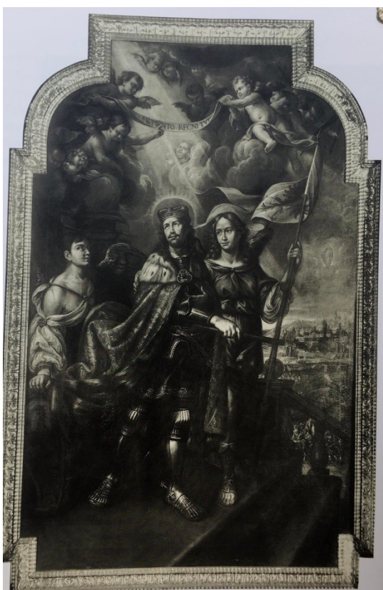
[8] Obr. 8 Antonín Stevens ze Steinfelsu: Sv. Václav jako obránce Prahy v roce 1648.