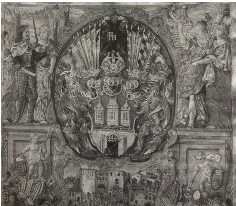
[1] Nově vylepšený, privilegovaný a zdokonalený erb Starého Města pražského. Privilegium vydané císařem Ferdinandem III. 20. dubna 1649.