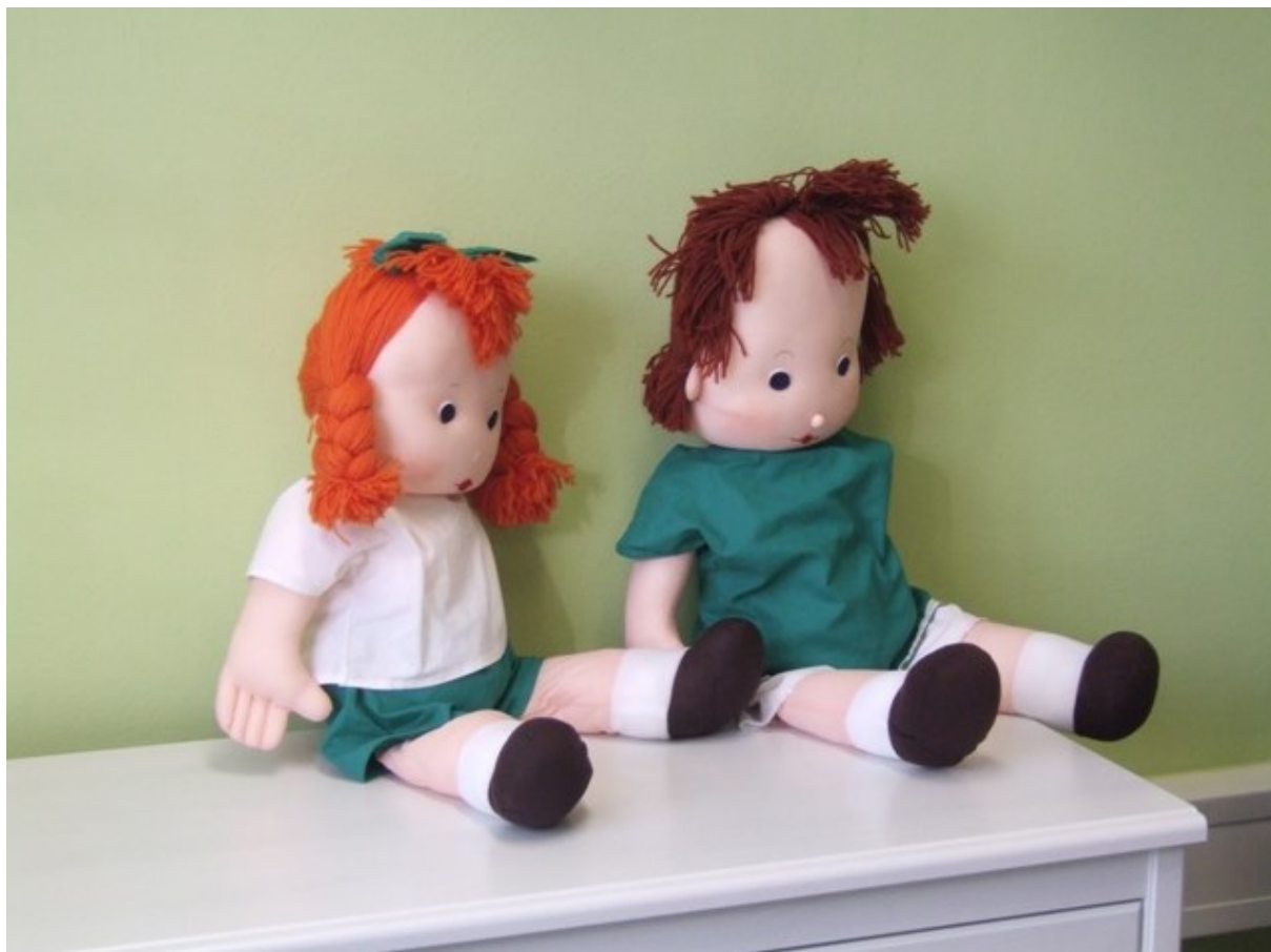
Obrázek 2 Panenky Jája a Pája