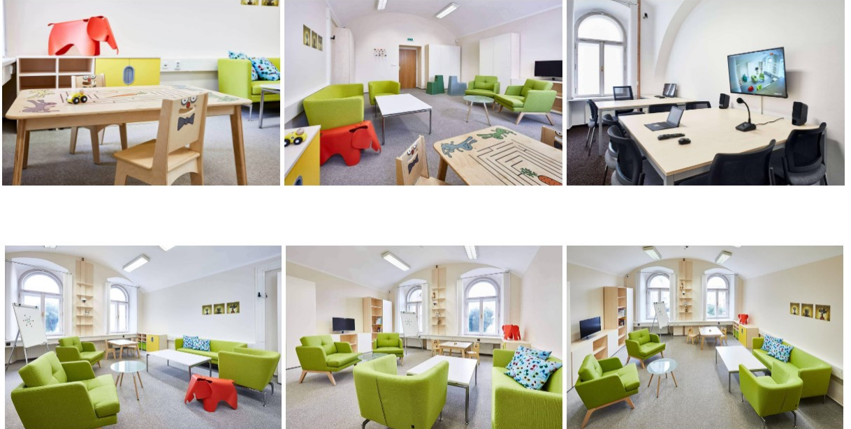
Obrázek 1 Výslechová místnost Okresního soudu v Tachově