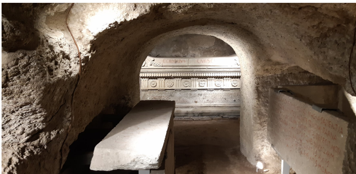
Obrázek 6: Vstupní pohled do hrobky; centrální místo zaujímá sarkofág Lucia Cornelia Scipiona Barbata; po levé straně obě části nápisu synova; po pravé straně nápis CIL 34.