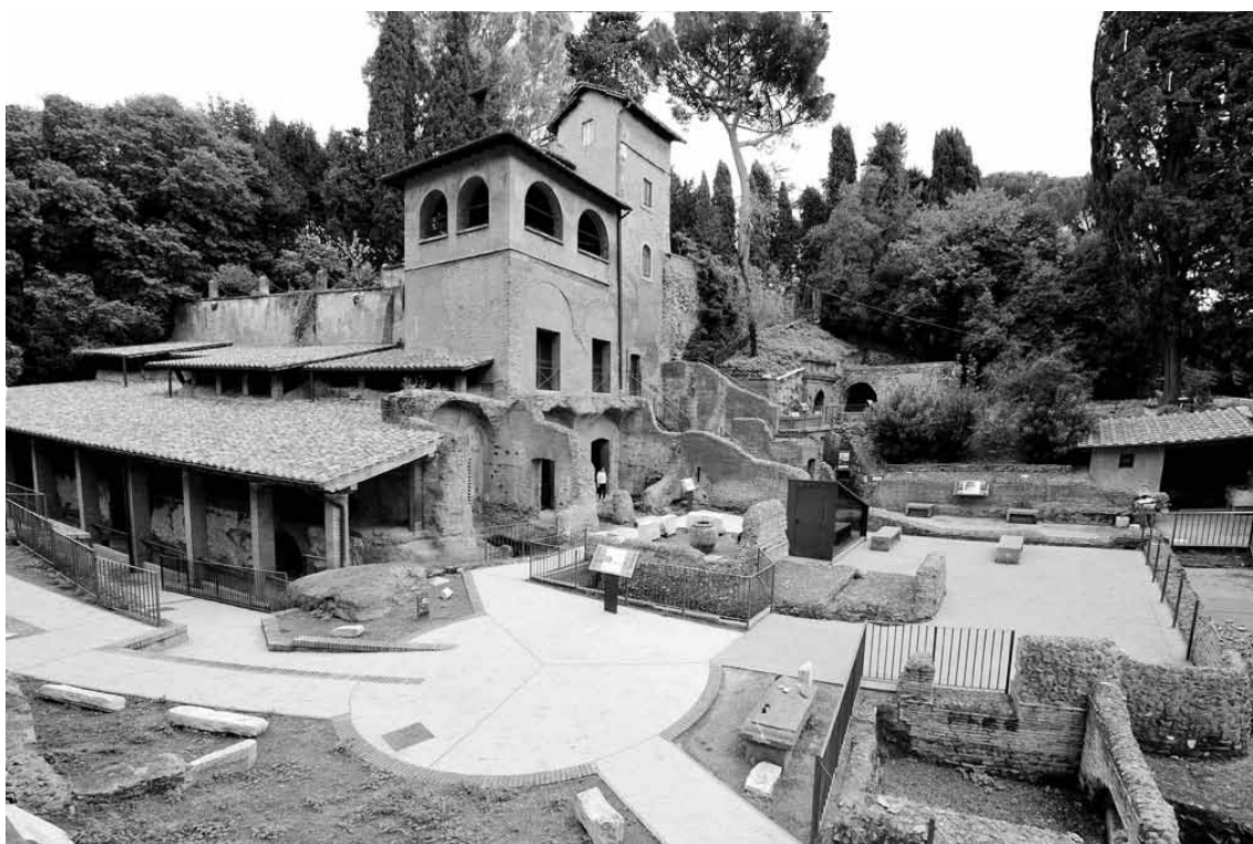
Obrázek 2: Pohled na areál hrobky ze severu; vpravo vstup z ulice Via di Porta S. Sebastiano; antický vstup do hrobky, dnes zastřešený, vidíme vlevo.