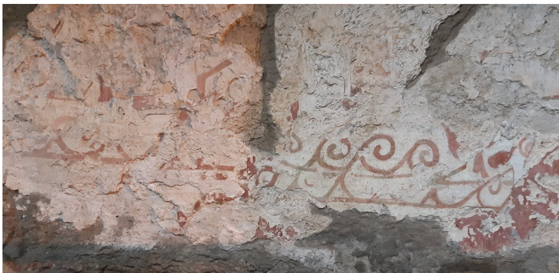
Obrázek 5: Pozůstatek freskové výzdoby vnější části hrobky (zdroj: osobní archiv autorky).