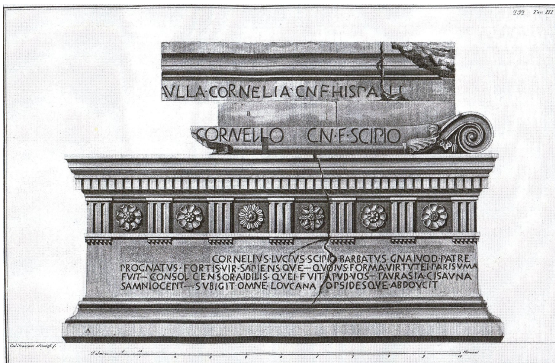
Obrázek 7: Rytina sarkofágu Lucia Cornelia Scipiona Barbata (CIL 29 a 30) a za ním umístěného sarkofágu Paully Cornelie (CIL 39).

CORNELIO L F SCIPIO AIDILES COSOL CENSOR HONORINO PLURVME COSENTIONT R DVONORO OPTVMO FVISE VIRO LVCIO M SCIPIONE FILIOS BARBATI NSOL CENSOR AIDILIS HIC FVET A HEC CEPIT CORSICA ALERIA QVE VRBE DEDET TEMPESTATE BVSAIDE MERE TO