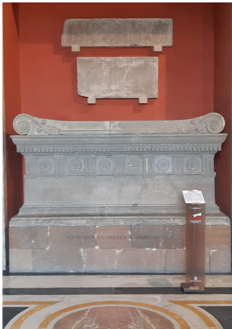
Obrázek 4: Vatikánská muzea; sarkofág Lucia Cornelia Scipiona Barbata a nad ním obě části nápisu patřící jeho synovi.