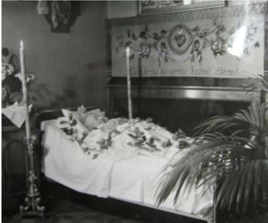
Metoděj Zavoral na úmrtním loži.