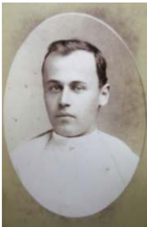
Metoděj Zavoral po kněžském svěcení v roce 1885.