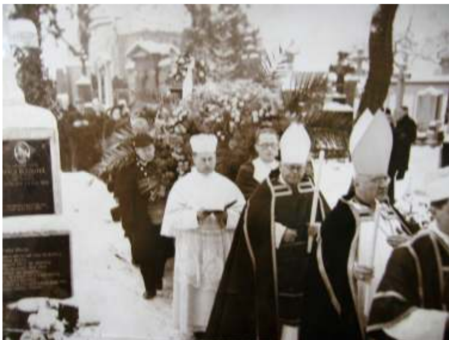
Pohřeb Karla Čapka na Vyšehradě 29. prosince 1938.