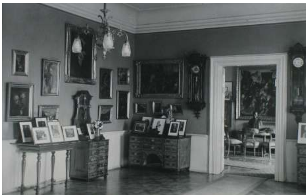
Přijímací salón prelatury strahovského kláštera