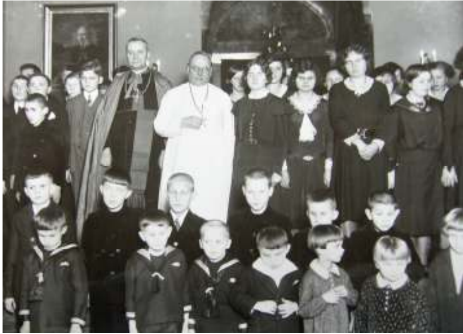
Jubilejní slavnost v hradčanském ústavu slepců 6. května 1932.