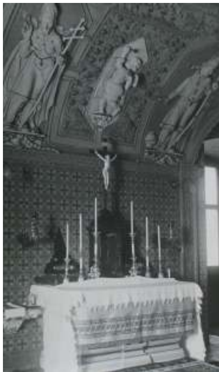
Opatská kaple prelatury strahovského kláštera