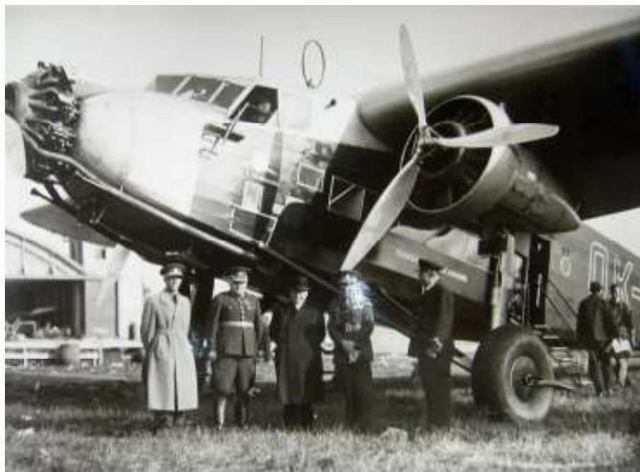
Metoděj Zavoral před odletem do Košic spolu s gen.Syrovým a ppl. Plassem ve Kbelích v roce 1936. Čs.státní aerolinie, tiskové oddělení. (Fond NA, kt. 1297, složka Metoděj Zavoral – fotografie)