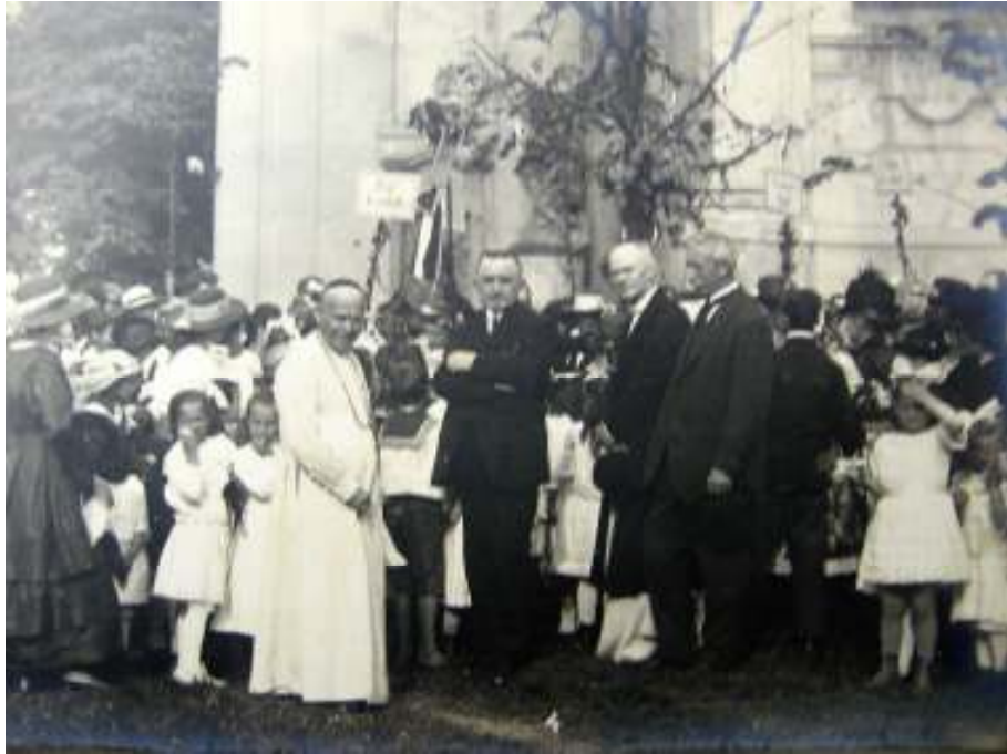
Sázení lípy svobody na strahovském nádvoří 1. června 1919.