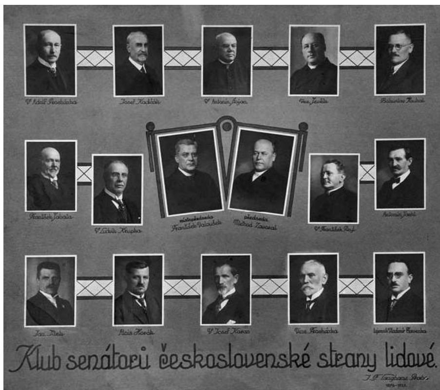
Klub senátorů ČSL v roce 1920. (Michal Pehr a kol.: Cestami křesťanské politiky , 362)