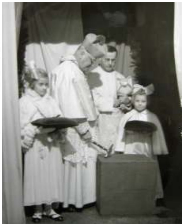
Svěcení základního kamene nového dívčího gymnázia na Vinohradech, 1936.