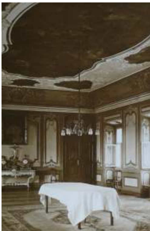
Opatská jídelna prelatury strahovského kláštera