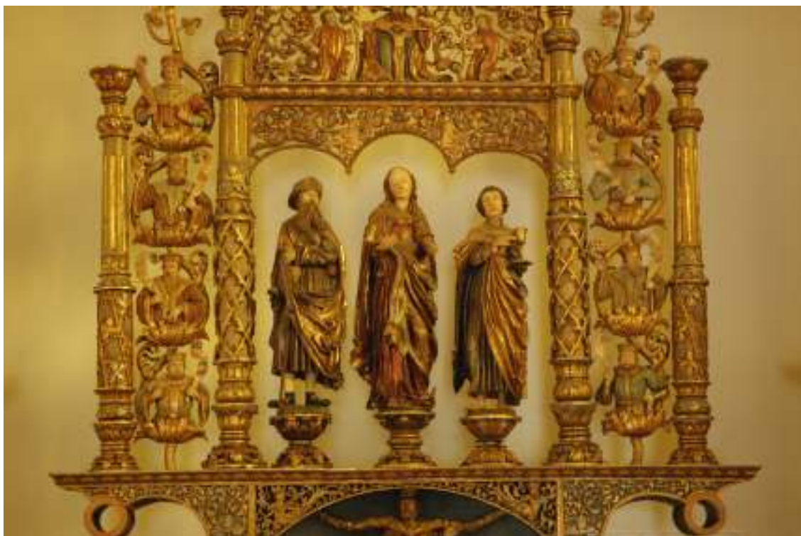
4. Detail: prvního oltářního nástavce ZRO