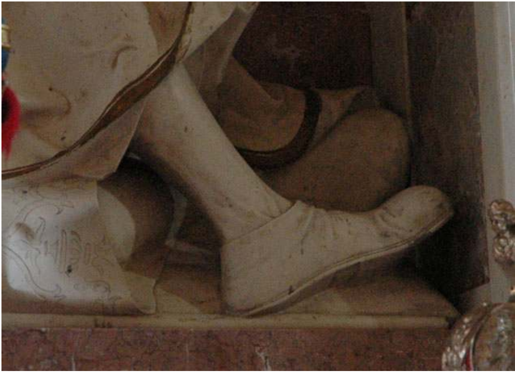
13. Detail ARO: Jesse bota