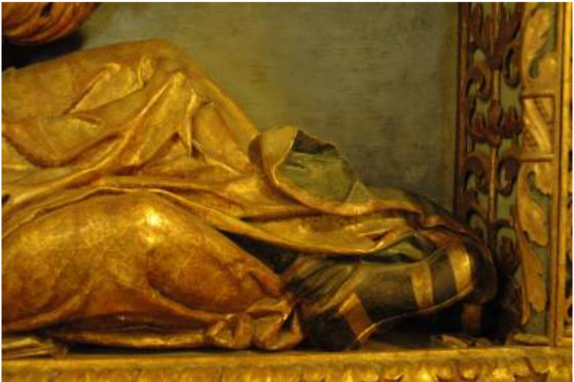
14. Detail ZRO: Jesseho bota