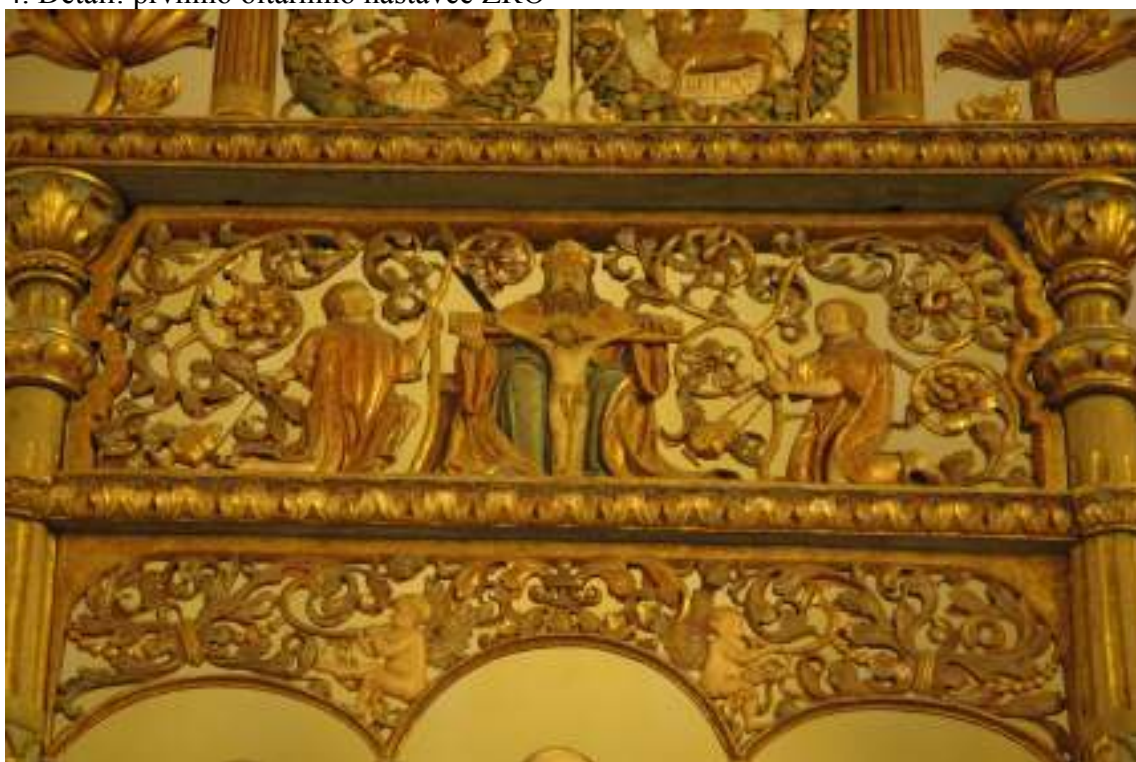
Detail ZRO: Ozdobná mřížka s trůnem milosti, kolem andělé s kadidelnicemi a pod nimi s polnicemi.