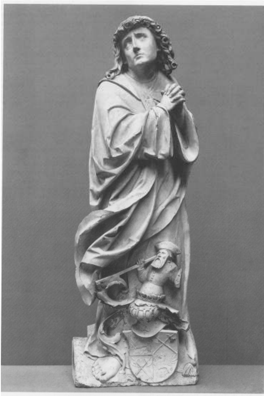
15.Hans Daucher: kolem 1524, 81,3 cm, lipové dřevo, nepolychromovaná, Londýn.