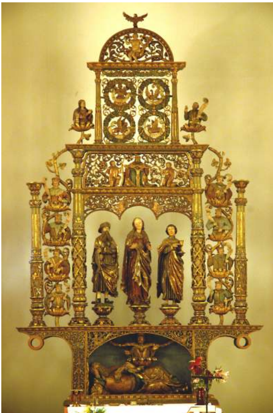
1. Mistr A.F.: Zbraslavský renesanční oltář, kolem 1525, cca 7 m, lipové dřevo, zbytky původní polychromie, Husitský sbor na Zbralavi.