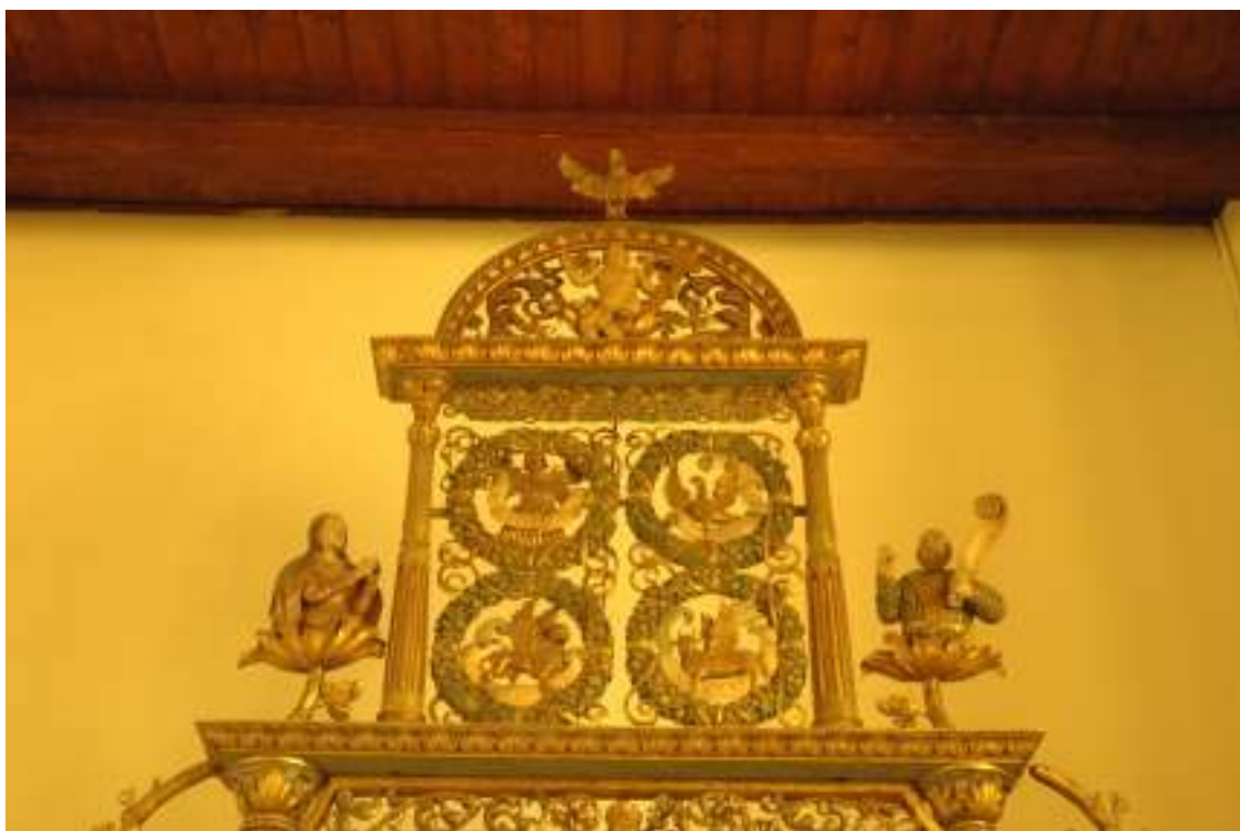
6.Detail ZRO: Druhý oltářní nástavec