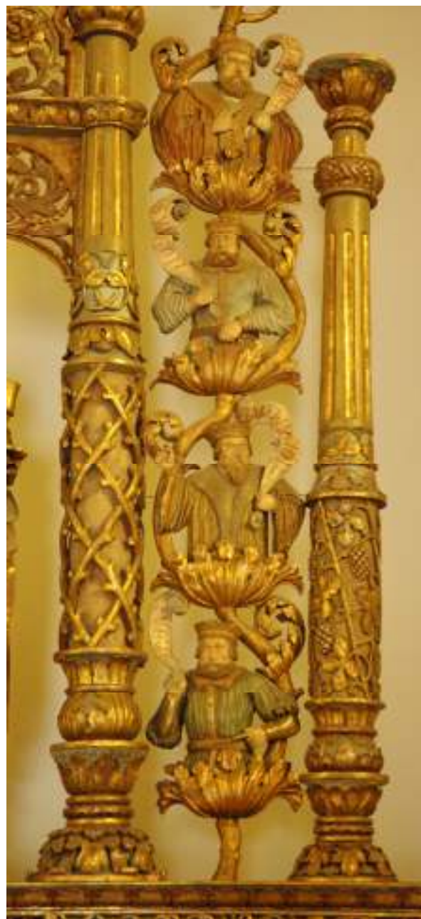
10. Detail ZRO: Postavy rodokmenu