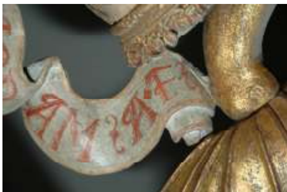
7. Detail ZRO: Monogram A.F. na pentli za jménem proroka Joráma