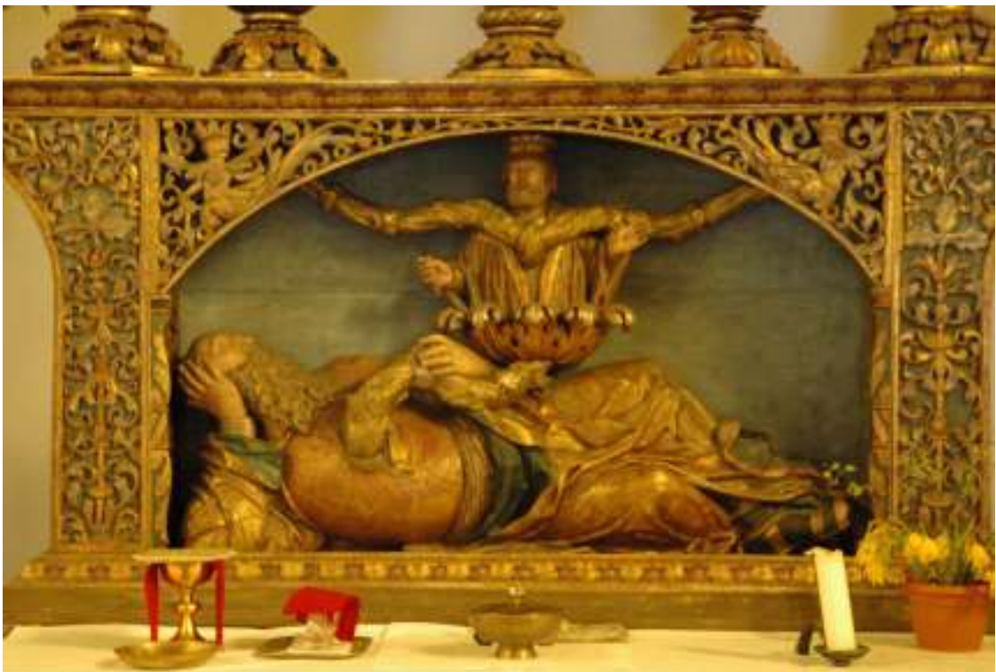
12. Detail ZRO: Praotec Jesse