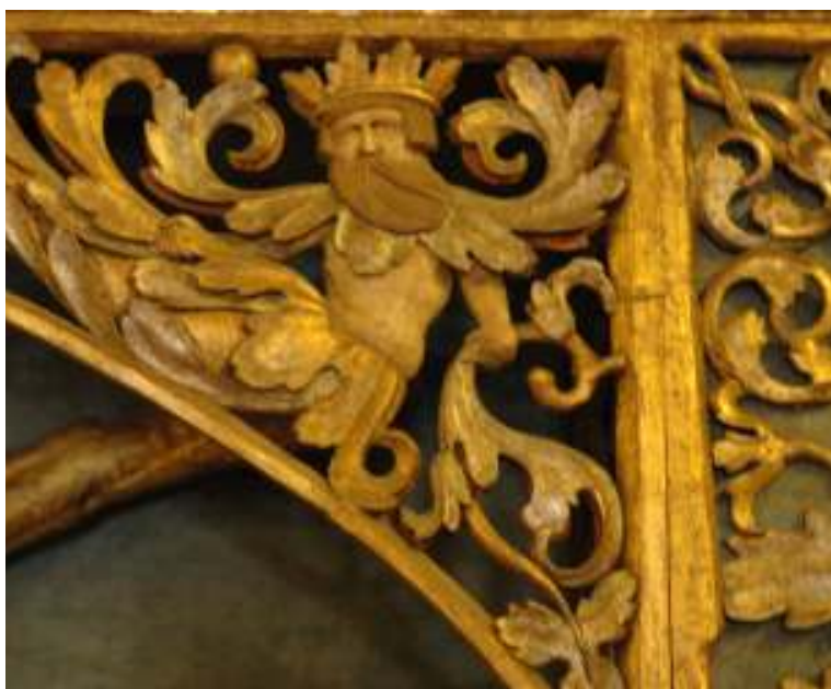
3. Detail ZRO: lesních mužíků na predelle