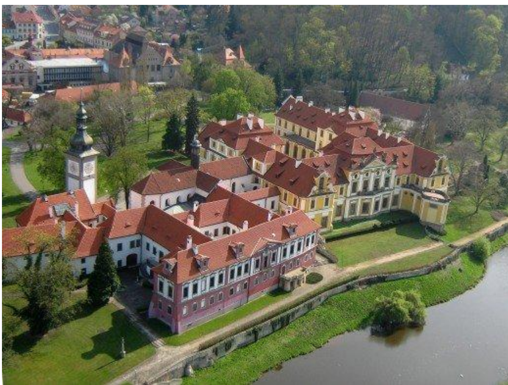
Obr. 11/ Soudobý letecký pohled na zbraslavský klášterní areál (dnes Zámek Zbraslav).