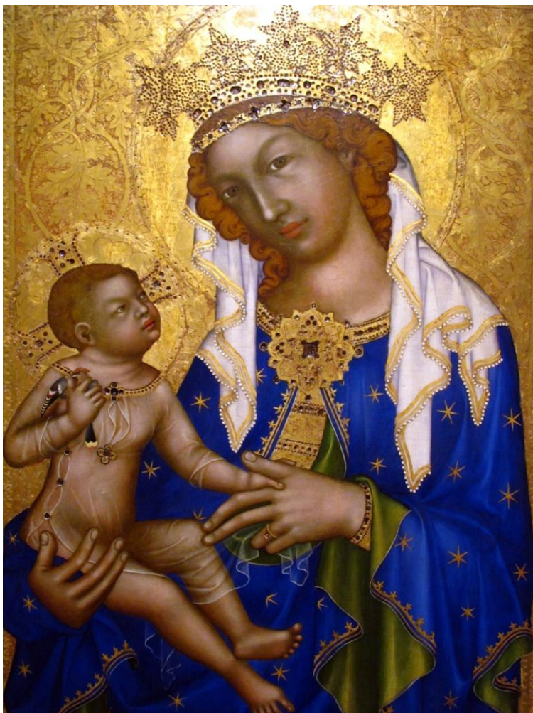
Obr. 5/ Fotoreprodukce originálu obrazu Madony zbraslavské.