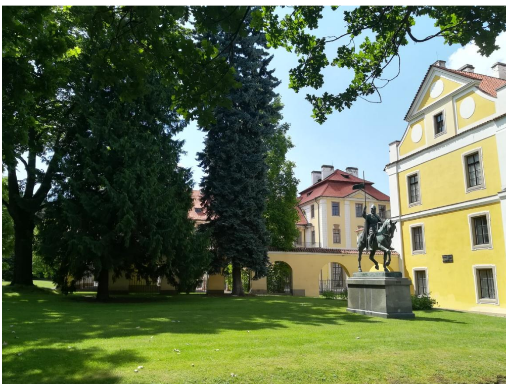
Obr. 4/ Místo původního hrobu Václava II. v presbytáři mariánského chrámu.