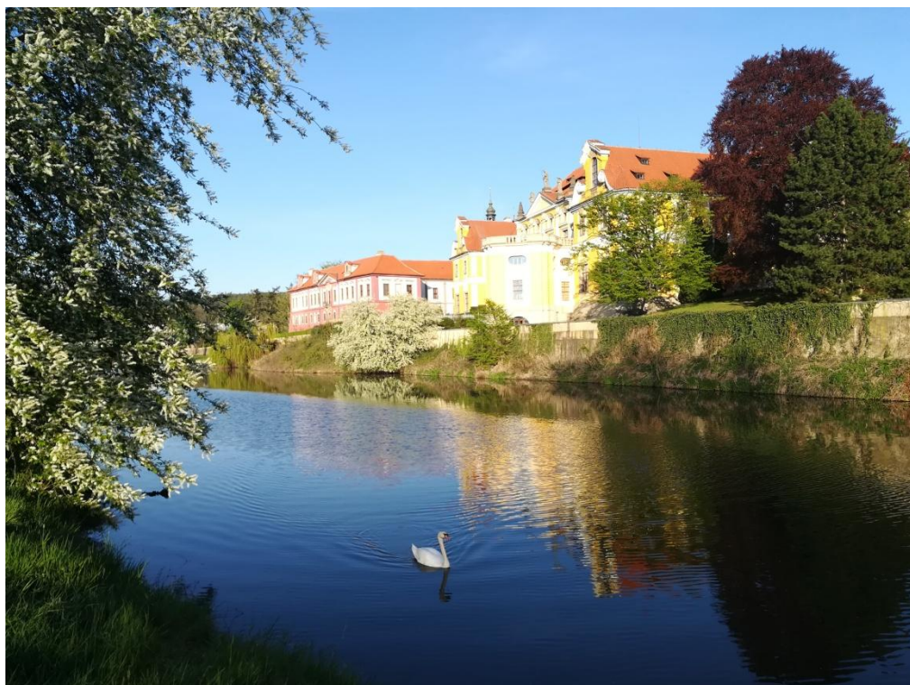
Obr. 1/ Zbraslavský konvent ze severu od mrtvého ramene řeky Mže (Berounky).