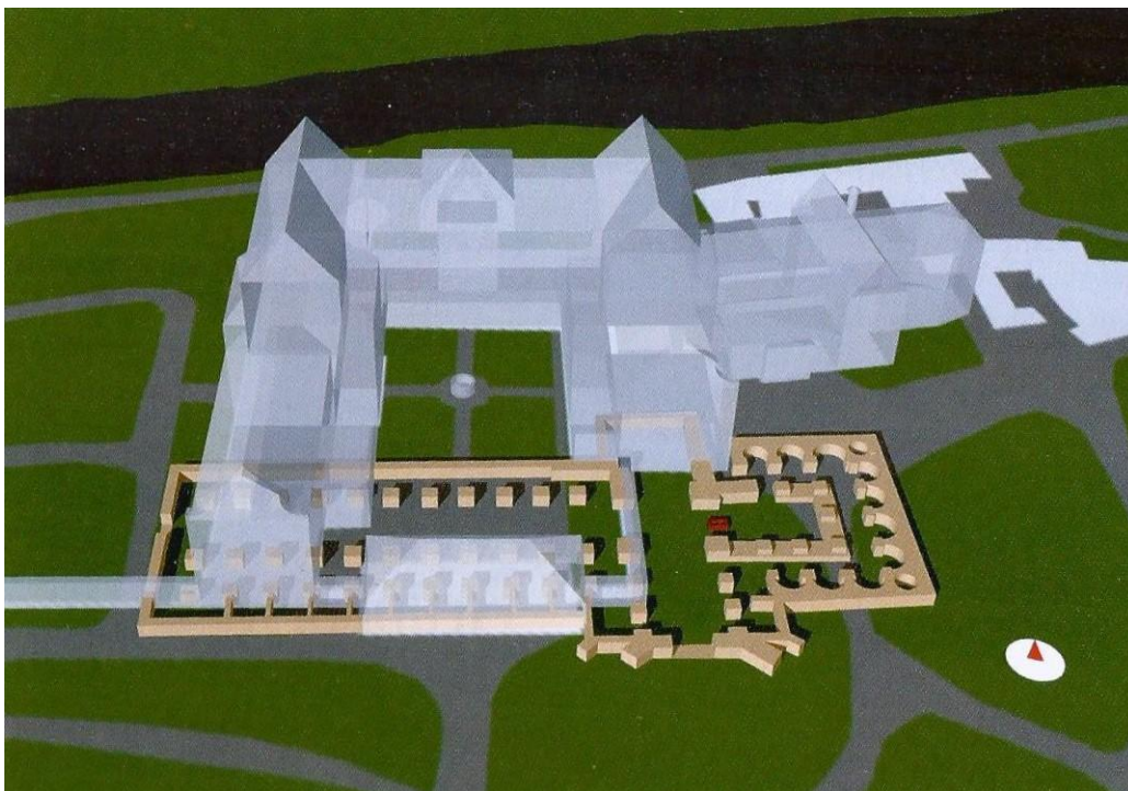
Obr. 3/ Vizualizace půdorysu mariánského chrámu podle archeologického výzkumu z 2. poloviny 70. let 20. století.