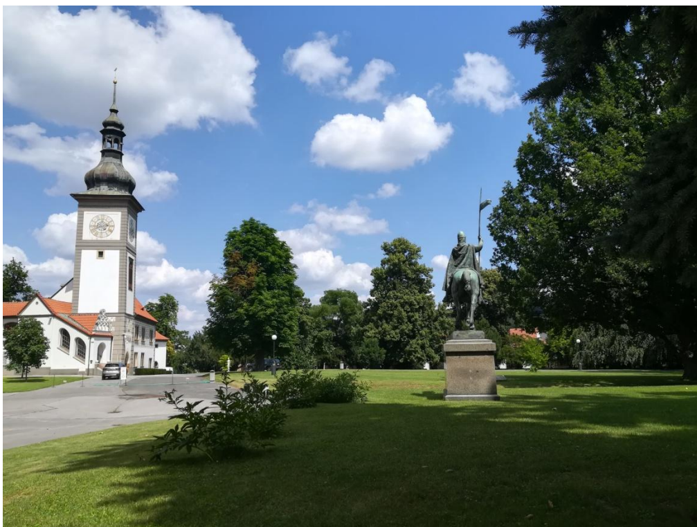
Obr. 12/ Současný pohled z místa bývalého presbytáře mariánského chrámu, v pozadí původní královský lovecký dvorec v dnešní podobě.