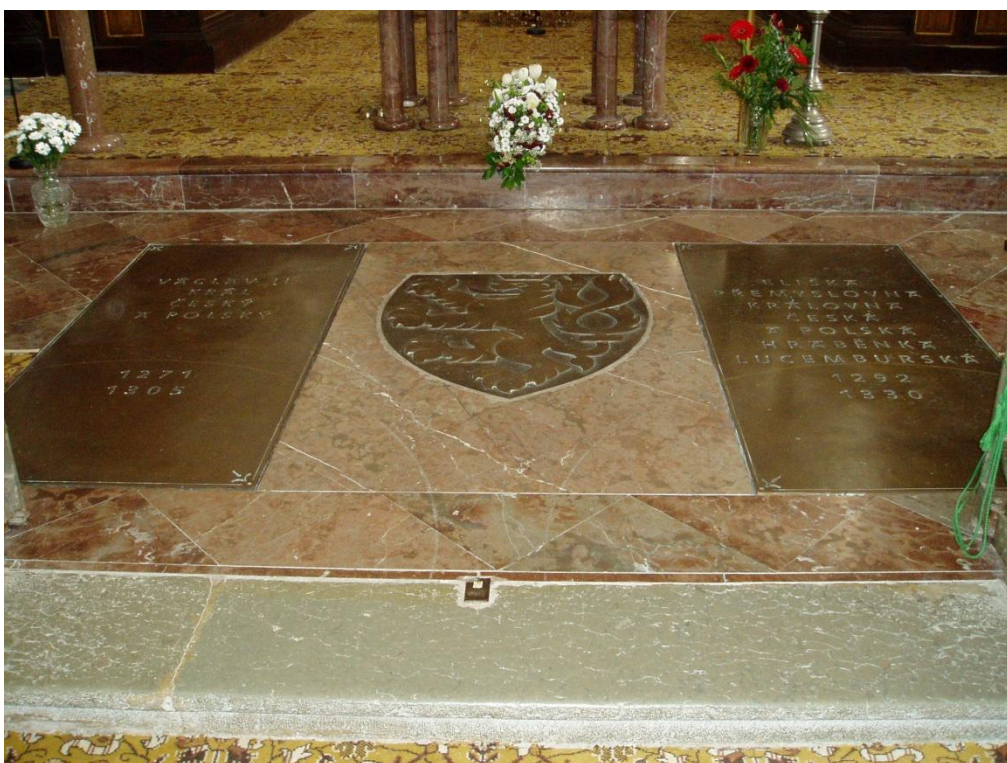
Obr. 9/ Současné uložení ostatků Václava II. a Elišky Přemyslovny v kostele sv. Jakuba St. na Zbraslavi.