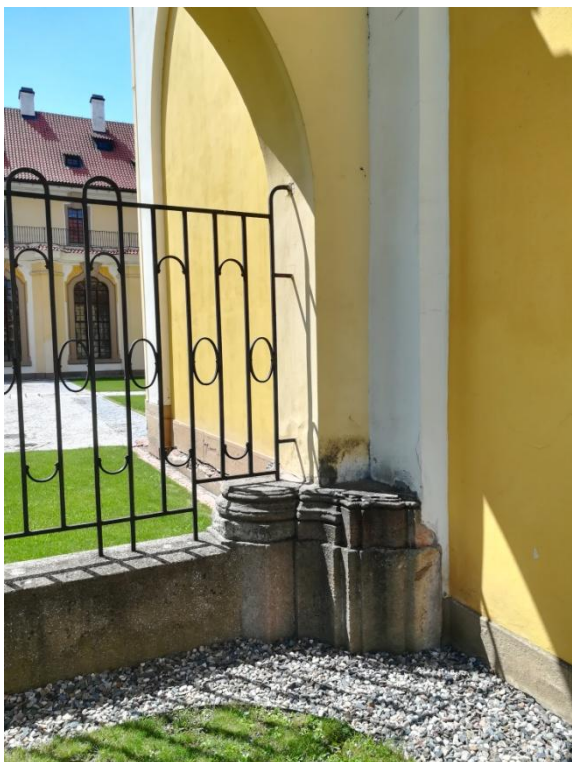
Obr. 10/ Dodnes patrný zbytek gotického pilíře mariánského chrámu.