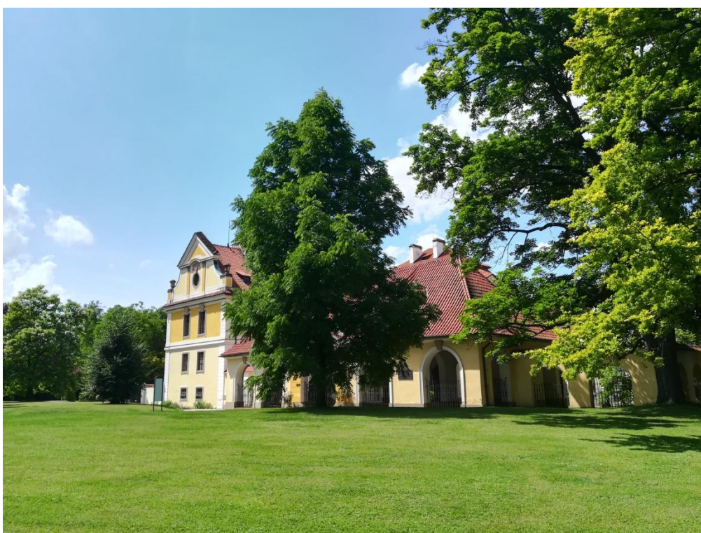
Obr. 6 a 7/ Současné pohledy na místo, kde stál mariánský chrám.