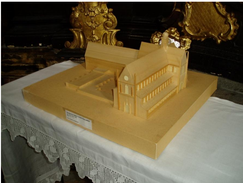
Obr. 8/ Soudobý model zbraslavského mariánského chrámu s částí konventu. Foto autor.