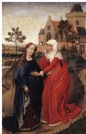
Obrázek č. 3: Navštívení Marie Alžbětou

Rogier van der Weyden – Navštívení Marie Alžbětou, 1445, olej na dřevě, Muzeum Lipsko.