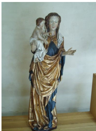
Obrázek č. 2: Madona františkánská

Praha, po 1350, odlitek: epoxidová pryskyřice, polychromie originál: lipové dřevo, pozdější polychromie, v. 134 cm