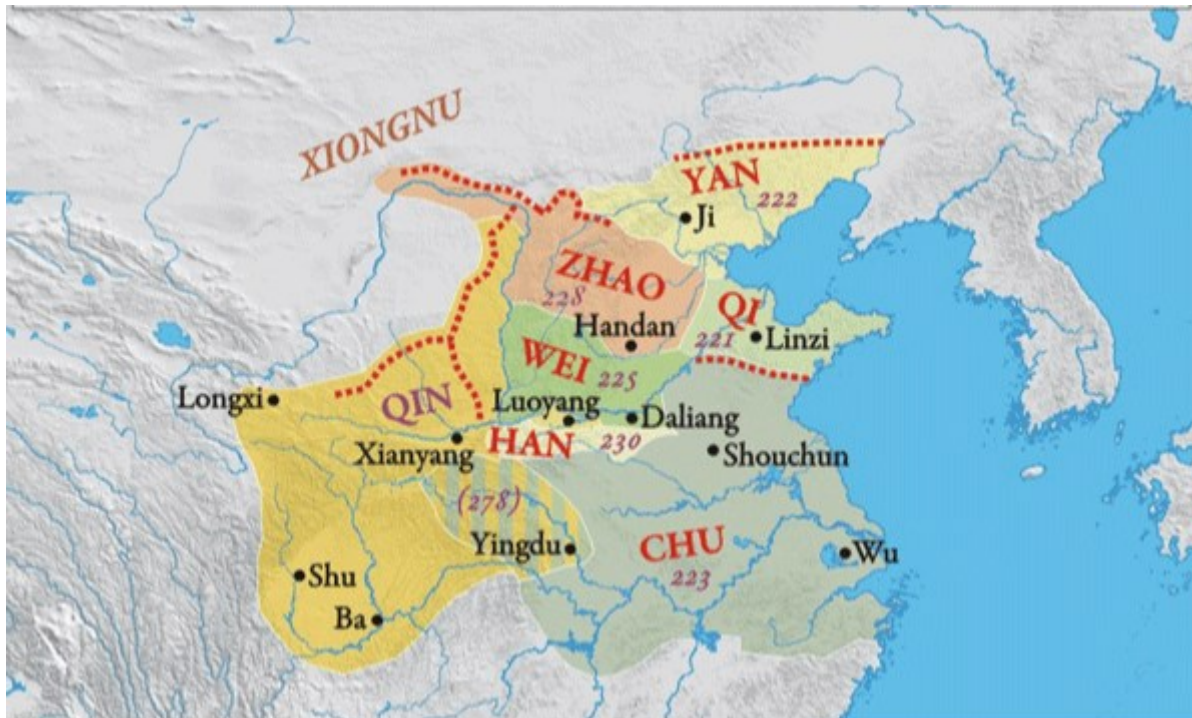
Mapa 4: Šrafovaně je vyznačena oblast kolem města Ying, která po invazi roku 278 př. n. l. připadla Qin. 8

qinský nejvyšší ministr Wei Ran 魏冉. Od této chvíle se vojenská strategie státu Qin do značné míry podřizovala partikulárním zájmům Wei Rana a jeho klanu při snaze o rozšíření enklávy o další území (Lewis 1999: 638). Nejen že realizace jeho plánů odčerpávala ohromné množství materiálních zdrojů qinského státu, ale zároveň úspěšně antagonizovala státy, které by jinak pravděpodobně neměly důvod být vůči Qin nepřátelské.