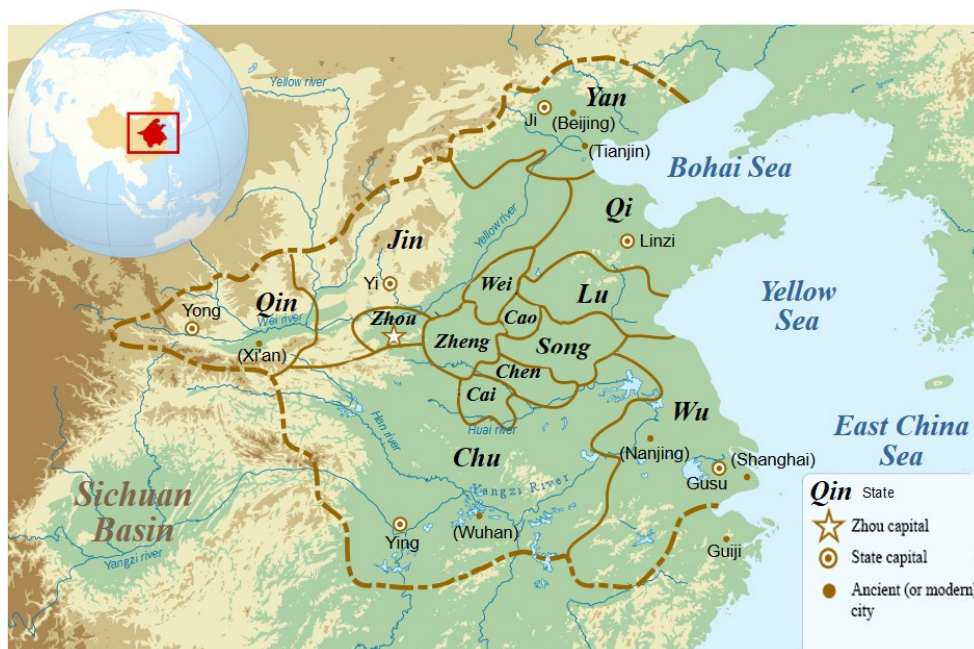
Mapa 1: Politická mapa čínského civilizačního okruhu na přelomu doby Letopisů a Válčících států (5. století př. n. l.). 1

Stát Qin se nacházel v pohraniční oblasti Yongzhou a nezapojoval se do aliancí údělných vládců centrálních států, kteří [na Qin] pohlíželi stejně jako na barbary Di a Yi (Lomová 2012: 154).