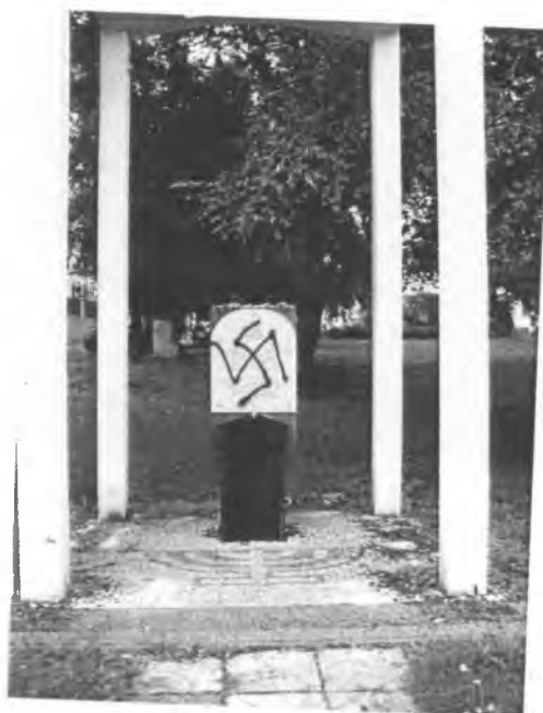
Foto poškozeného pomníku v Teplicích 2005