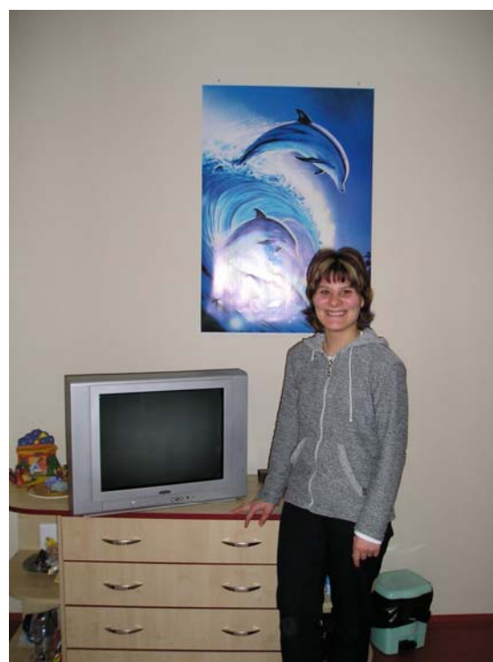
Slečna V. s věcmi, na které si vydělala díky podporovanému zaměstnání