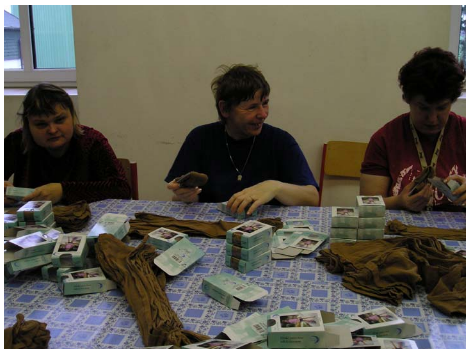
Klientky při práci