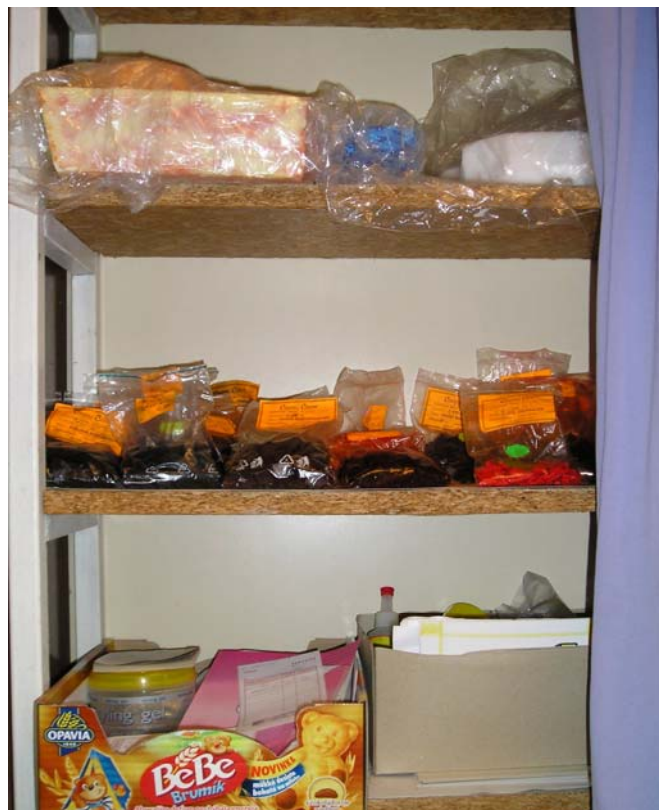
Barvy a esence do svíček