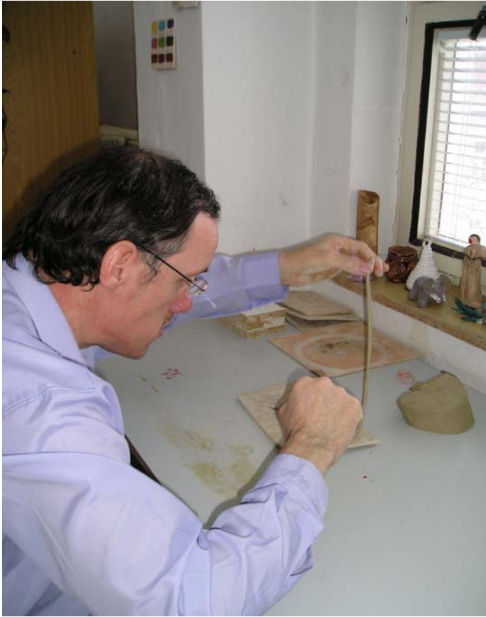
Klienti při činnosti v keramické dílně