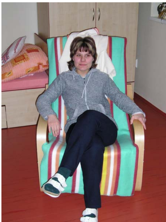
Slečna V. ve svém pokoji v chráněném bydlení