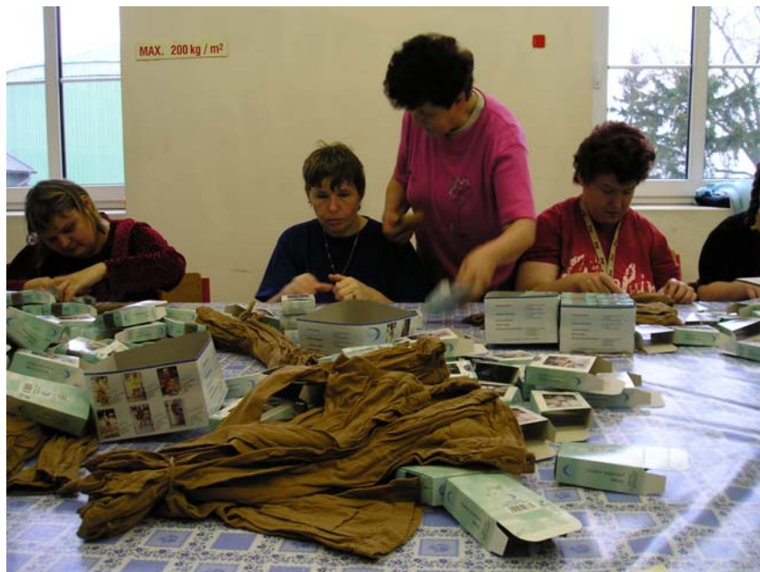
Vysvětlování postupu pracovníci firmy Darren s.r.o.