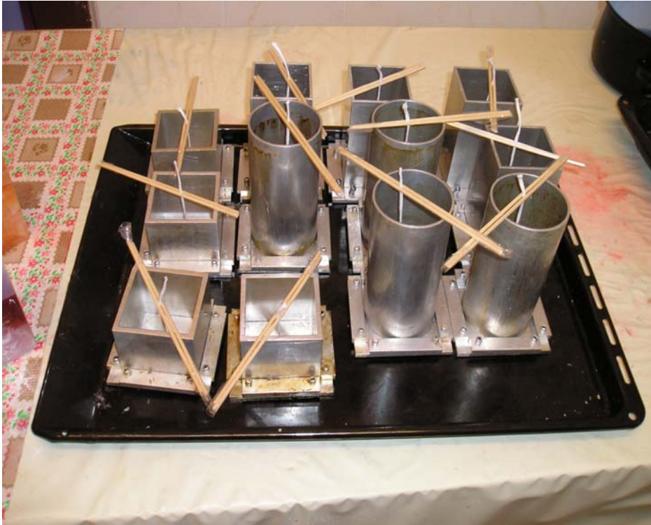
Formy na svíčky