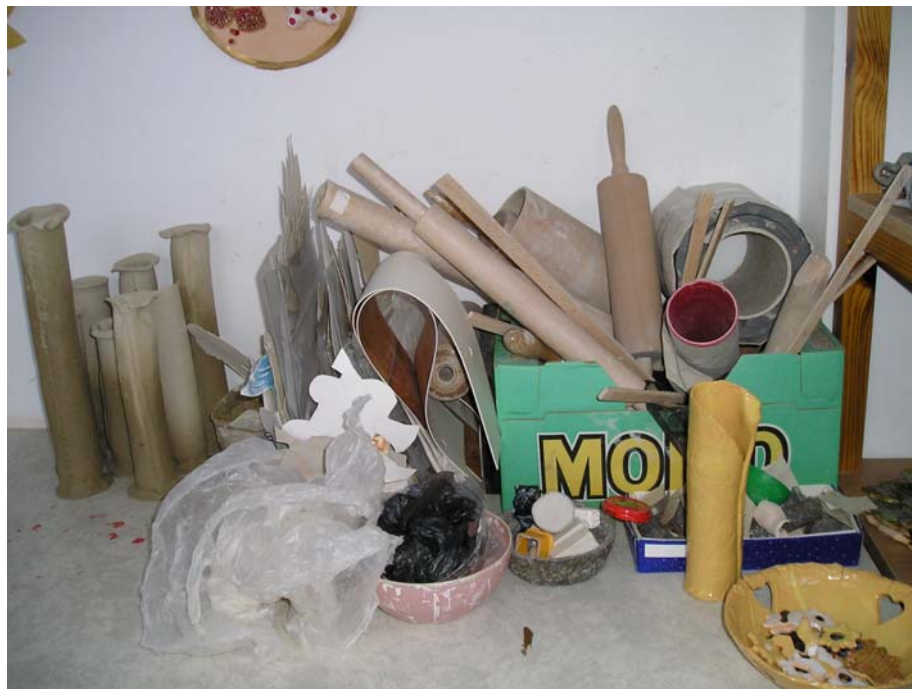
Nástroje na výrobu keramiky