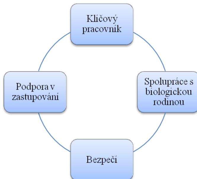
Obrázek 2: Podpora ze strany doprovázející organizace

Pěstouni si mohou vybrat ve svém kraji jakoukoliv doprovázející organizaci, která nejen, že nabízí služby dané zákonem, jak jsem již avizovala v teoretické části, může nabízet i nadstandardní služby. Pěstouni se ale shodují, že více důležité než doprovázející organizace, je pro ně důležitější jejich klíčový pracovník, který jim nabízí služby a možnosti podpory pro zajištění stability v rodině.