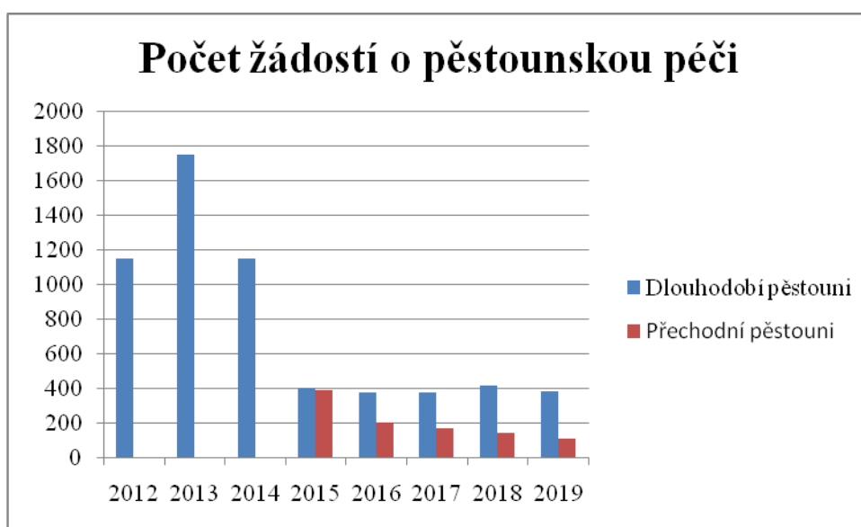
Graf 1: Počet žádostí pěstounskou péči v ČR v letech 2012–2019

Diplomová práce se zabývá podporou pěstounských rodin, abych mohla navrhnout doporučení pro zlepšení situace na poli náhradní rodinné péče, dále jen NRP, ve vybraných krajích v České republice, dále jen ČR, kdy ze statistik MPSV z roku 2019 vyplývá, že počty žadatelů o pěstounskou péči dlouhodobou a přechodnou stagnují. Považuji proto za důležité poukázat na fungování NRP v zahraničí, kde pro výsledky dobré praxe můžeme nahlédnout k našim sousedním zemím jako je Polsko, Slovensko a Německo. Jejichž systém NRP se tolik neliší od našeho, přesto může přinést řadu nových poznatků a inspirace.