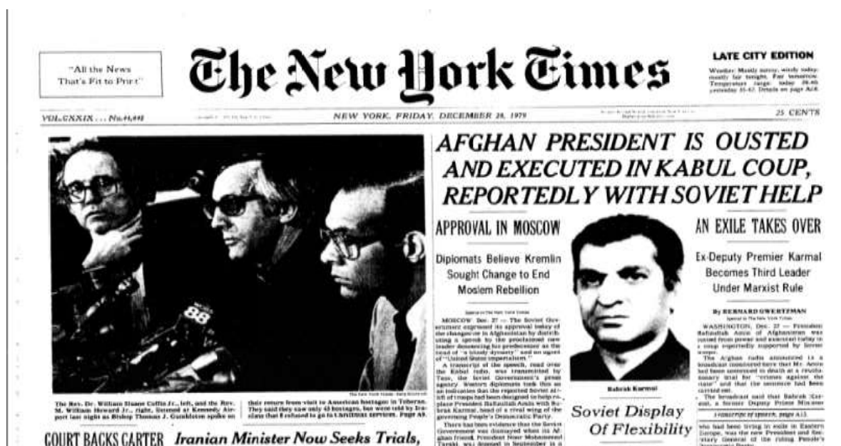
Vydání New York Times z 28. 12. 1979, informující o převratu v Afghánistánu. 80

V následujících vydáních se New York Times zaměřilo na podrobnou analýzu sovětské invaze, množství jednotek, důvody a pozadí celé události. Zpravodajství Times se opírá na základě poznatků a prohlášení jak vládních zdrojů a expertů, tak zpravodajských služeb. Již 28. prosince se můžeme dočíst o zabití Amína, nejspíš sovětskými jednotkami a potenciálním vývoji tohoto nového konfliktu. Periodikum také poskytuje stručný náhled do geografie, historie a politiky státu 76 . Zprávy se vesměs shodují průběhem události, podle historických pramenů. V textu se objevuje záměna oficiálního označení národní příslušnosti „Sověti“ za poněkud méně vytříbené „Rusové“ a jsou zde projektovány obavy amerických vládních představitelů a spojenců USA 77 . Dále jsou zde časté narážky na podobnost s dřívější válkou ve Vietnamu, kde „Rusové z blízka sledovali vývoj účasti Spojených států ve Vietnamu...“ 78 . Dle periodika by se Sověti měli z americké anabáze poučit, a i přes obtíže, které na ně v afghánských horách pravděpodobně čekají, by měli i díky těmto poznatkům potlačit jakýkoliv odpor 79 .