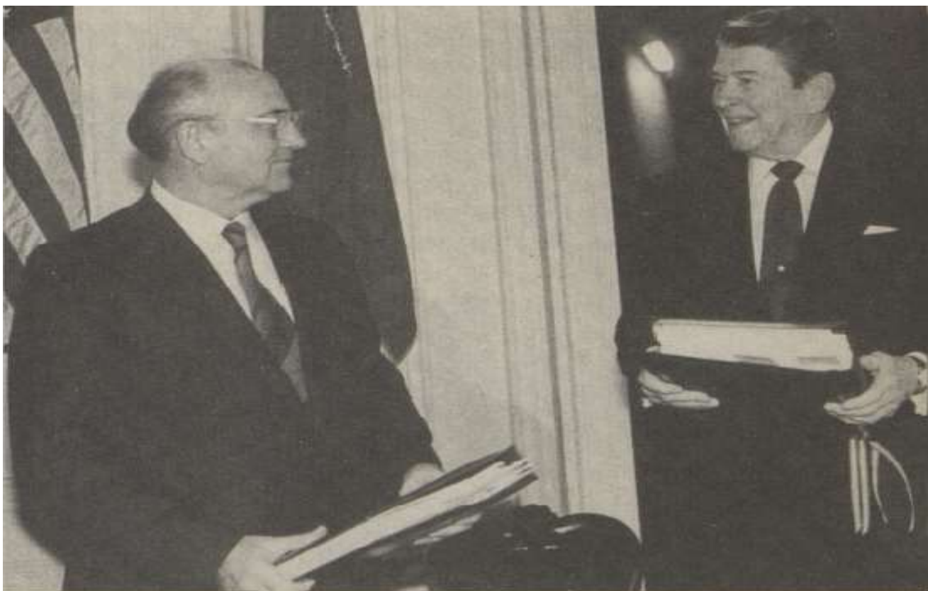
Setkání generálního tajemníka KSSS, Michaila Gorbačova a prezidenta Spojených států, Ronalda Reagana. 101

V této kapitole se tedy zaměříme na vyobrazení období afghánského konfliktu kolem Čruščovova nástupu, který proběhl 11. března 1985 a dále na vyjednávání o pomoci povstalců raketami Stinger na přelomu března a dubna roku 1986, popř. na jejich první historické nasazení v Afghánistánu, které podle dostupných historických zdrojů proběhlo 26. září 1986.