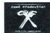
symbol Země především! Earth First!