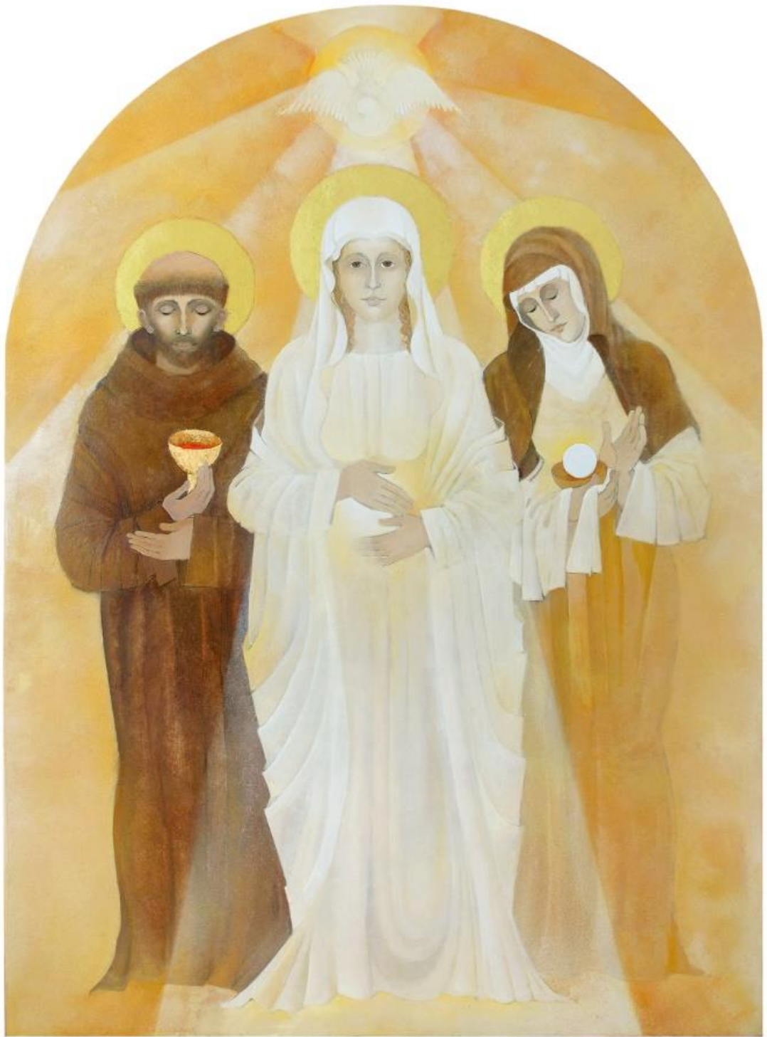
OBRÁZOK 6 – PANNA MÁRIA, KRÁLOVNÁ EUCHARISTICKÝCH DUŠÍ