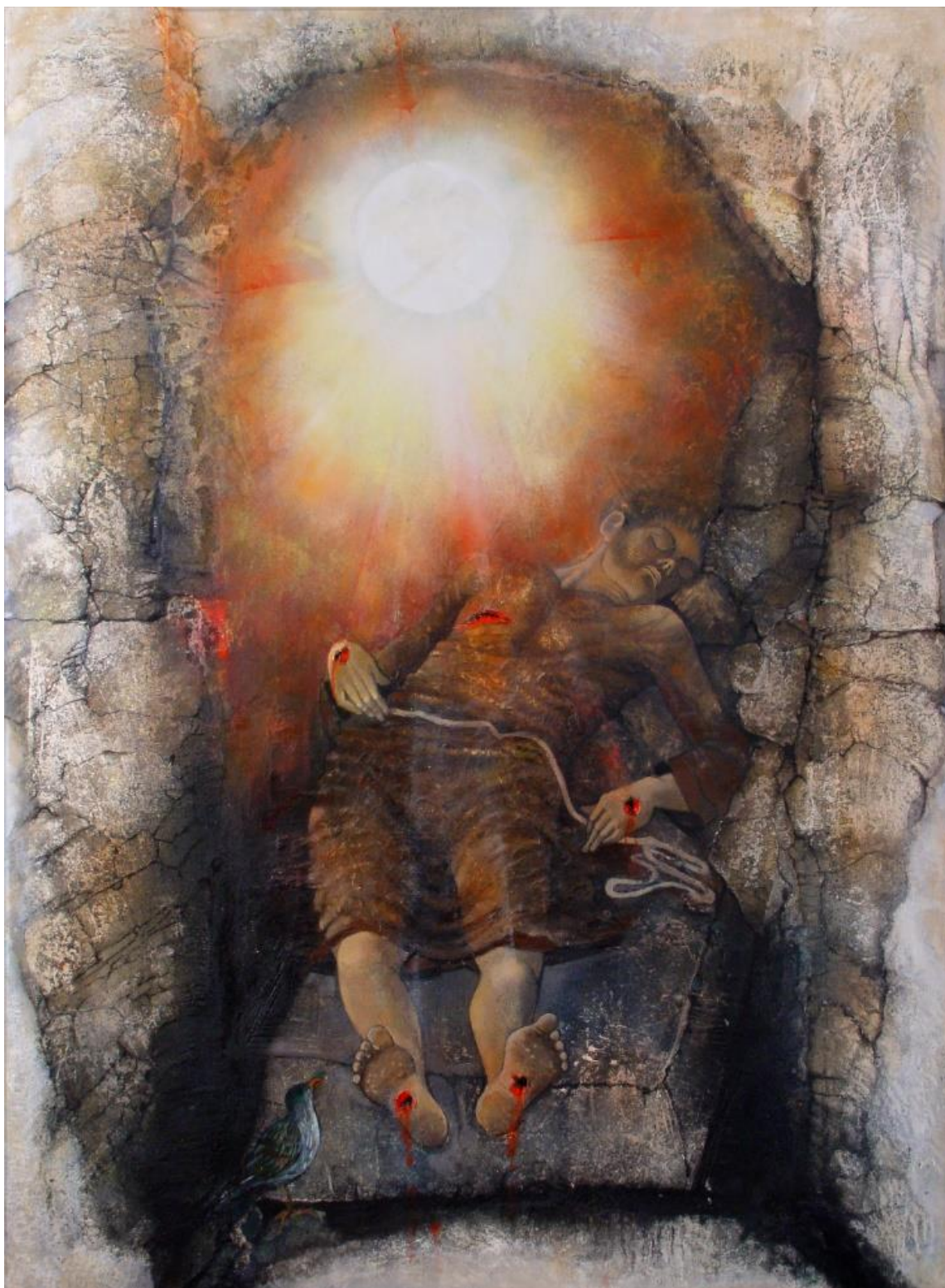
OBRÁZOK 3 – STIGMÁTIZÁCIA SV. FRANTIŠKA