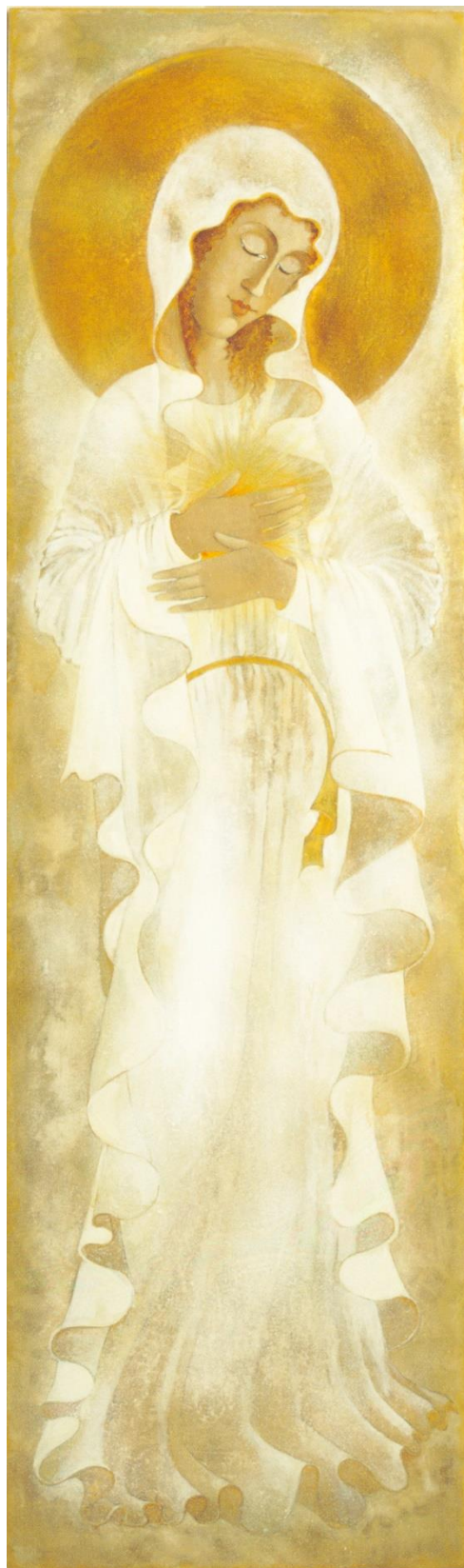
OBRÁZOK 8 – NEPOŠKVRNENÉ SRDCE PANNY MÁRIE 2002