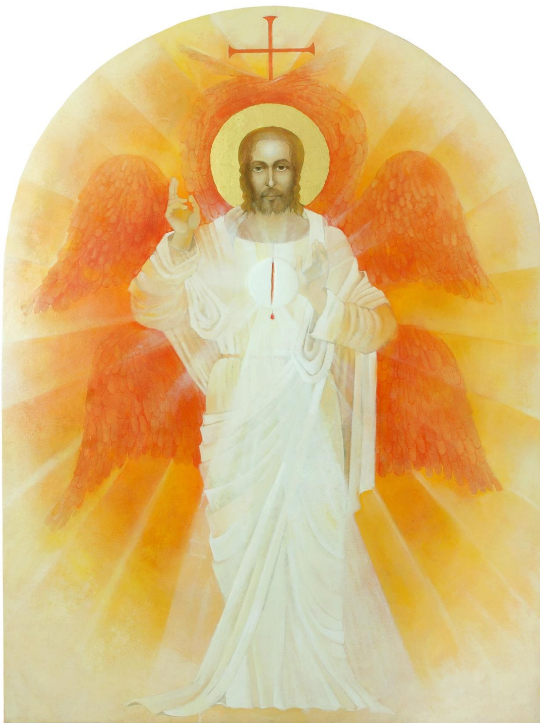
OBRÁZOK 5 – EUCHARISTICKÉ SRDCE JEŽIŠOVO