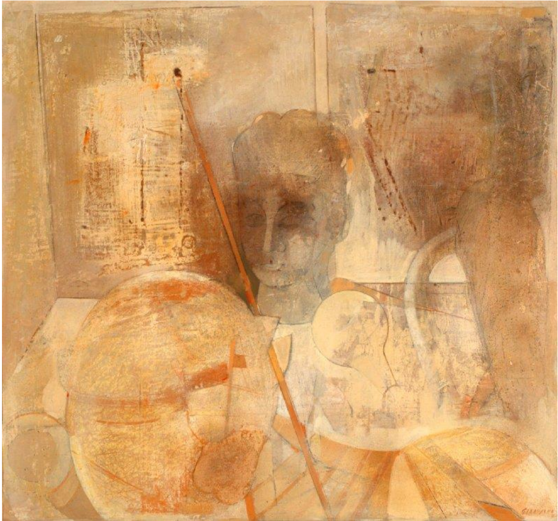
OBRÁZOK 9 – SPOMIENKA I. 1985