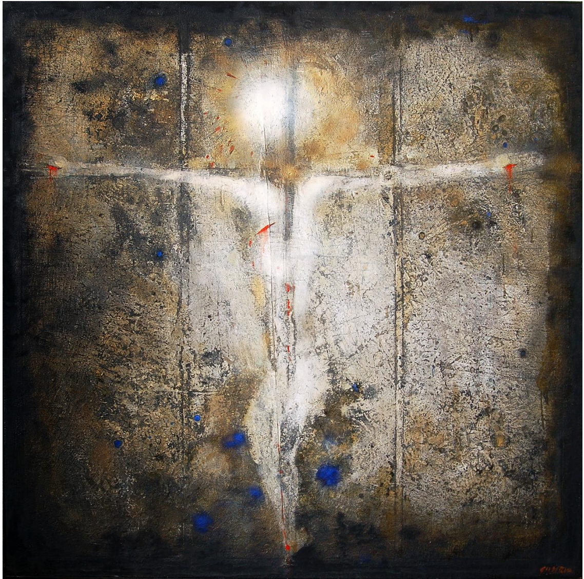
OBRÁZOK 7 – ICHTHUS 1994