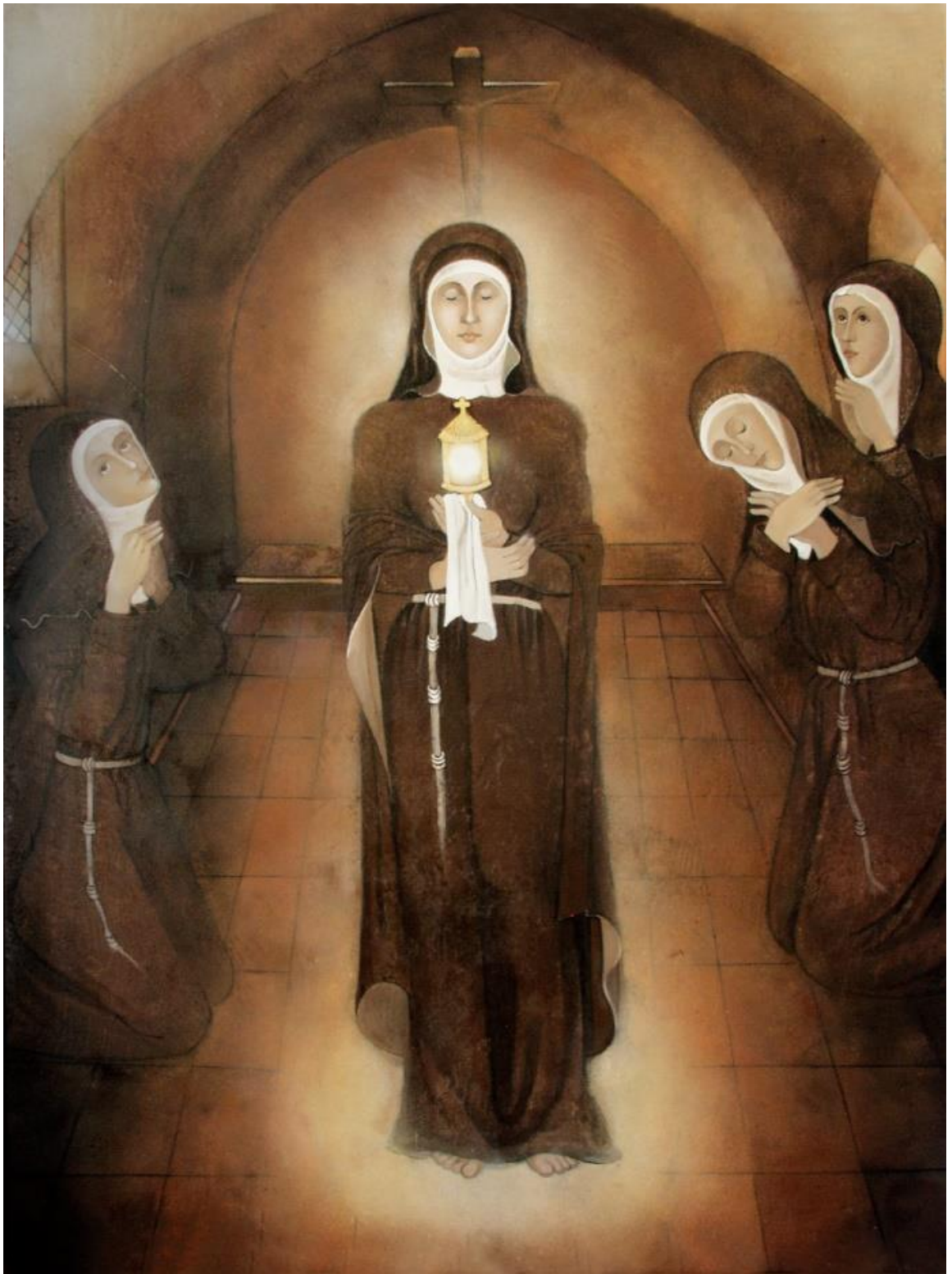
OBRÁZOK 4 – SV. KLÁRA V SAN DAMIANE