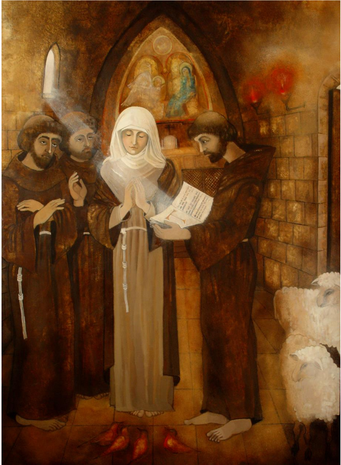
OBRÁZOK 1 – PORCIUNKULA