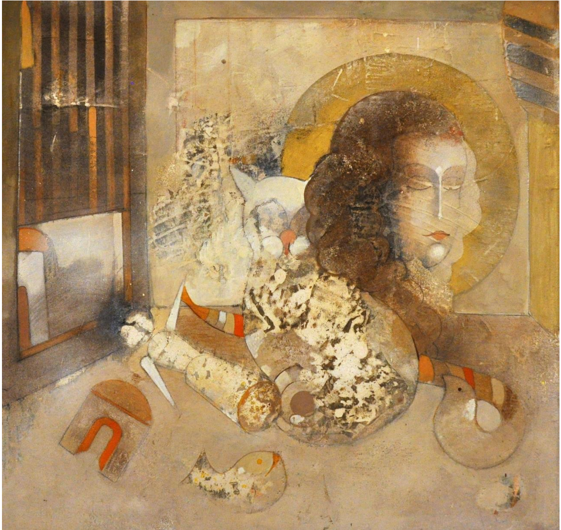
OBRÁZOK 10 – SEN 1989