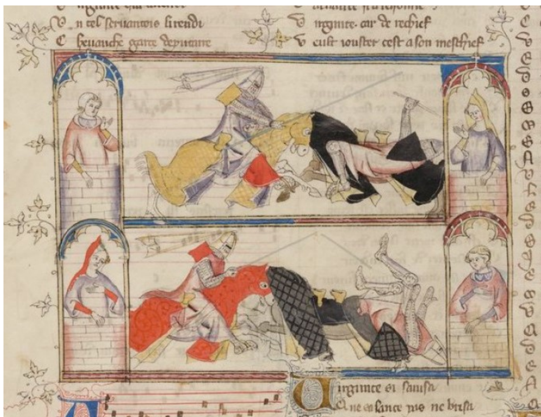
Příloha č. 14: Turnaj Ctností a Něžstí