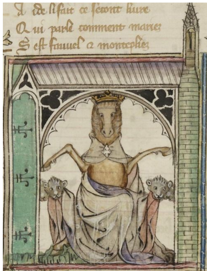
Příloha č. 3: Fauvel

Exemplář Národní knihovny v Paříži, signatura BnF fr. 146. Dostupné na Gallica , Bibliothèque nationale de France , [online], [2020-08-08]. Dostupné z: https://gallica.bnf.fr/ark:/12148/btv1b8454675g.r=le%20roman%20de%20fauvel?rk=150215;2