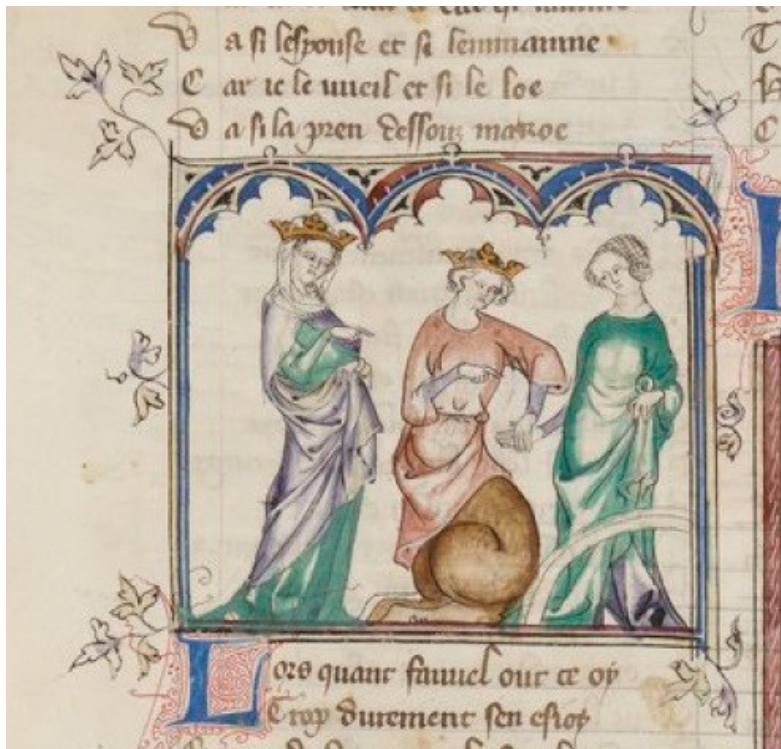
Příloha č. 11: Fauvel se zasnuhuje s Prázdnou Slávou