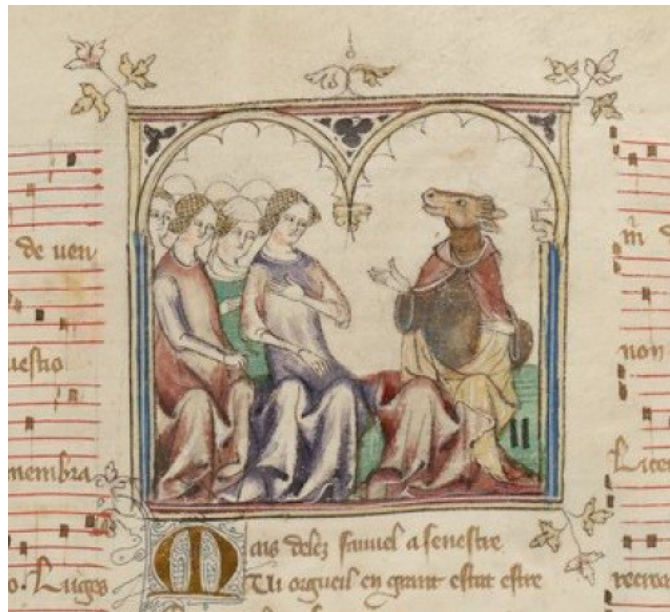
Příloha č. 9: Fauvel se radí s Neřestmi