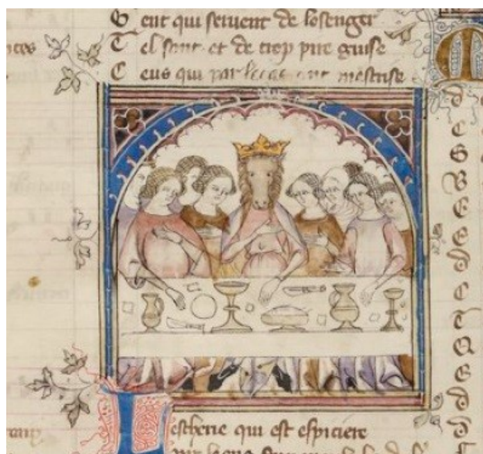
Příloha č. 12: Svatební hostina