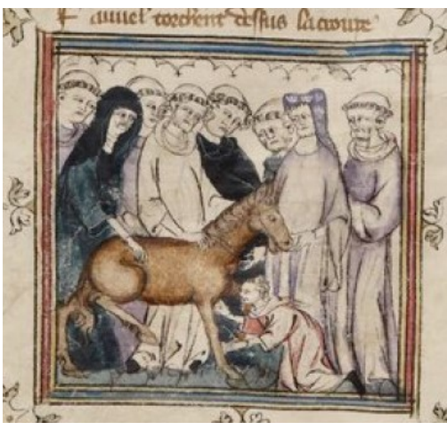
Příloha č. 5,6,7,8: Drbání Fauvela