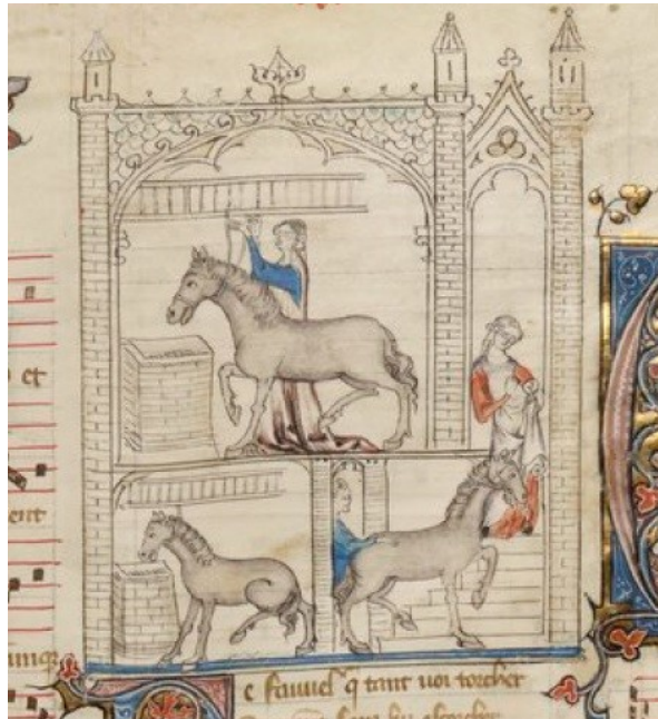
Příloha č. 4: Fauvel ve své stáji