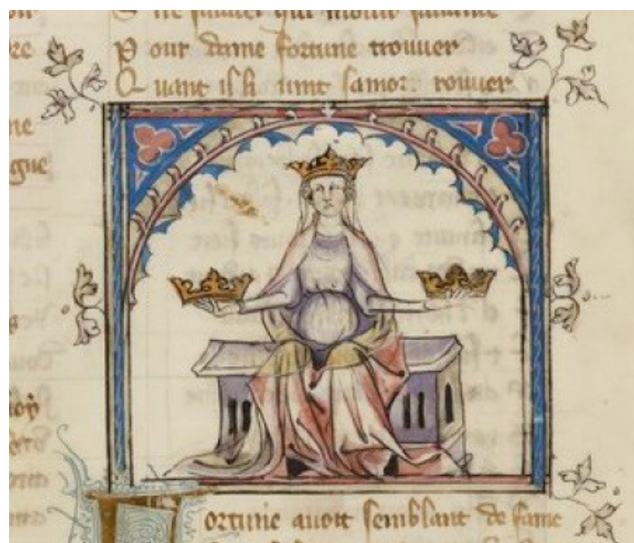
Příloha č. 10: Fortuna