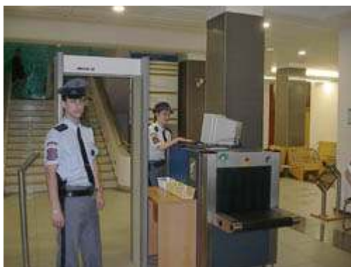
Příloha č. IX/II