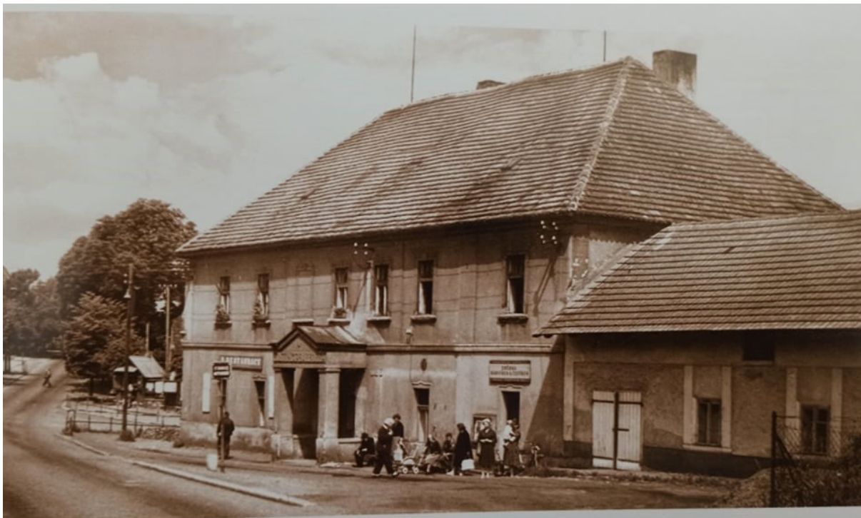
Obrázek 1 Barborka - první sídlo dolnopočernické školy.