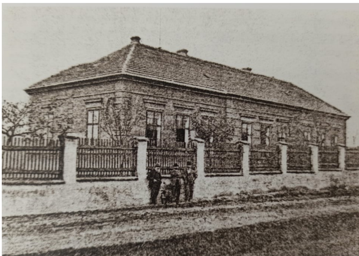
Obrázek 4 Nová škola 1894 (zdroj: tamtéž s. 160).