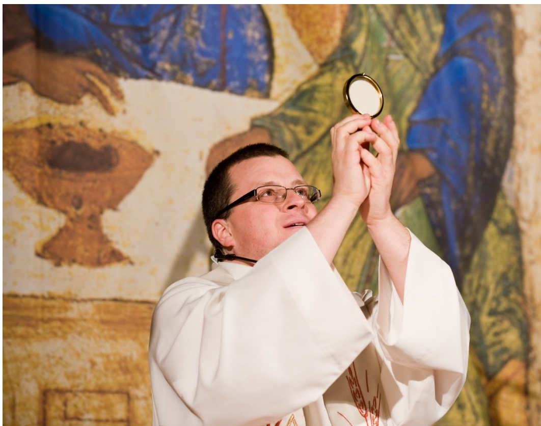
5. Brno-Židenice, 2011: Závěrečné žehnání Eucharistií