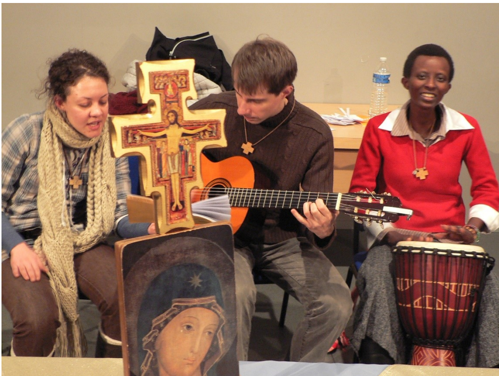
6. Nantes — Perpignan: Misie účastníků školy