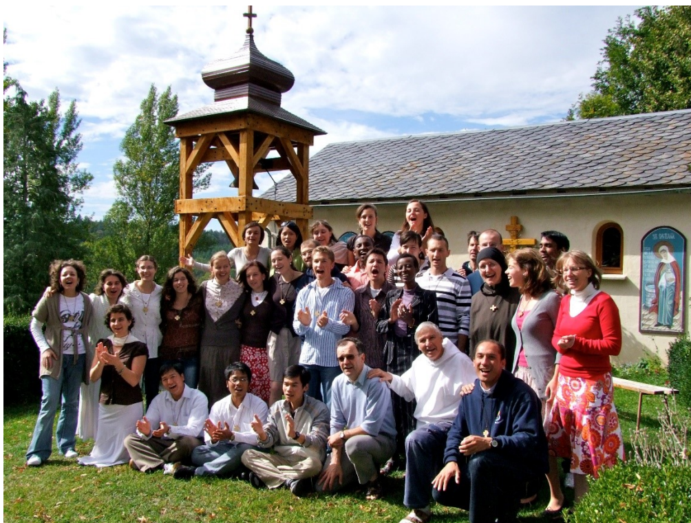
3. Škola JL: Zahájení nového roku školy JL 27