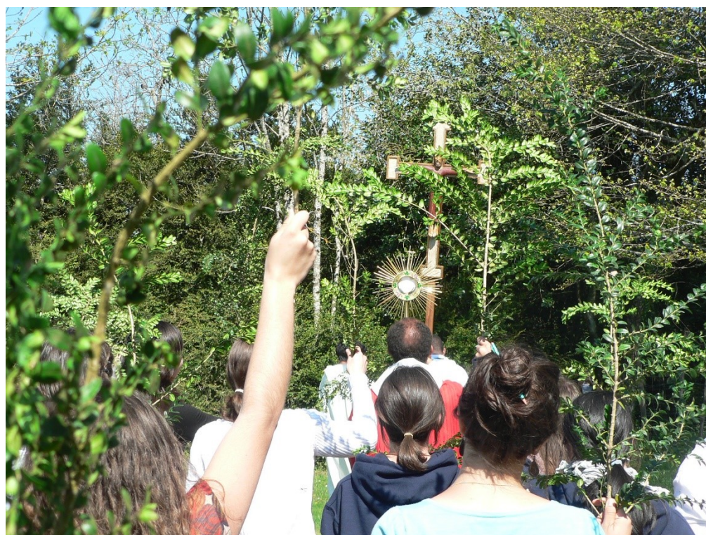
4. Škola JL: Průvod na květnou neděli