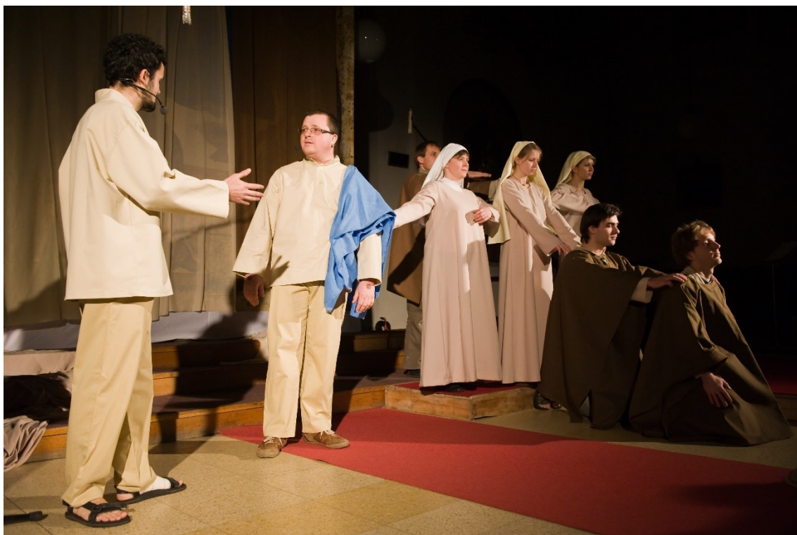
3. Brno-Židenice, 2011: Emanuel, Pastýř, Radostní