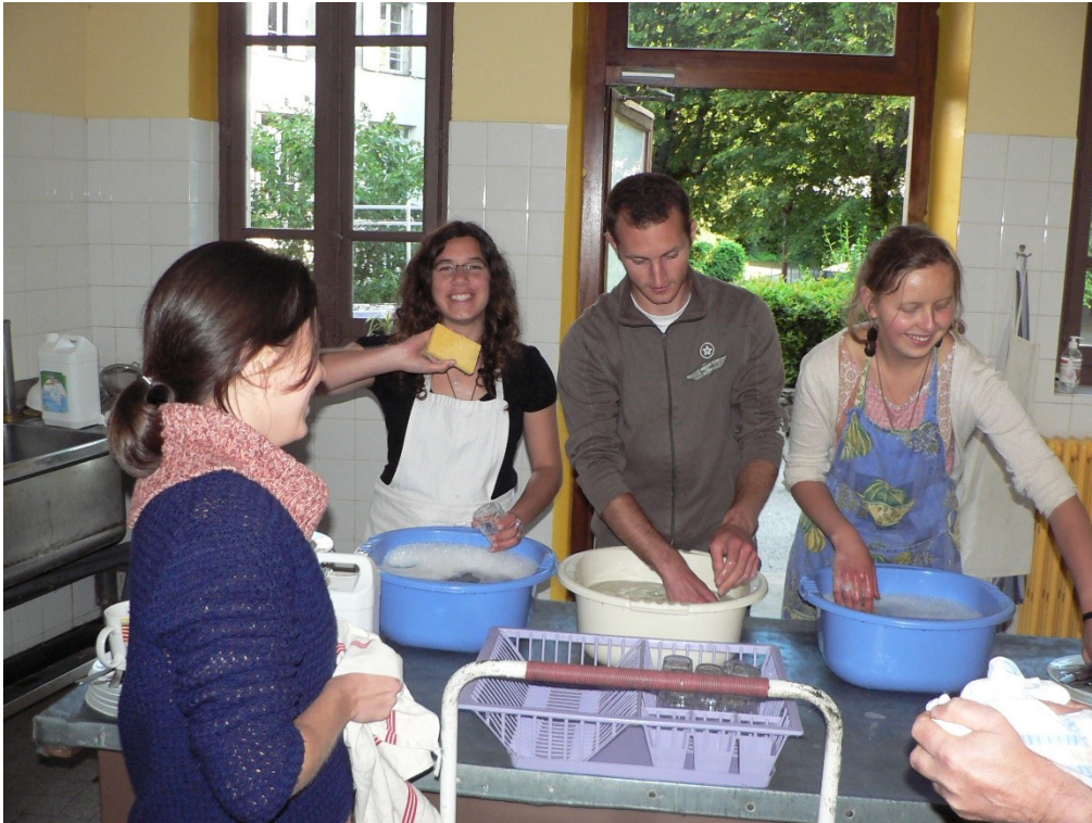
5. Škola JL: Služba účastníků školy u nádobí