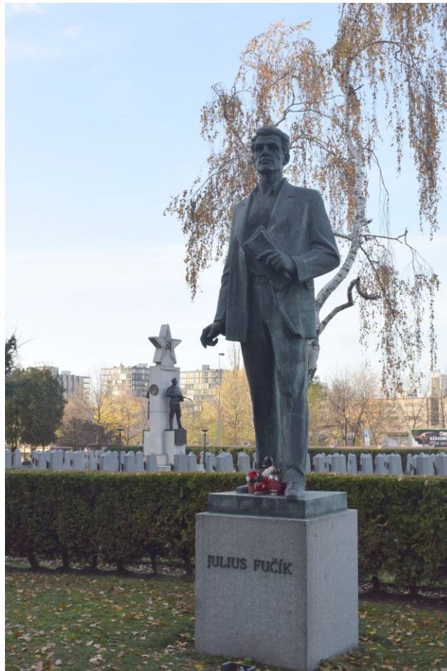
5. Pomník Julia Fučíka, Milan Šonka, 1979 – současné umístění na Olšanech