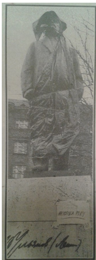
2. Pomník V.I. Lenina na Vítězném náměstí, Božena a Ludvík Kodymovi, 1972 – stav v lednu 1990