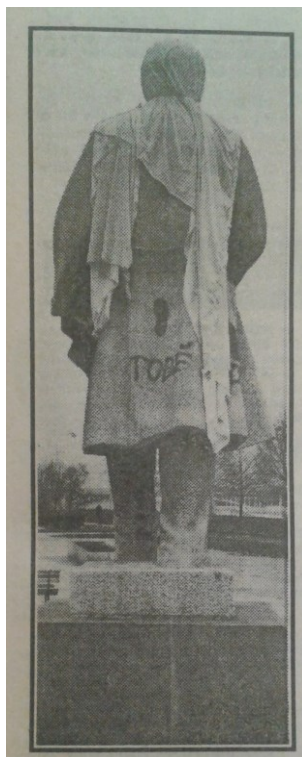
4. Pomník Klementa Gottwalda, Viktor Dobrovolný, 1973 – poškozený pomník v lednu 1990