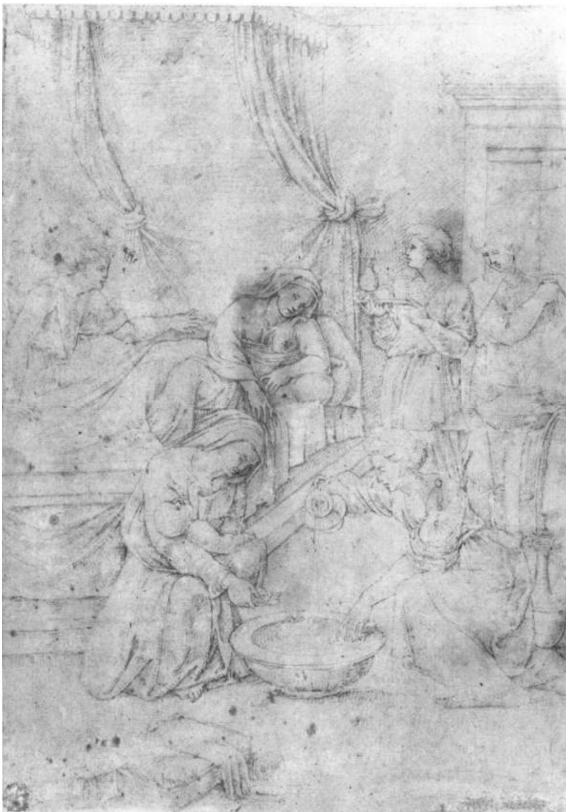
19. Italský mistr 16. století, Narození Panny Marie, kresba perem, NG v Praze.