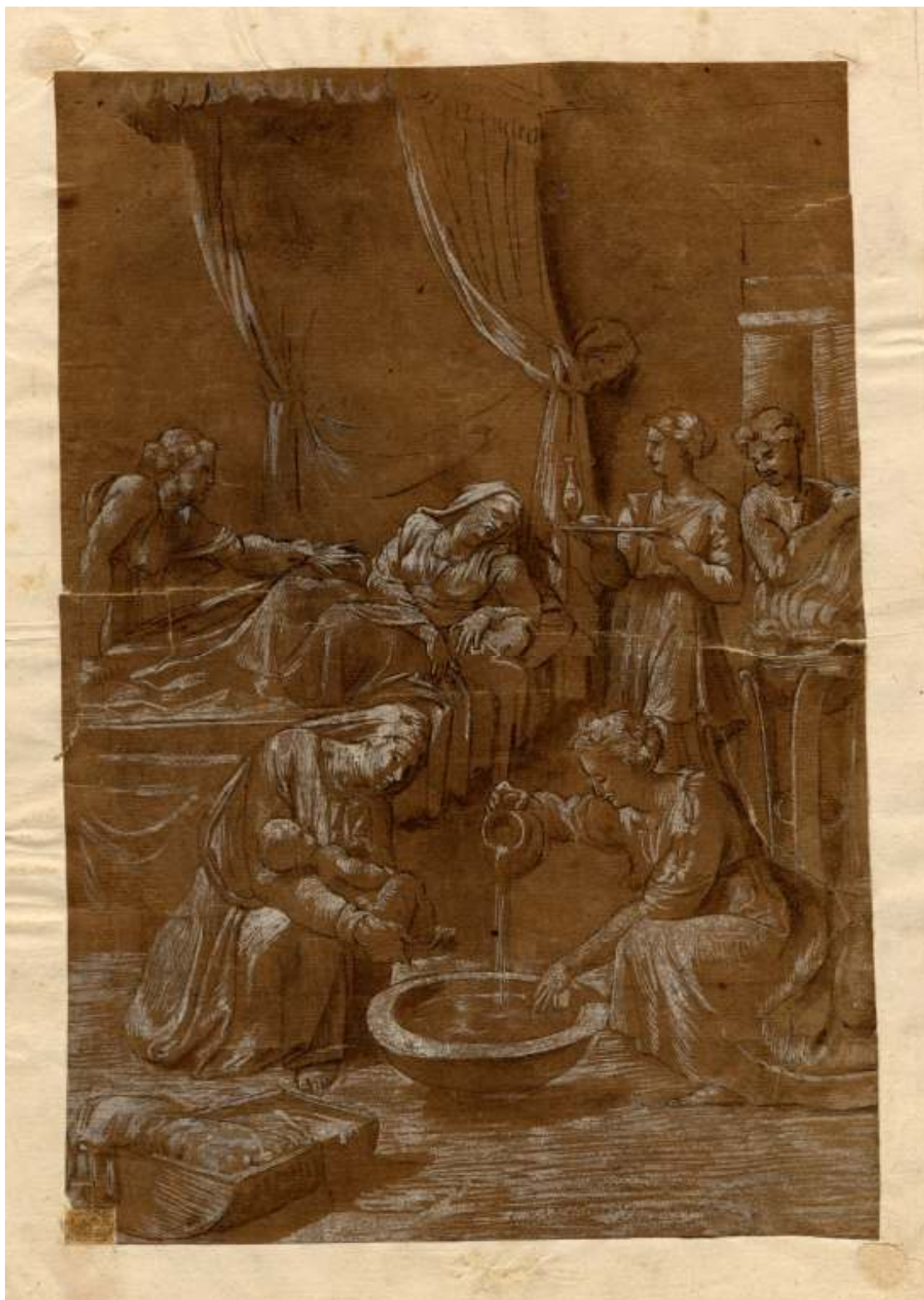
18. Baldassare Peruzzi (?), Narození Panny Marie, lavírovaná kresba perem, Kroměříž, zámek.