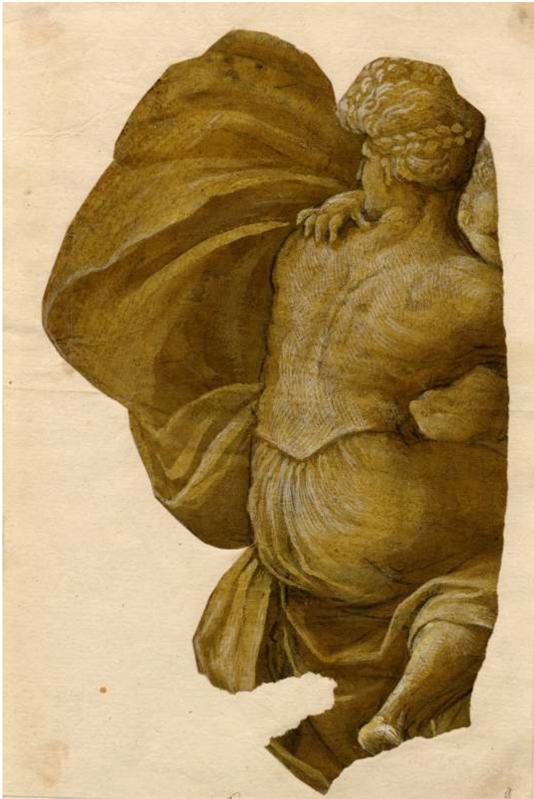
14. Amico Aspertini, Fragment ženské postavy, kresba perem v tmavohnědém tónu, Kroměříž, zámek.