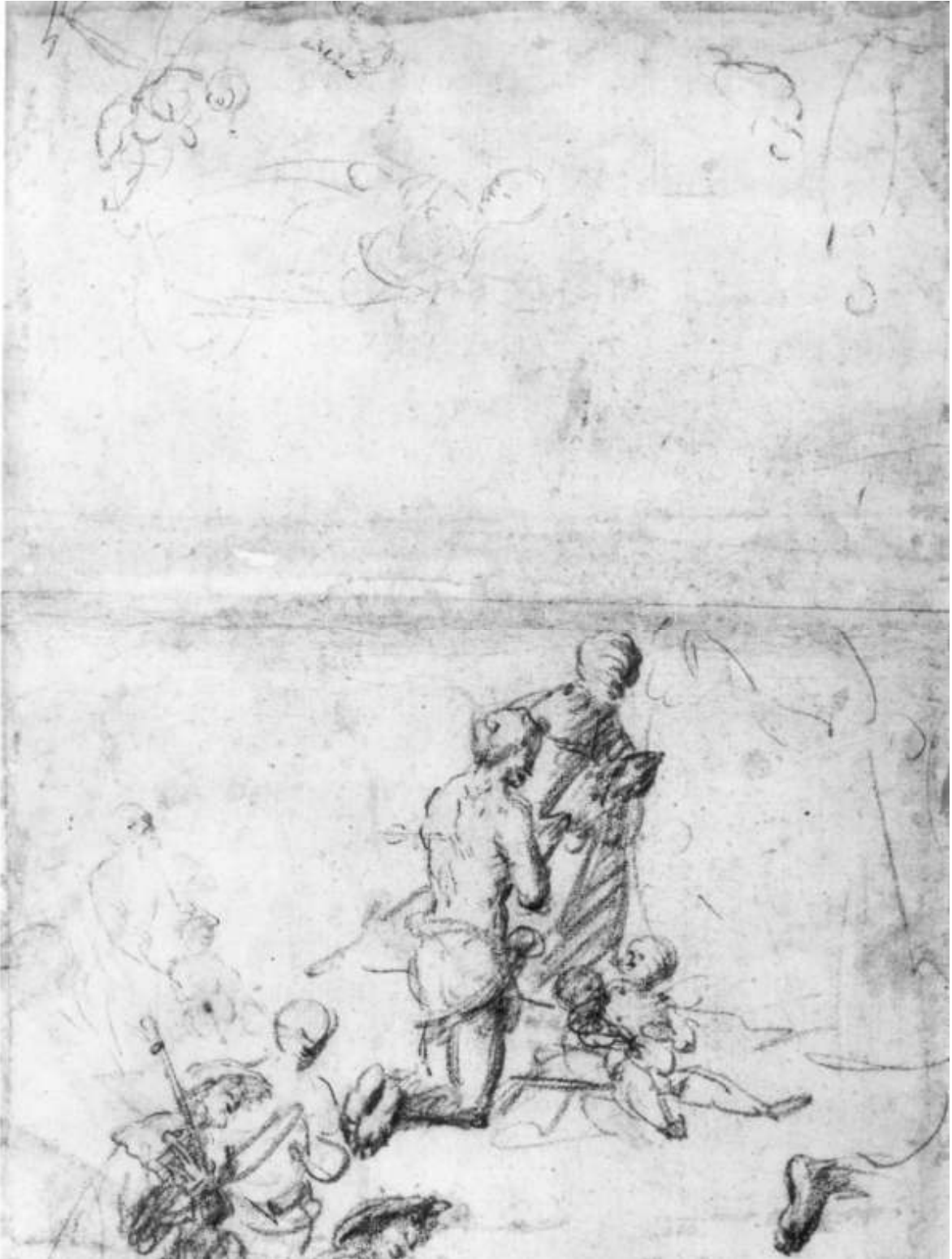
9. Tommaso Aleni a Boccaccio Boccaccino, Studie k adoraci narozeného Krista, kresba tužkou a uhlím, RM v Teplicích.