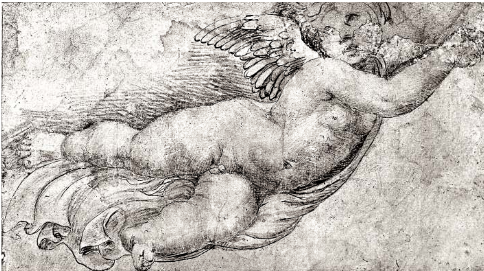
17. Raffael Santi, Amor, kresba perem doplněna černou křídou a rudkou, MG v Brně.