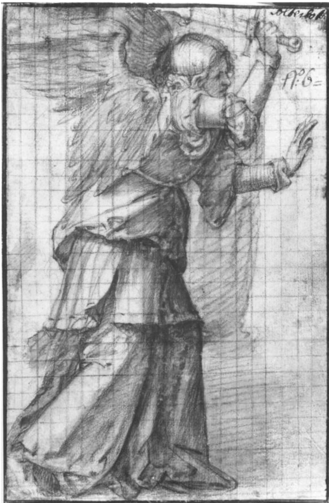
16. Lombardský anonym, Anděl vyhánějící Adama a Evu z ráje, lavírovaná kresba rudkou, NG v Praze.