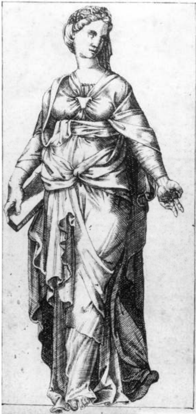
21. Italský kreslíř 1. poloviny 16. století, Studie ženské postavy zředu, kresba perem bistr, NG v Praze.