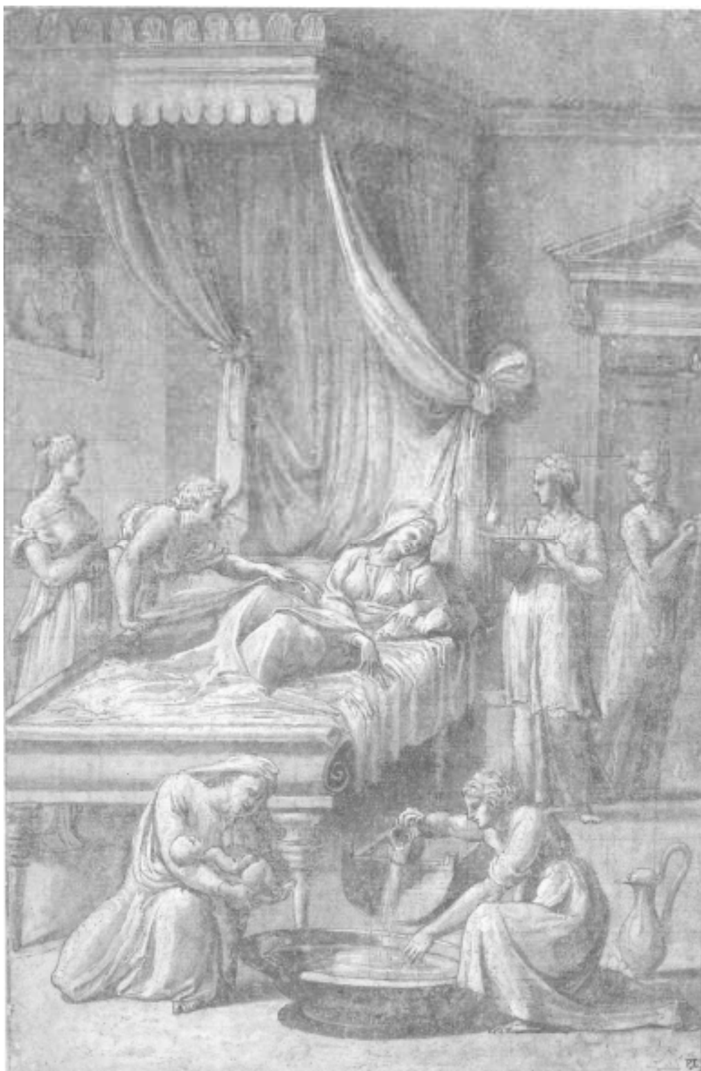
20. Giovanni Francesco Penni, Narození P. Marie, kresba perem, Bibliothèque Royale, Brusel.