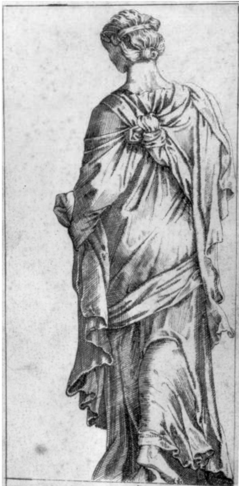
22. Italský kreslář 1. poloviny 16. století, Studie ženské postavy zezadu, kresba perem bistr, NG v Praze.