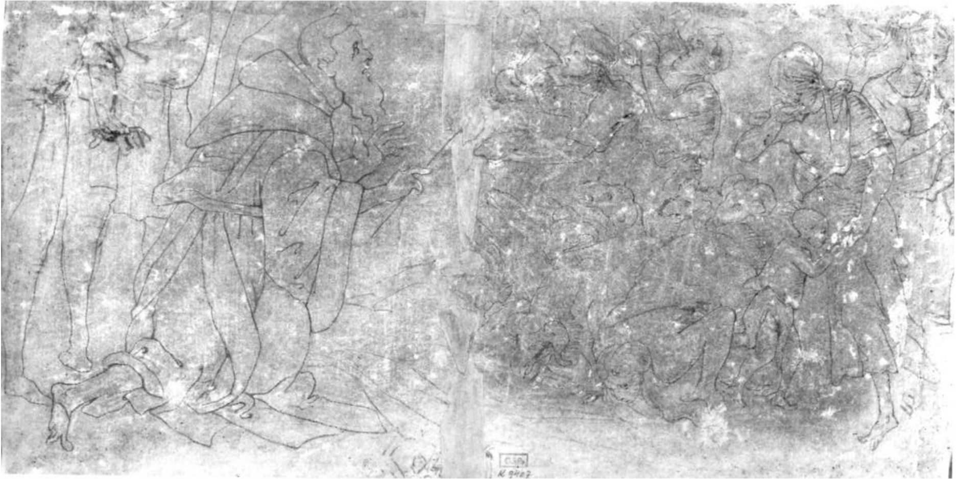
1. Filippino Lippi, Mojžíš dává vytrysknout vodě ze skály, kresba perem a štětcem, NG v Praze.