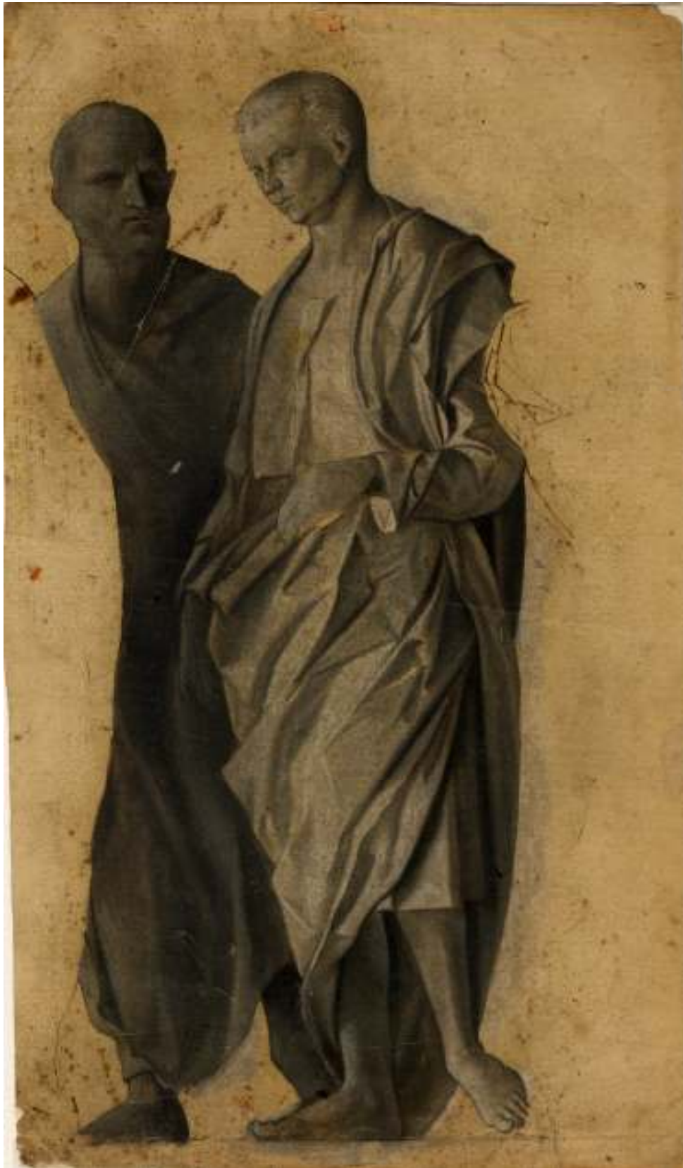
11. Giovanni Bellini, Studie dvou mužských figur, kresba štětciem, Kroměříž, zámek.