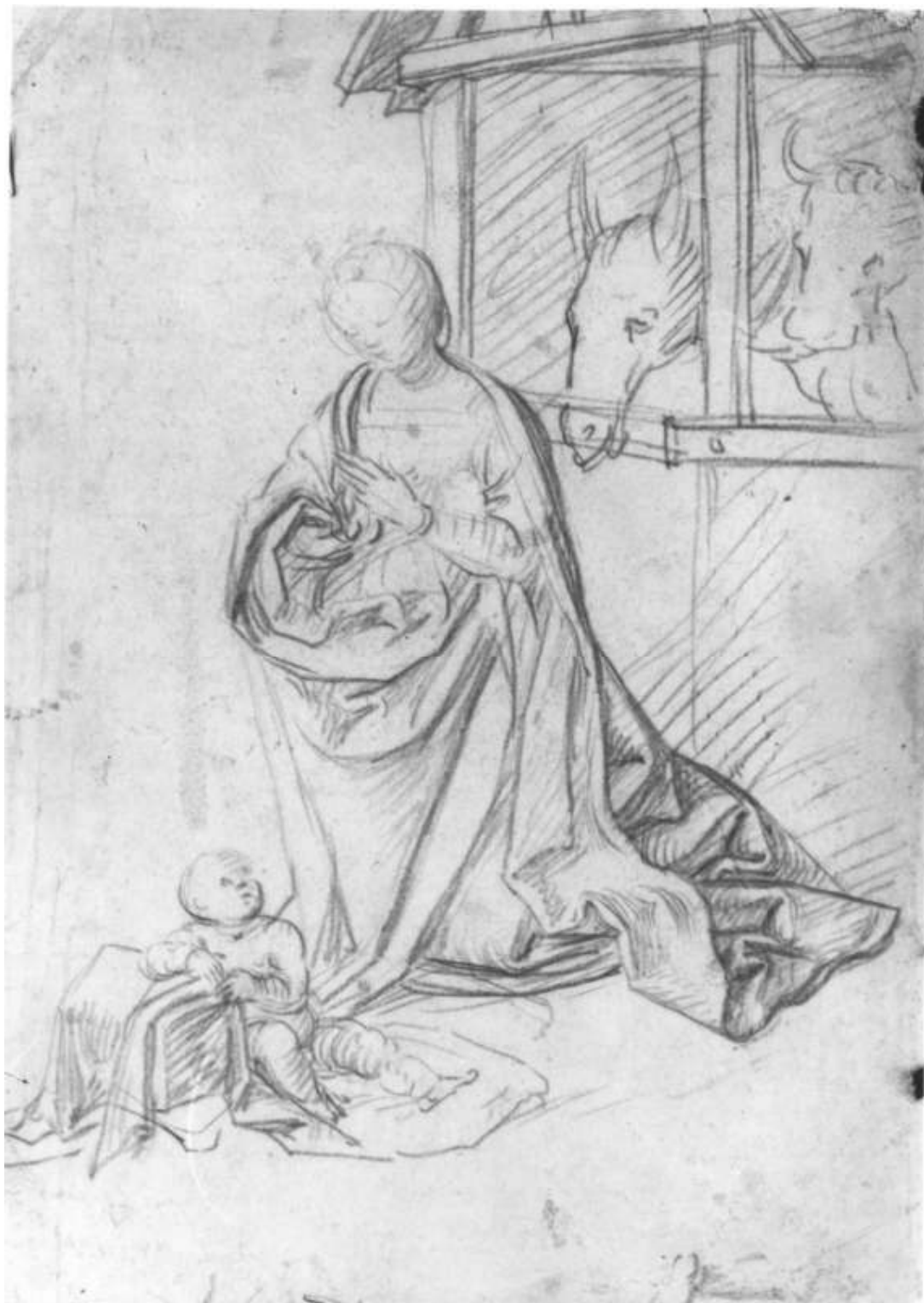
4. Boccaccio Boccaccino, Adorace narozeného Krista, kresba rudkou, Regionální muzeum v Teplicích.