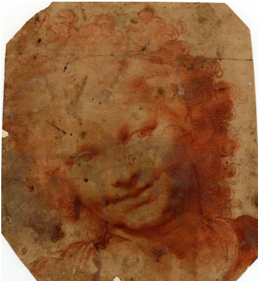
3. Andrea del Sarto, Hlava hochy, kresba rudkou, Kroměříž, zámek.