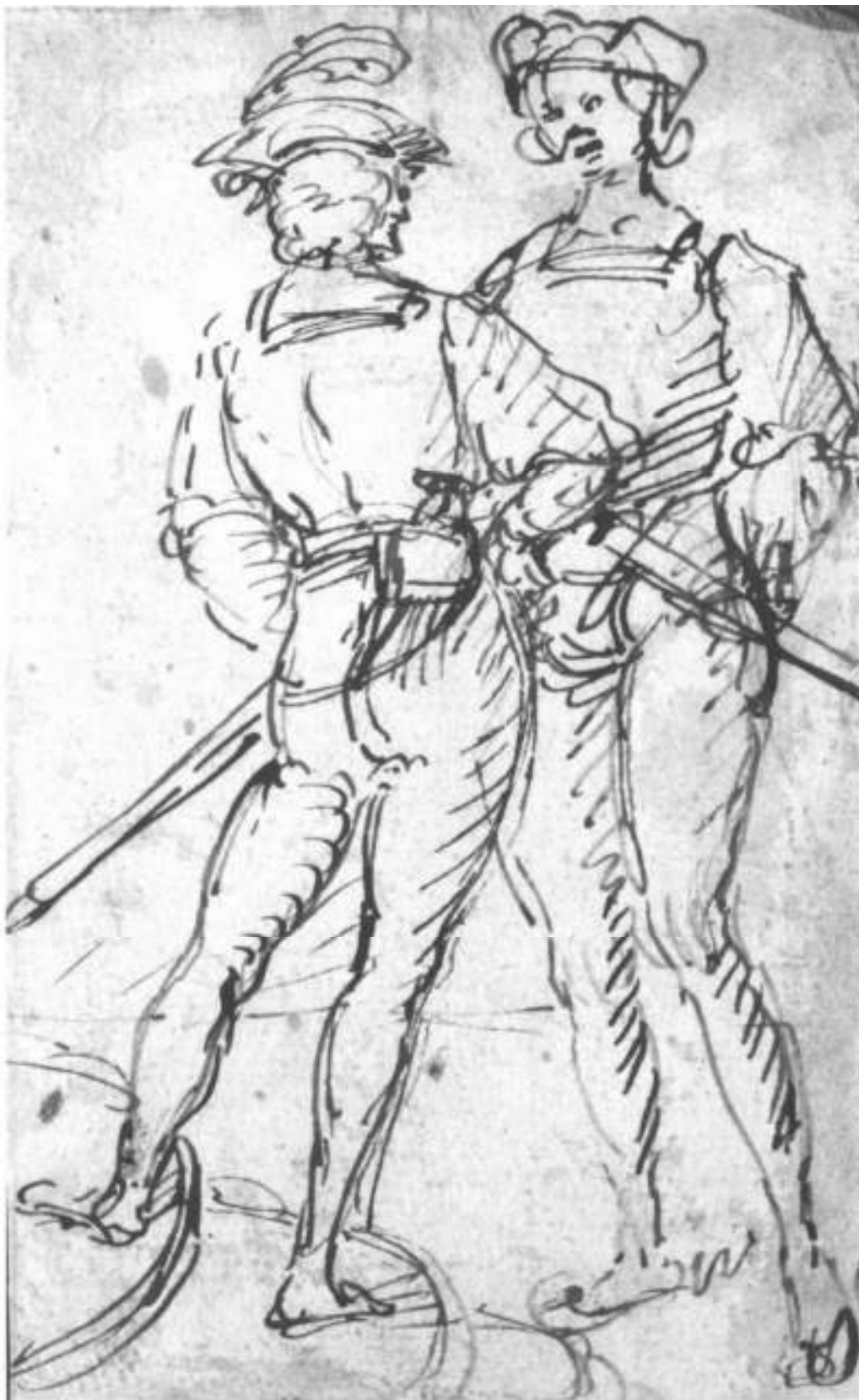
10. Francesco Casella, Dva vojáci, kresba perem, RM v Teplicích.