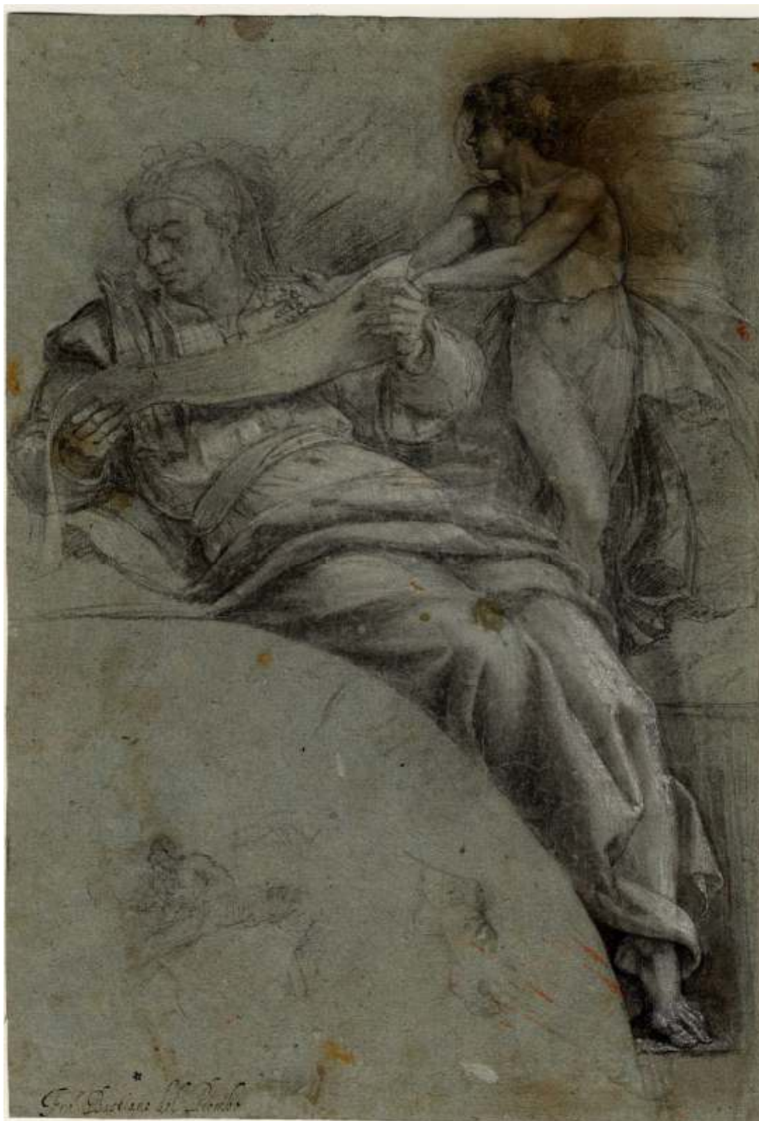
13. Sebastiano del Piombo, Sedící prorok s andělem, kresba olůvkem, Kroměříž, zámek.