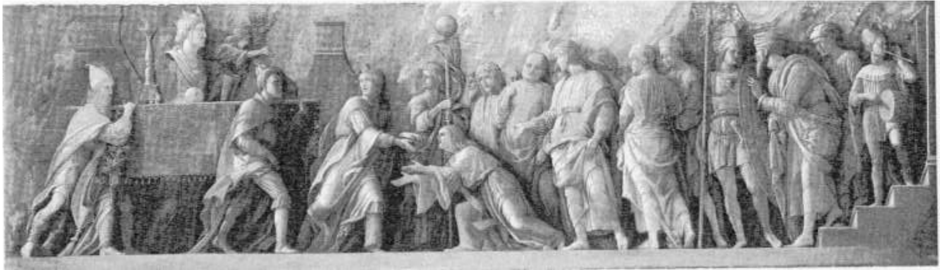
12. Andrea Mantegna, Uvedení kultu Kybelé v Římě, 1505-1506, National Gallery, Londýn.