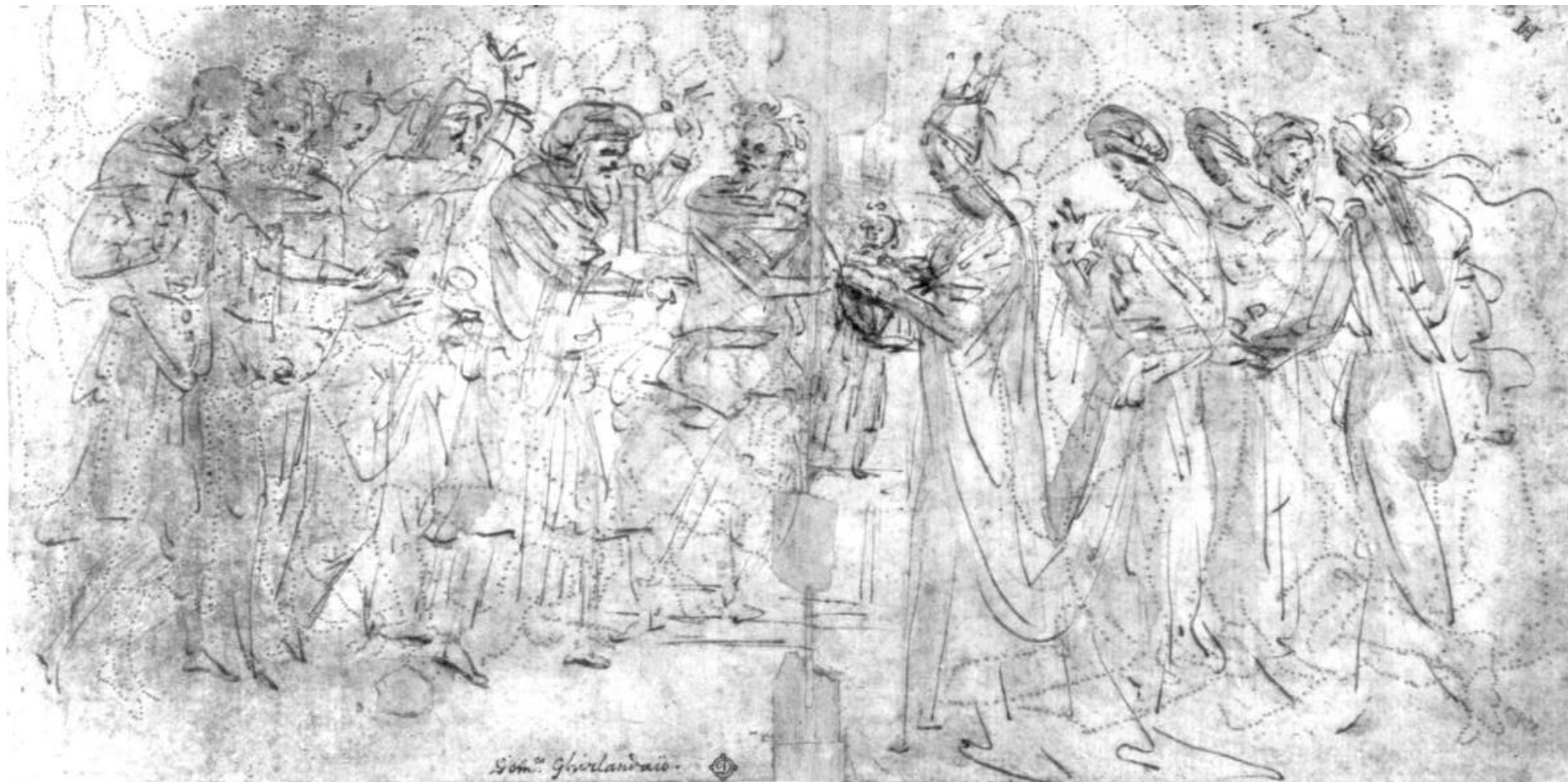
2. . Filippino Lippi, Figurální kompozice, kresba, NG v Praze.