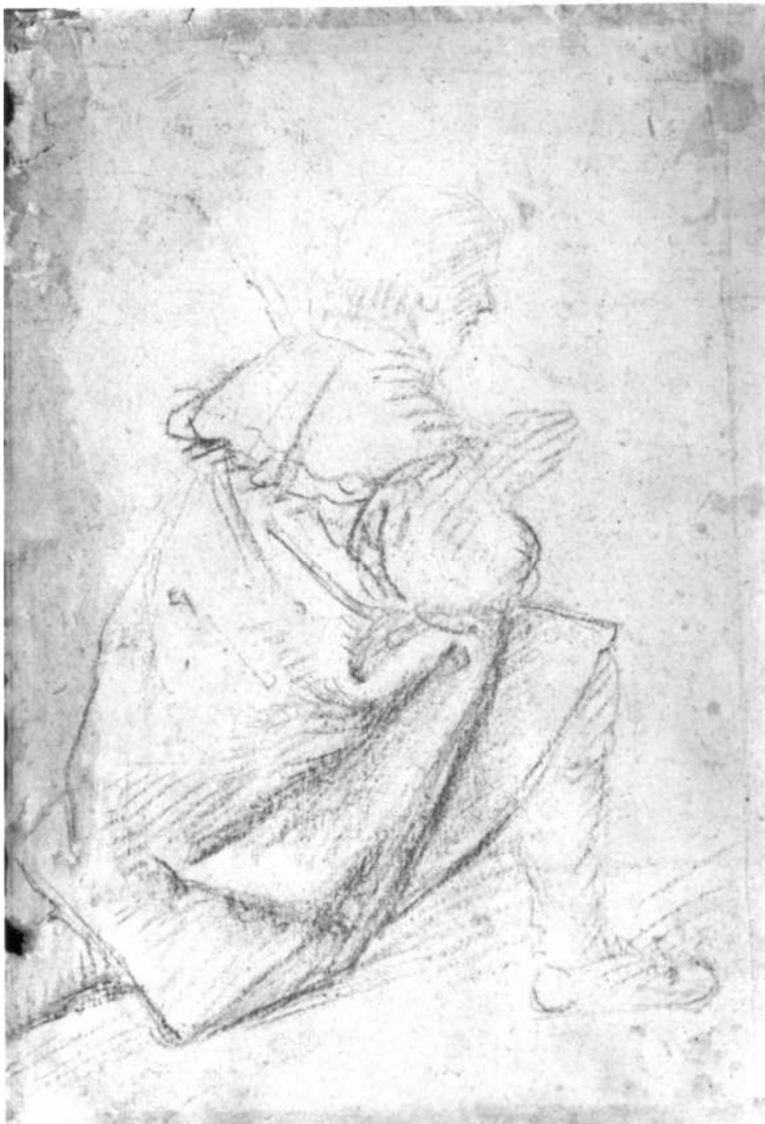
5. Boccaccio Boccaccio, Studie adorující mužské postavy v pokleku, kresba černou křídou, RM v Teplicích.