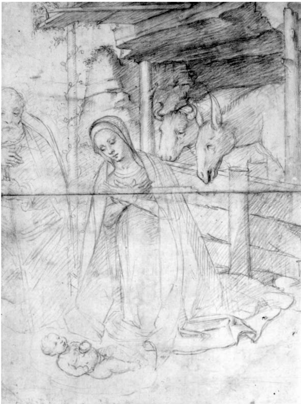
8. Tommaso Aleni a Boccaccio Boccaccino, Adorace narozeného Krista, kresba rudkou, RM v Teplicích.