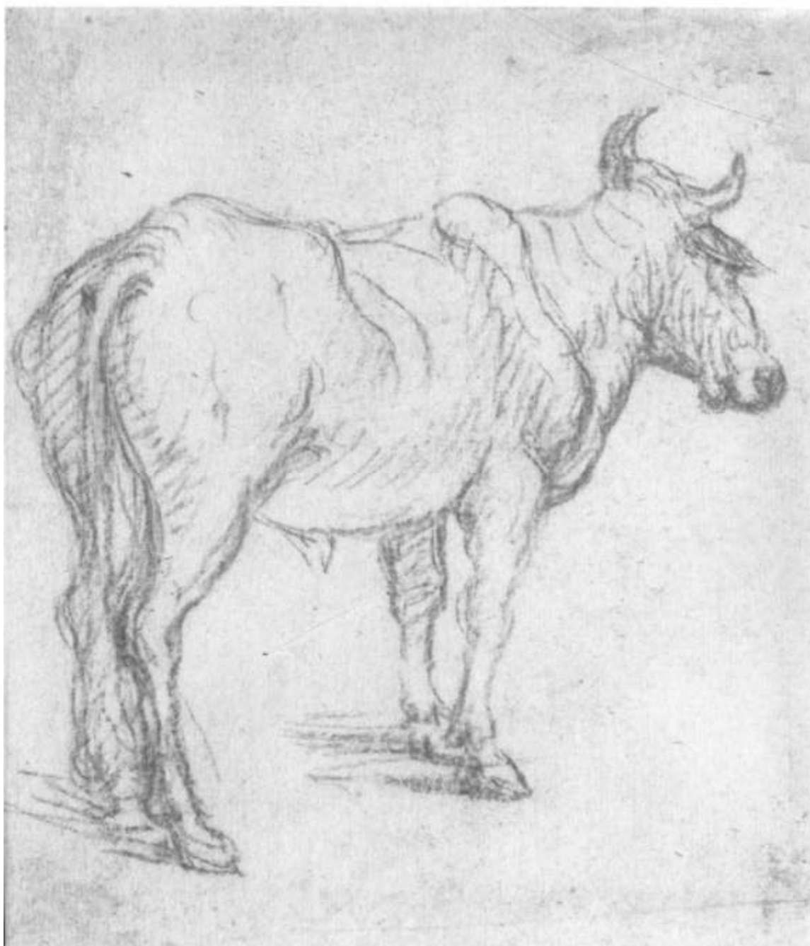
6. Boccaccio Boccaccino, Studie býka I., kresba rudkou, RM v Teplicích.