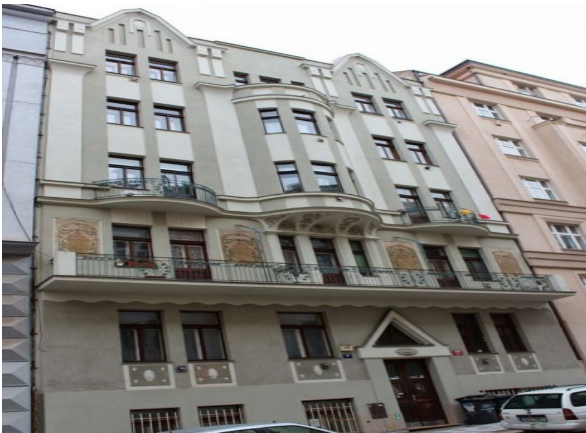
Obrázek 4