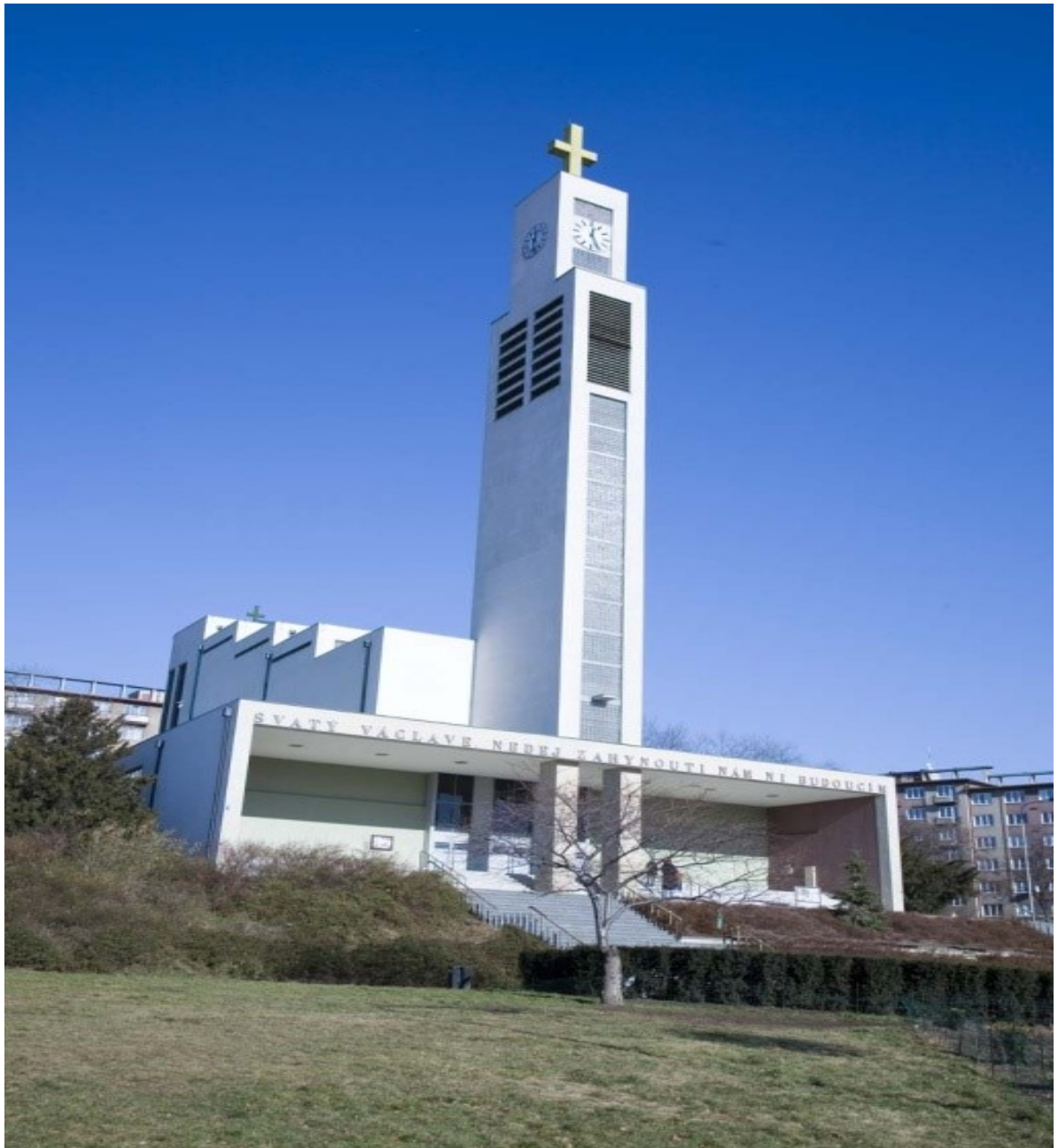
Obrázek 5