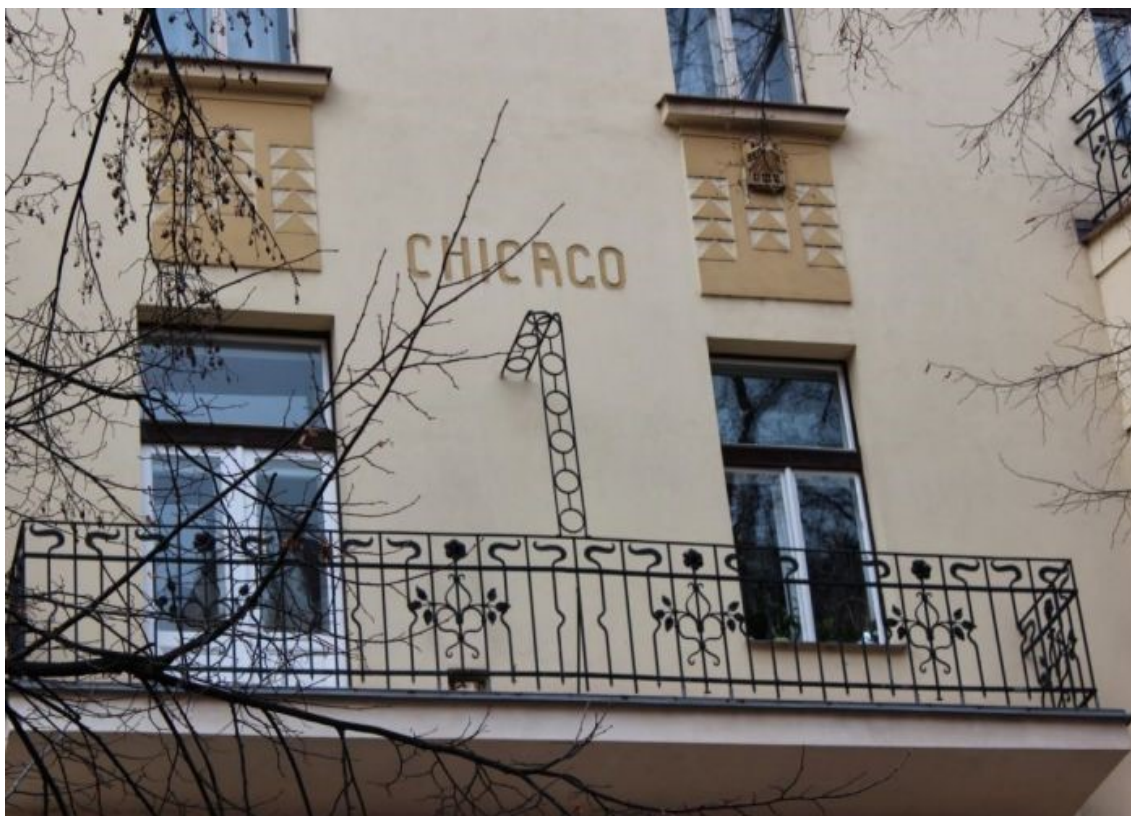
Obrázek 3