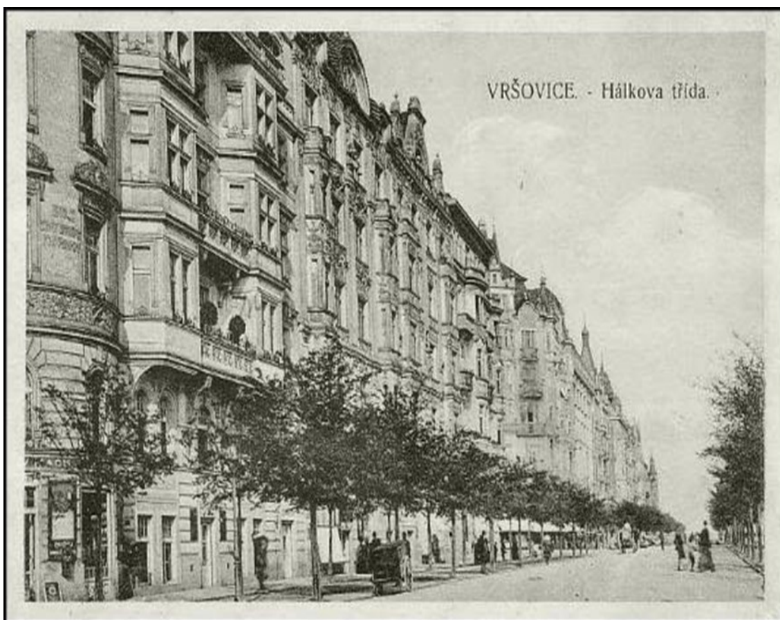
Obrázek 2: Zdroj: Noblesní Vršovice [online] [cit 2014-10-13]. Dostupné z: https://www.prahaneznamy.cz/praha-10/vrsovice/noblesni-vrsovice/