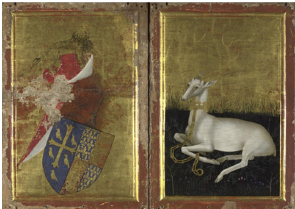
16. Anonymous, Wilton Diptych, 1395–1399, egg on oak panel, 53 x 37. National Gallery, London