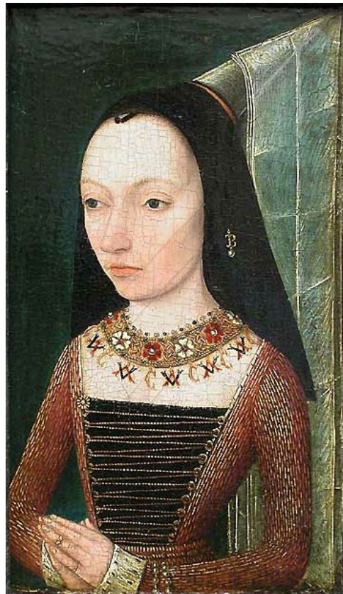
6. Anonymous , Margaret of York, around 1468, oil on oak panel, 20,5 x 12 cm. Louvre, Paris