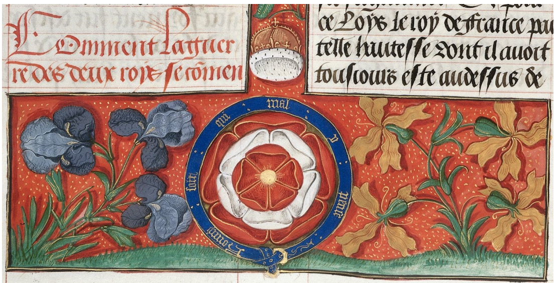
11. Chroniques de France ou de Saint Denis (1108–1270), fol. 30v, Tudor rose, 1487–1494. British Library, London, sign. Royal 20 E III