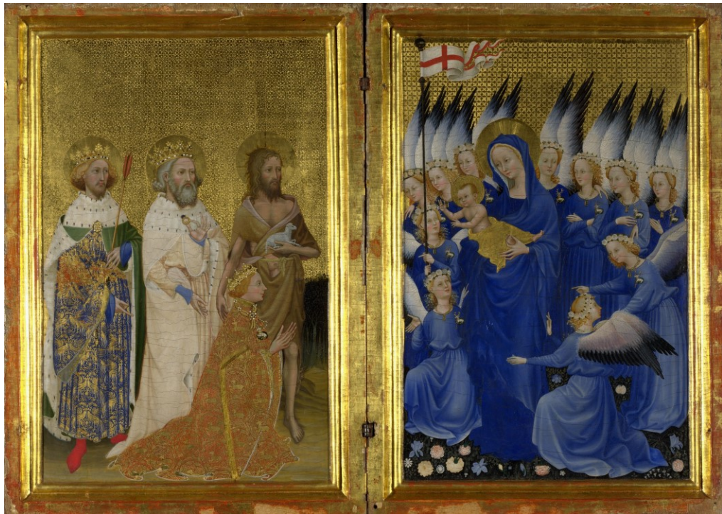
15. Anonymous, Wilton Diptych, 1395–1399, egg on oak panel, 53 x 37. National Gallery, London