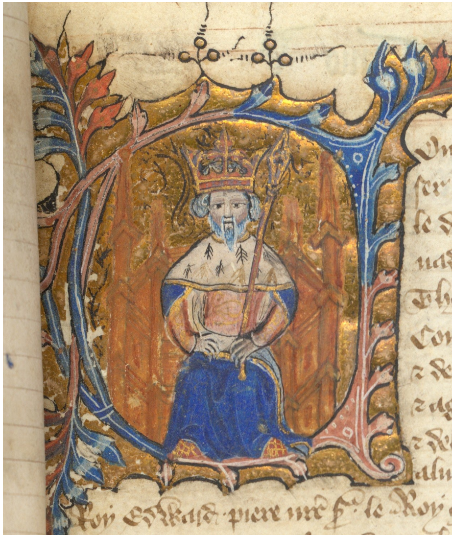
13. Nova Statuta for Edward III and Richard II, fol. 22, Historiated initial, around 1392. British Library, London, sign. Arundel 331