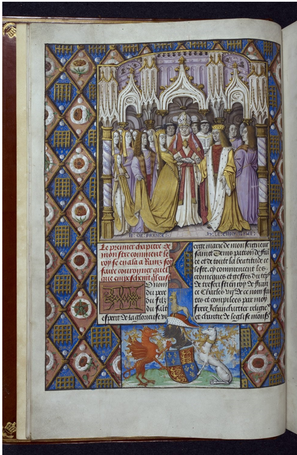
23. Chroniques de France ou de Saint Denis (1422–1460), fol. 9v, Henry V. and Catharine of Valois, 1487. British Library, London, sign. Royal 20 E VI