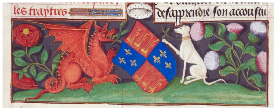
19. Chroniques de France ou de Saint Denis (1108–1270), fol. 28, Arms, 1487–1494. British Library, London, sign. Royal 20 E III