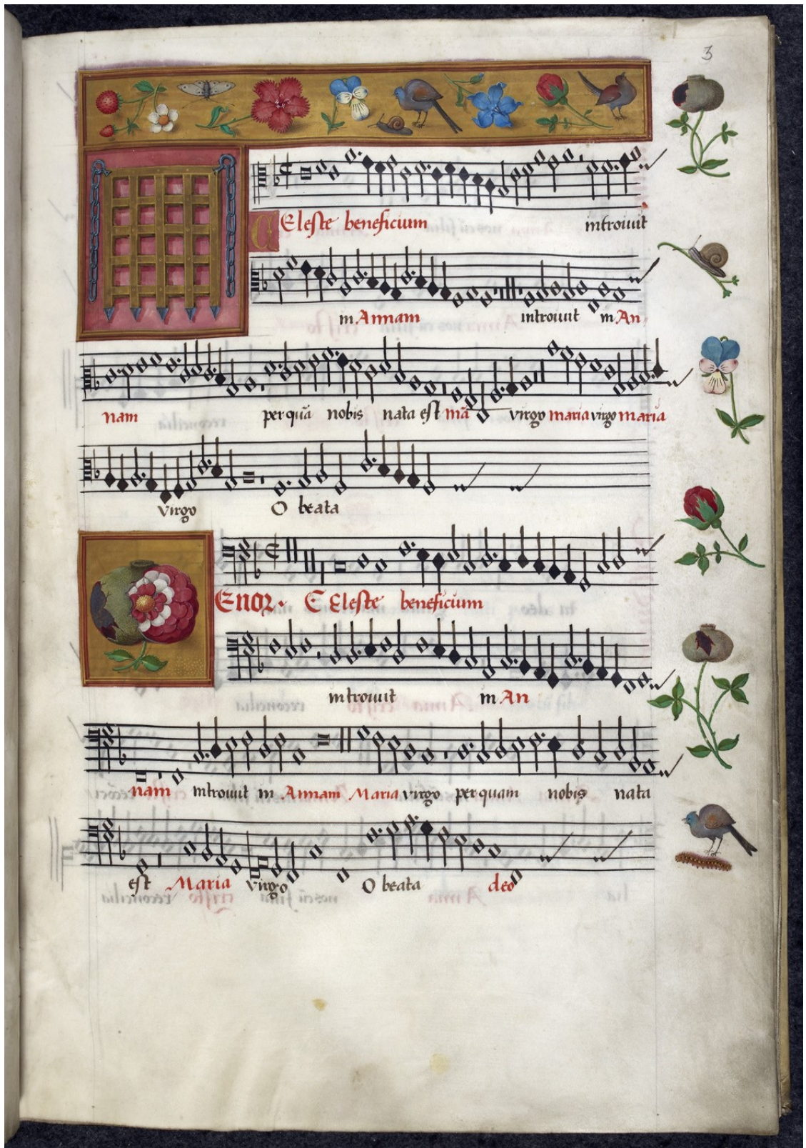
8. Book of 28 motets, fol. 3, Portcullis, 1513–1525. British Library, London, sign. Royal 8 G VII