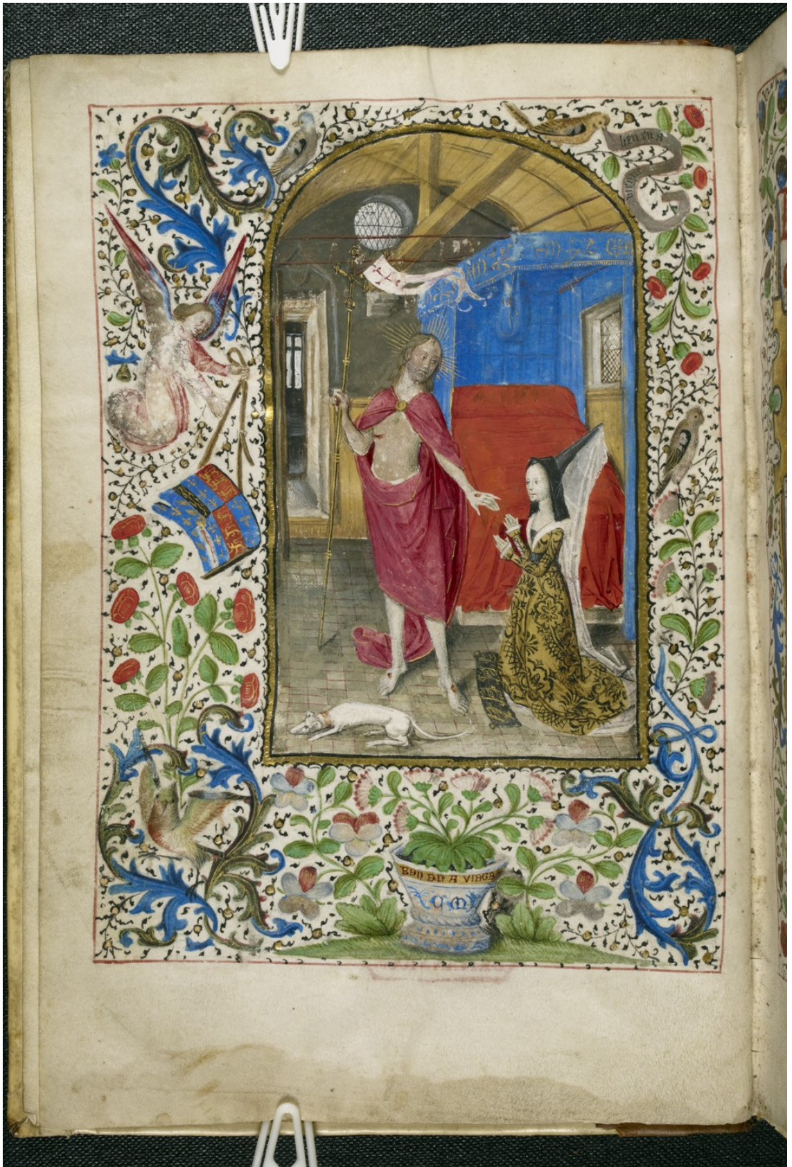
17. Dialogue de la duchesse de Bourgogne a Jesus Christ, fol. 1v, Margaret of York, 1468–1477. British Library, London, sign. Additional 7970