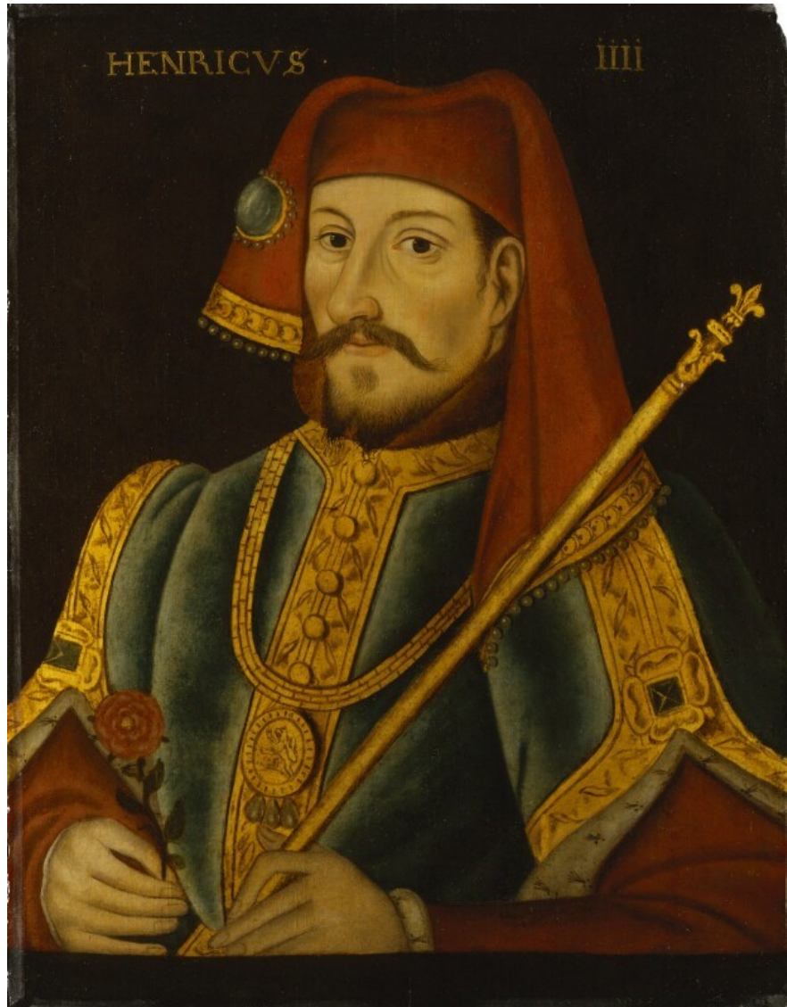
7. Anonymous , King Henry IV., late 16th or early 17th century, oil on panel, 58,7 x 45,7 cm. National Portrait Gallery, London