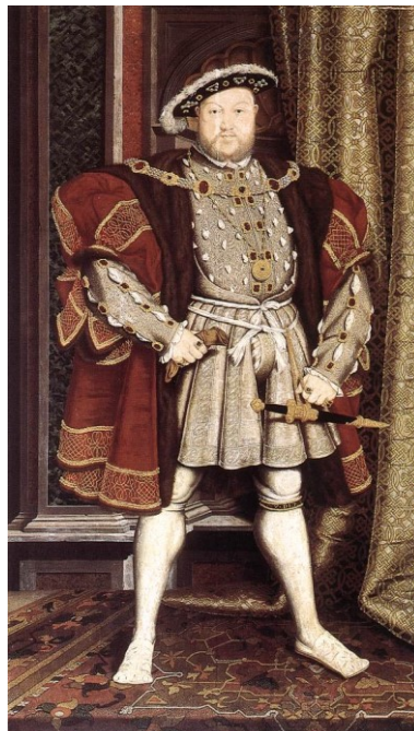
29. Hans Holbein the Younger, Henry VIII., after 1537, oil on canvas, 234 x 135 cm.