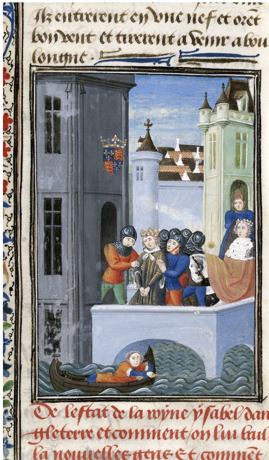
14. Chroniques , Vol. IV, part 2, fol. 181v, Richard II. in the Tower of London, 1470–1472. British Library, London, sign. Harley 4380