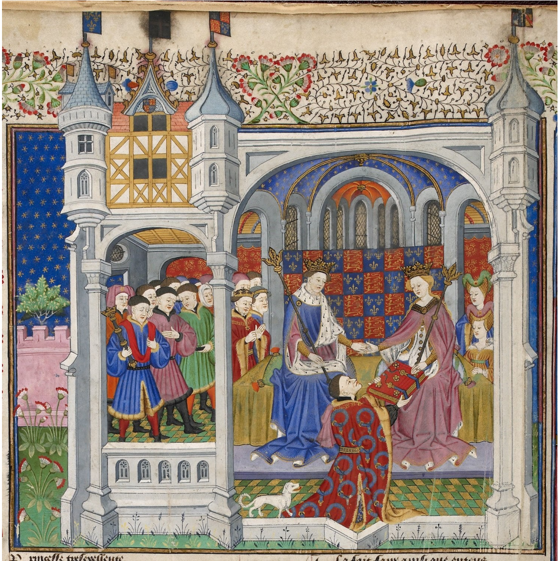
18. Talbot Shrewsbury book, fol. 2v, Presentation scene, 1444–1445. British Library, London, sign. Royal 15 E VI