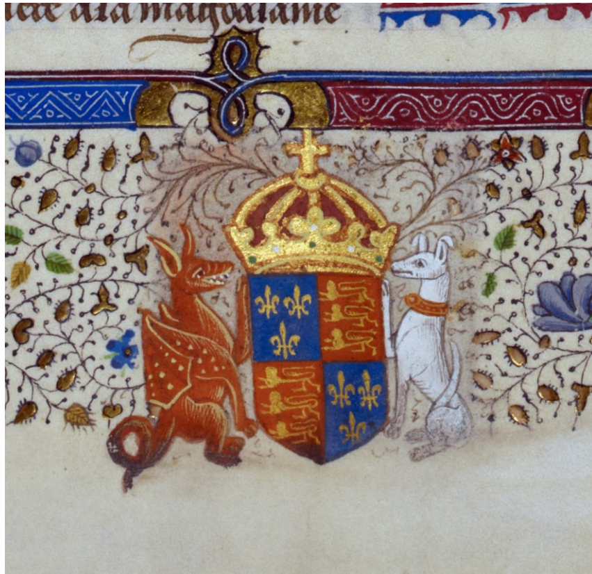
20. Sept articles de la foy , fol. 16, Royal arms of England, around 1440. British Library, London, sign. Royal 19 A XXII