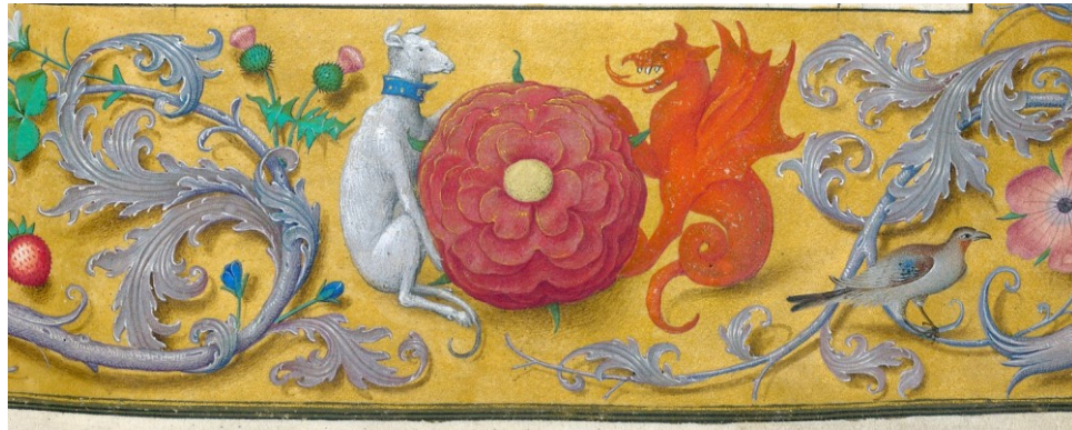
21. Poems; Art d'amour; Les demandes d'amour; Le livre dit grace entiere sur le fait du gouvernement d'un prince , fol. 137, Rose with greyhound and dragon, 1450–1483. British Library, London, sign. Royal 16 F II