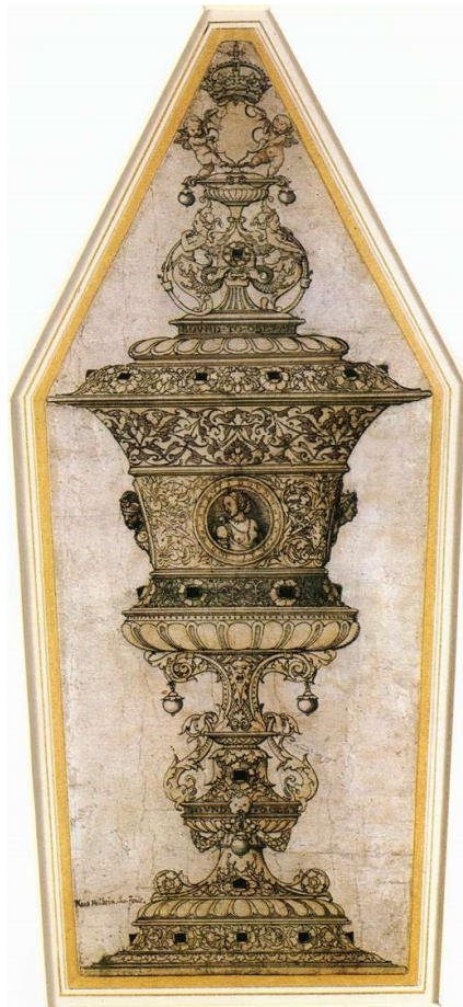
26. Hans Holbein the Younger , Jane Seymour's cup, around 1536, pen, indian ink and watercolour, 37,5 x 15,5 cm. Ashmolean Museum, Oxford