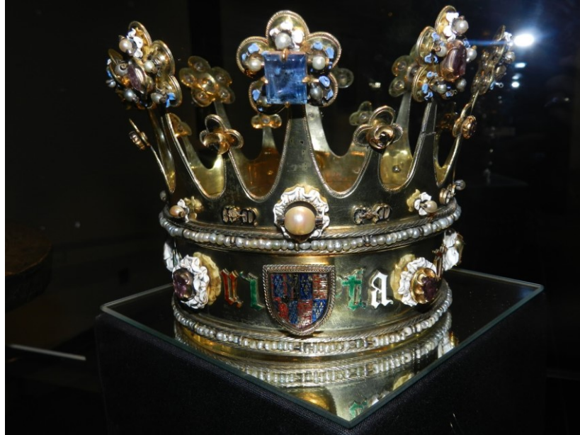
5. Anonymous , crown of Margaret of York, before 1461. Aachen Cathedral treasury, Aachen