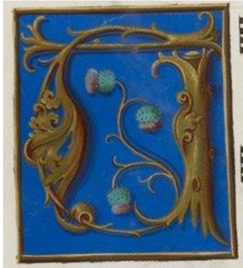
25. Motets , fol. 3v, Illuminated initial, 1516. British Library, London, sign. Royal 11 E XI