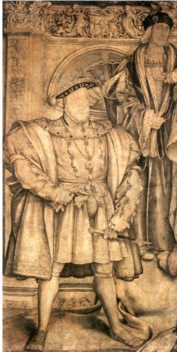
28. Hans Holbein the Younger, Henry VIII. and Henry VII., 1537, pen in black, with gray, brown, black, and red wash, paper mounted on canvas, 257,8 x 137,1 cm.