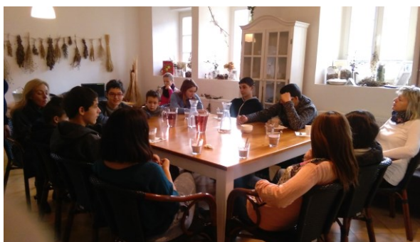
obr.6 – finanční gramotnost Společný program se ZPŠ