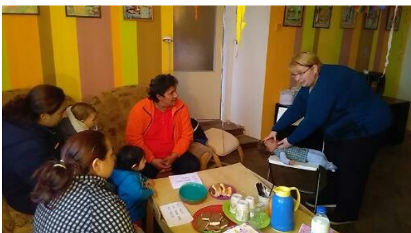
obr.5 – nácvik první pomoci u malého dítěte Klub matek