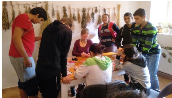
obr.2 – návštěva u zaměstnavatele Společný program