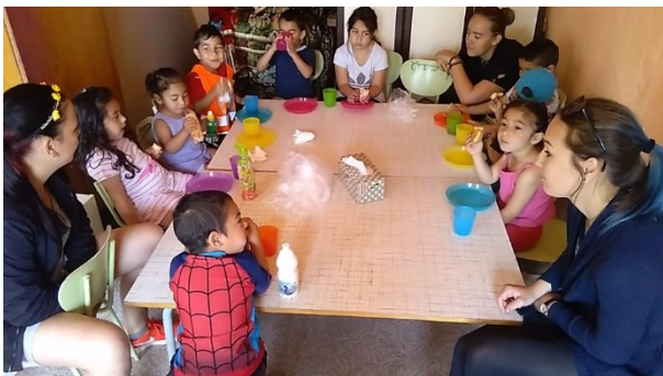
obr.1 – praktikantky ze střední školy sociálně správní Předškolní klub