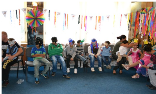
obr.4 – společná akce s rodiči a dětmi Volnočasový klub