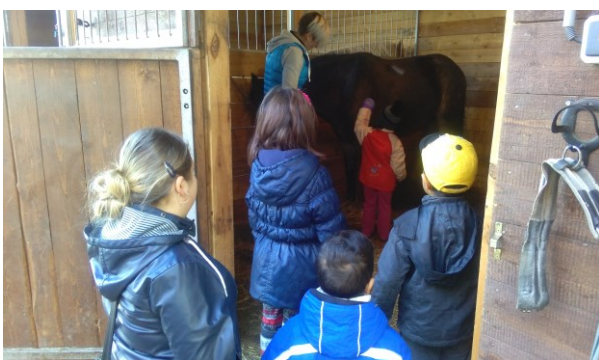
obr.3 – návštěva na jízdárně u koní Předškolní klub