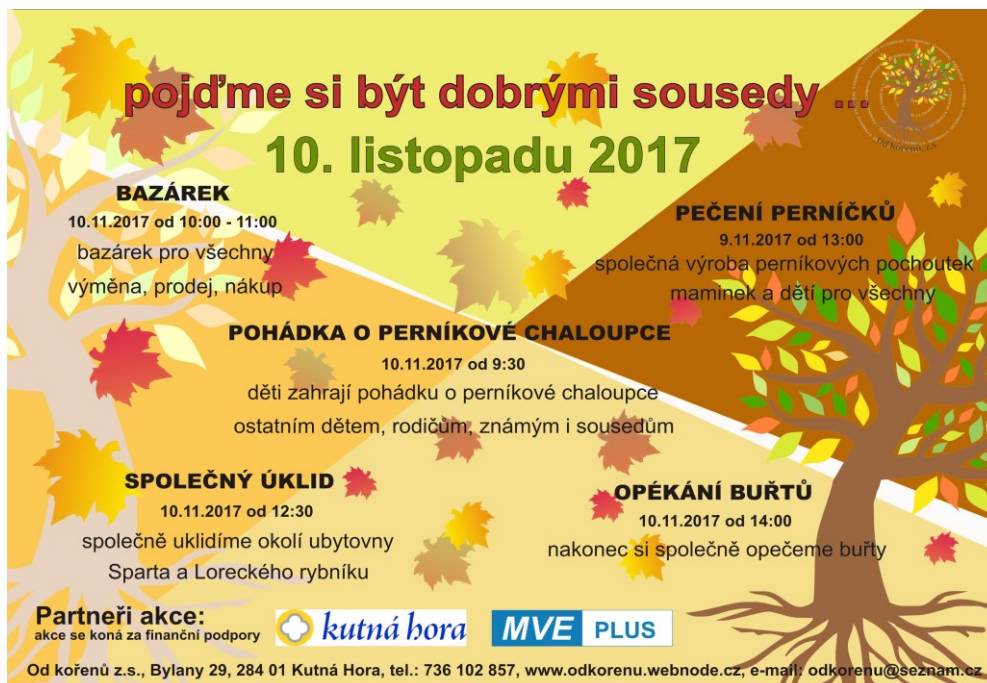
obr.2 – Celokomunitní akce