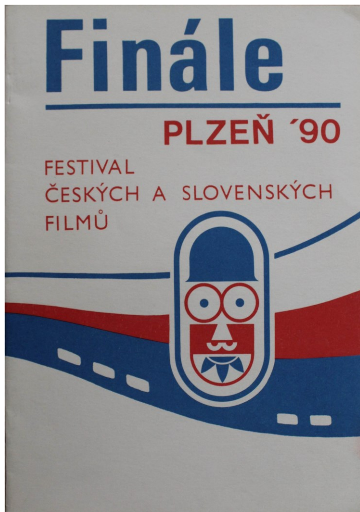
obr. 13: logo 1990