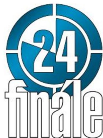
obr. 15: ukázky log z období do roku 2011, kdy bylo jejich součástí pořadové číslo ročníku