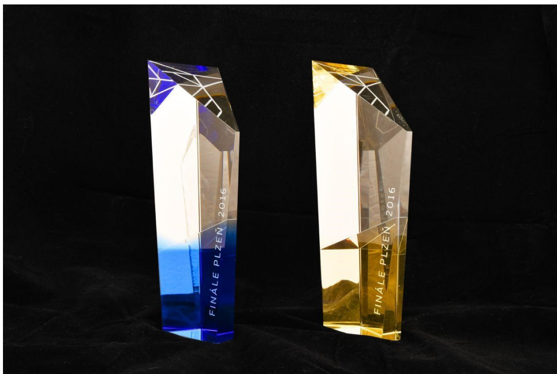
obr. 5: Zlatý ledňáček 2016