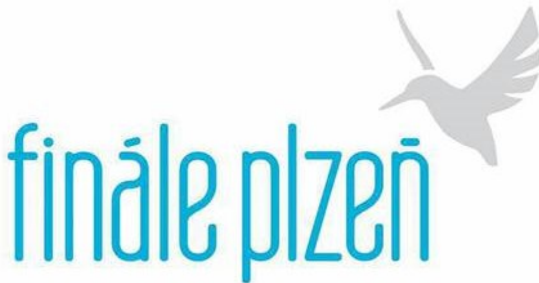
obr. 16: předchozí logo (2012–2015)