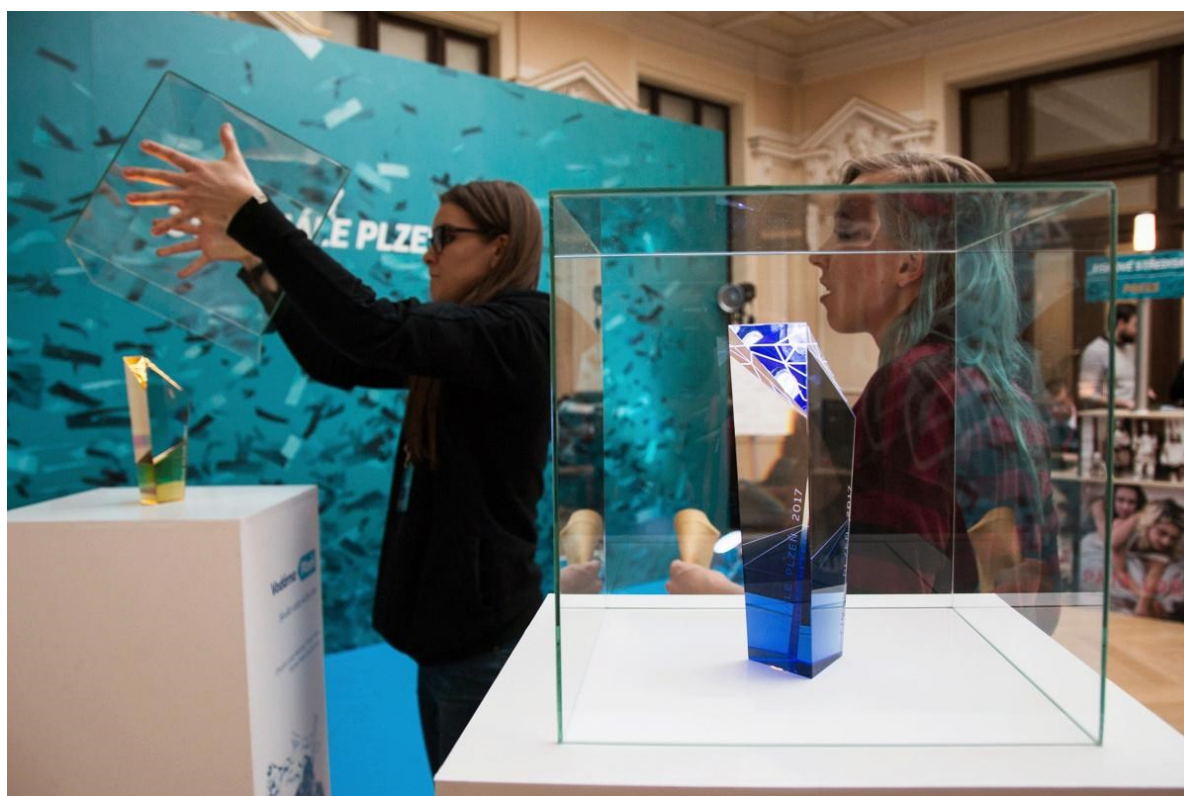
obr. 6: Zlatý ledňáček 2017