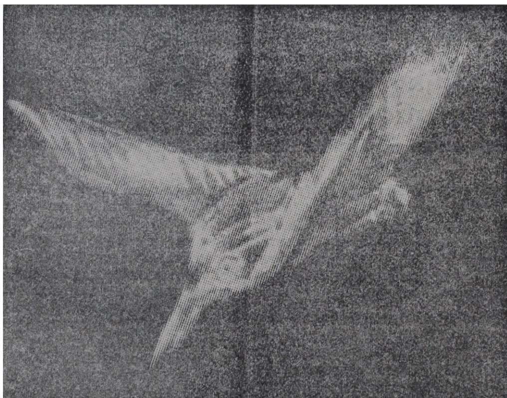
obr. 2: Zlatý ledňáček 1991