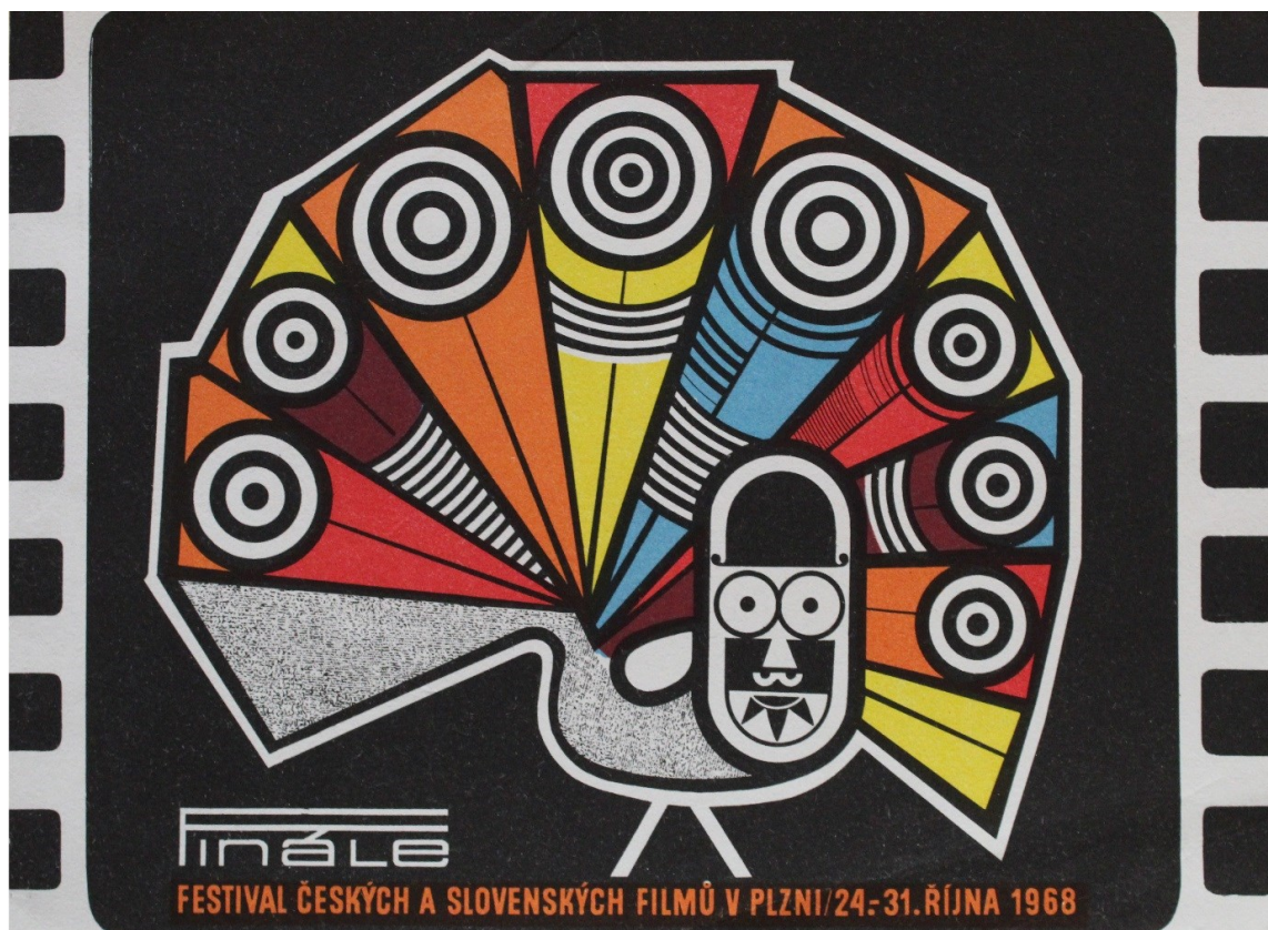
obr. 12: logo 1968