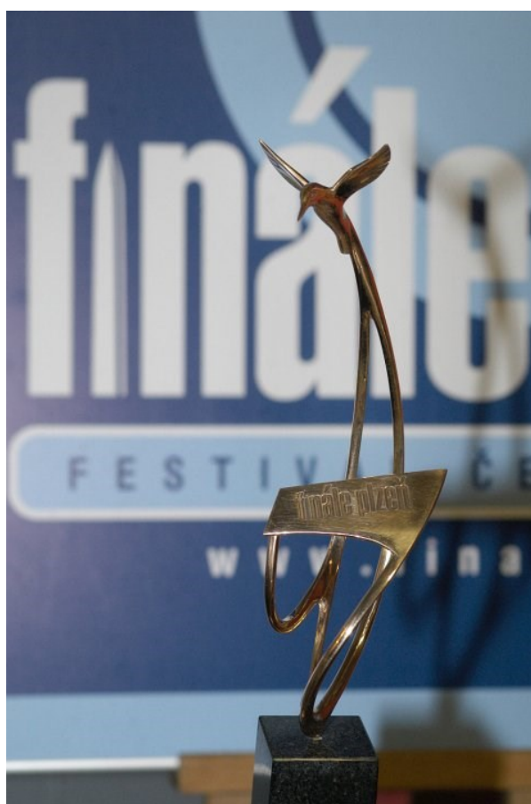
obr. 4: Zlatý ledňáček do roku 2015