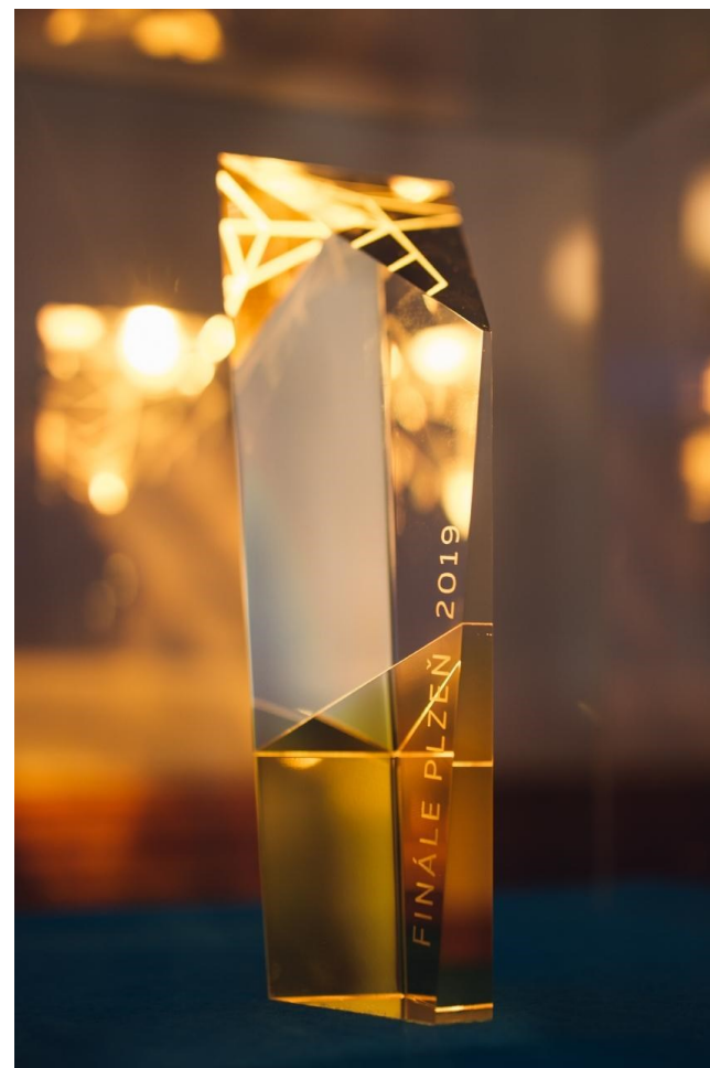
obr. 8: Zlatý ledňáček 2019