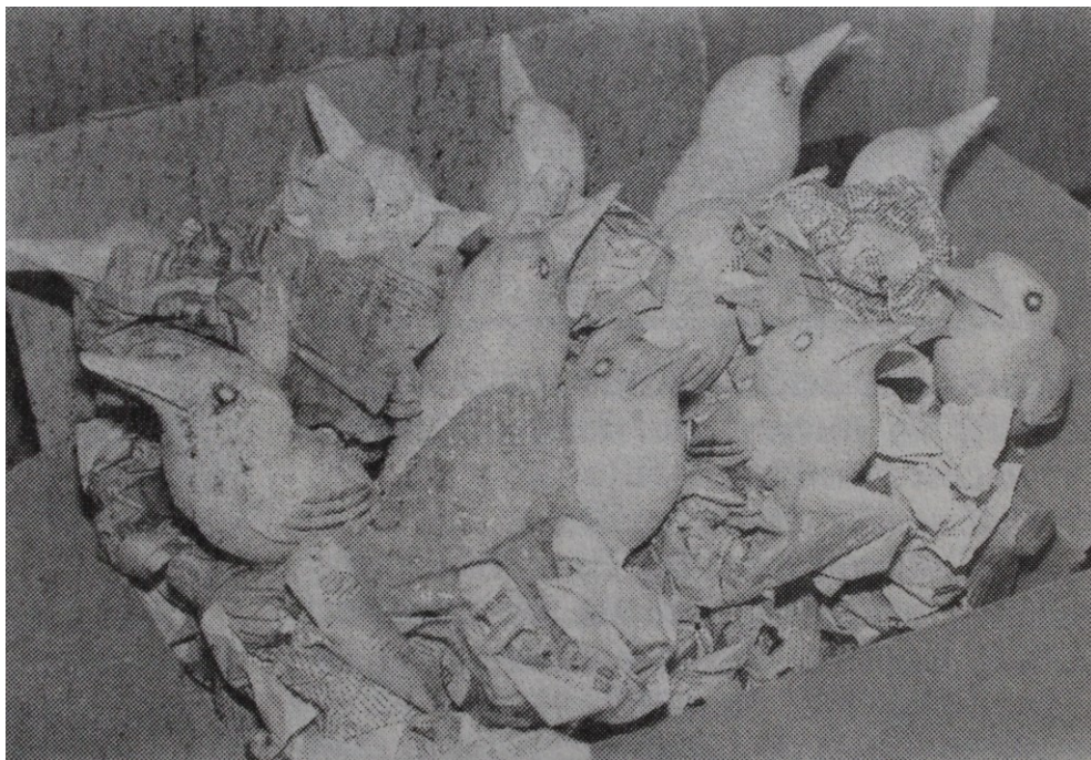
obr. 1: Ledňáček 1990

(zdroj: Plzeňské festivalové noviny, č. 5, 26. 10. 1990, s. 1, AMP, k. 7234)