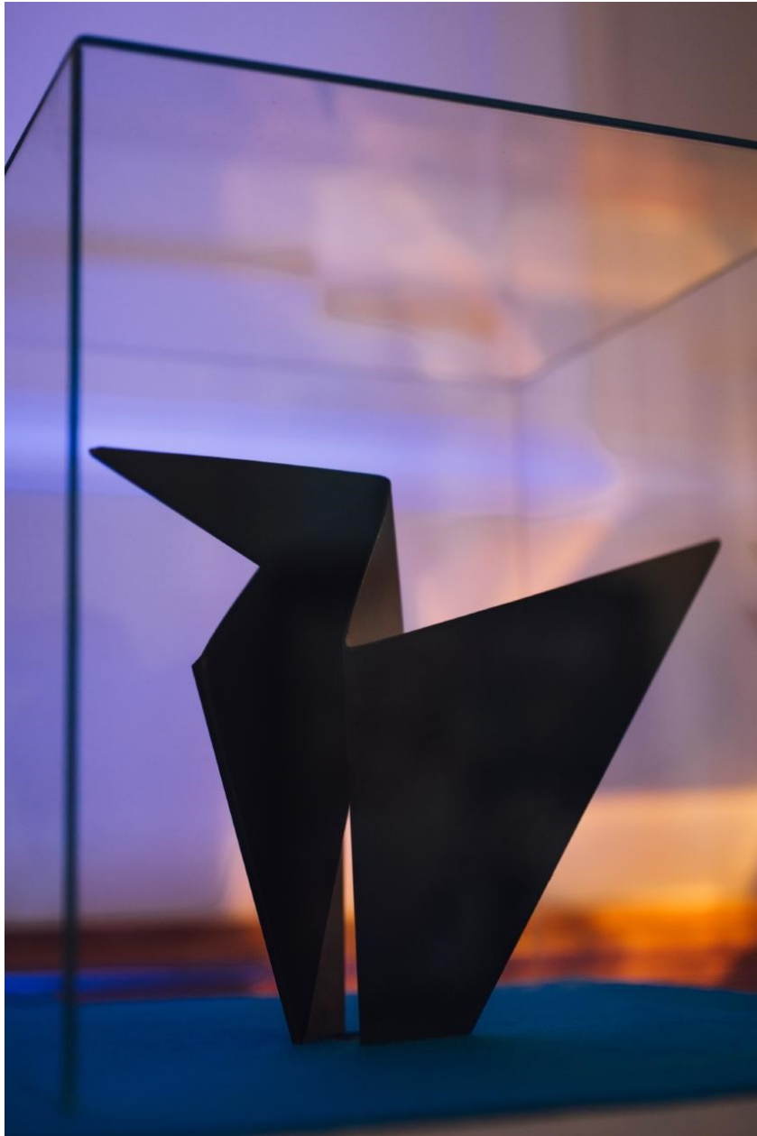
obr. 11: studentská cena 2019