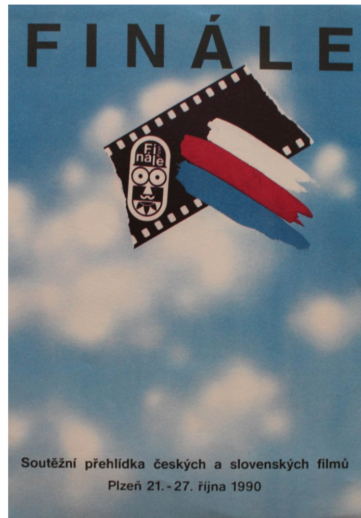
obr. 14: logo 1990