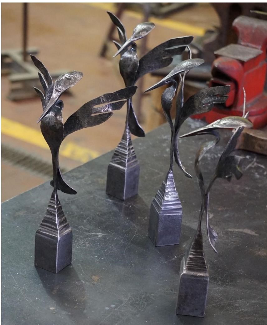
obr. 10: studentská cena 2018