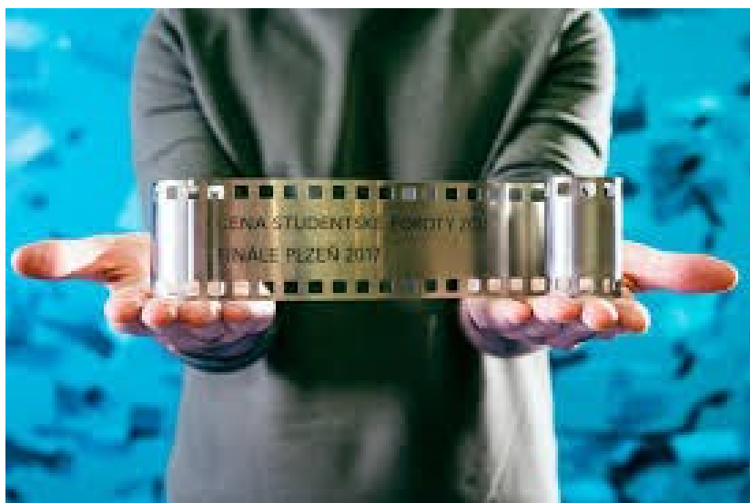
obr. 9: studentská cena 2017