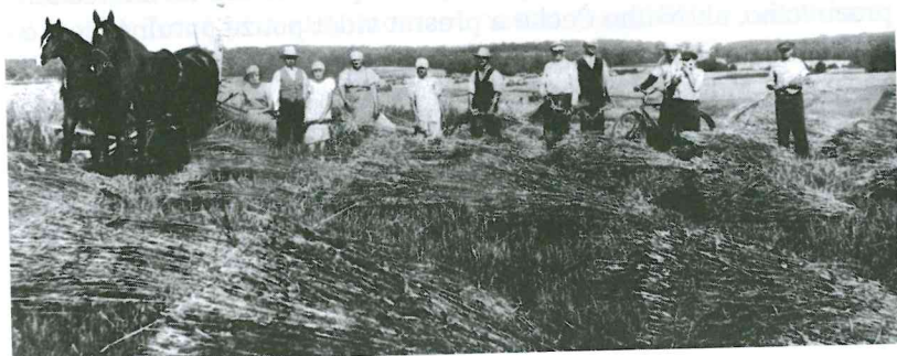
Žně na ruské Volyni

za kterých by tak Češi učinili. Argumentovali především tím, že neznalost anglického jazyka jim neumožňuje rovnoprávně se zapojit do společenského života v USA. Vysvětlovali také důvody, které je vedly k emigraci do Ameriky.