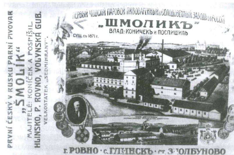
První český parní pivovar v Rusku

Pěstování průmyslových plodin, zvláště chmele, a s tím související koncentrace volného finančního kapitálu vytvořily předpoklady pro vznik průmyslových odvětví zpracovatelského charakteru či orientujících se na výrobu pro zemědělství. Ze zpracovatelského průmyslu