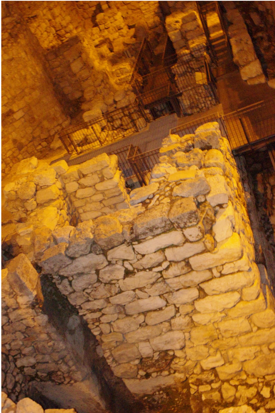
4. Budovy z doby královské na východním okraji Ofelu v Jeruzalémě - podle archeologa Eilata Mazara součást Šalamounových hradeb