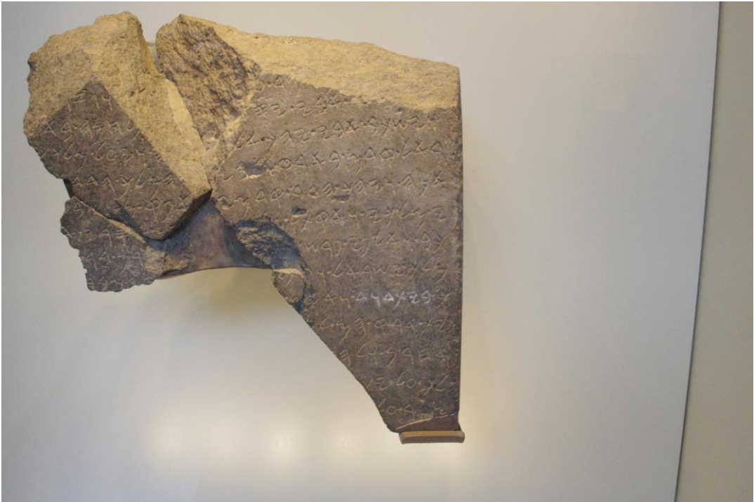
1. Stéla z Tel Danu v Izraelském muzeu v Jeruzalémě